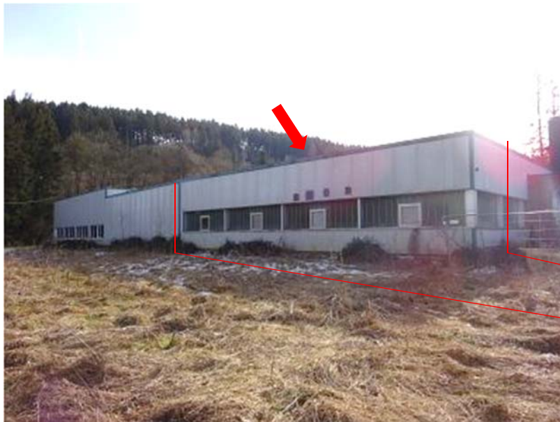
Hallengebäude Nordfassade, geschätzte Lage - Überbau Flst. 273