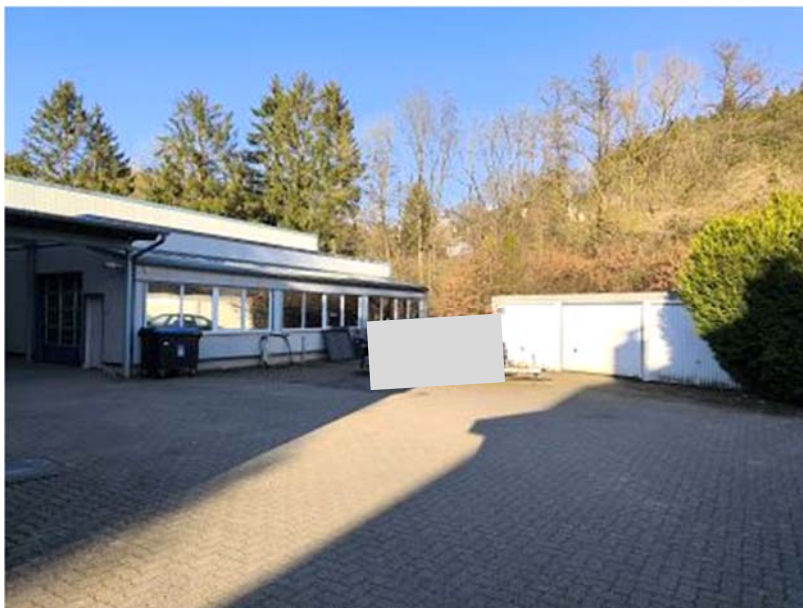
Zufahrt hintere Halle mit Anbau und Garagenblock (Flst. 272)