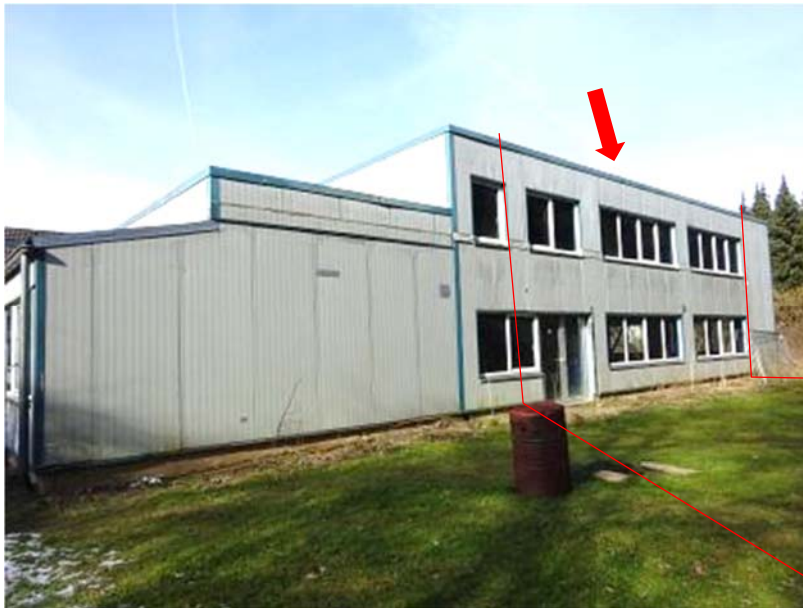
Ostfassade Halle und Anbau, geschätzte Lage - Überbau Flst. 273