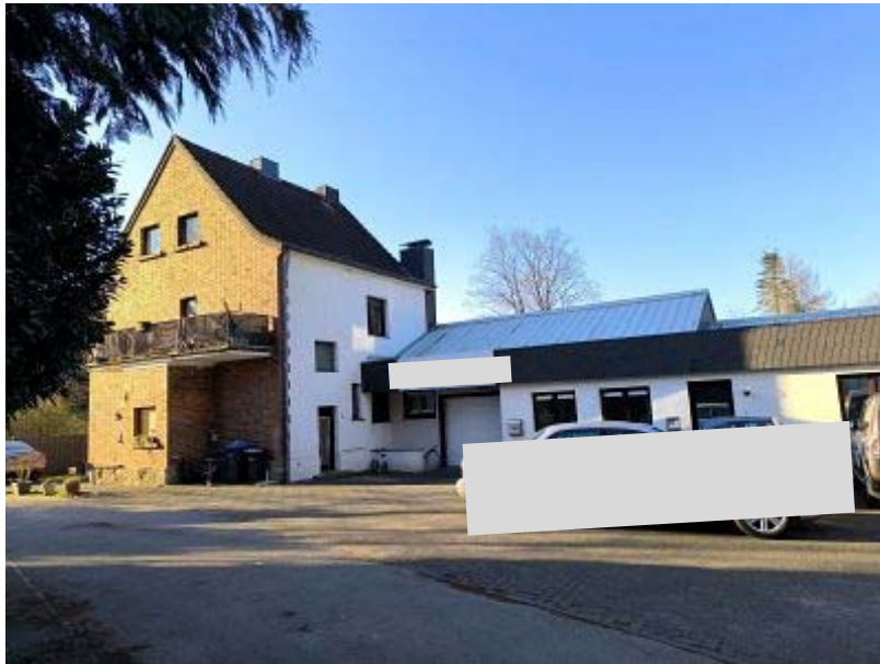
Rückansicht Wohnhaus und Zugang Hallensegment 1 (Flst. 272)