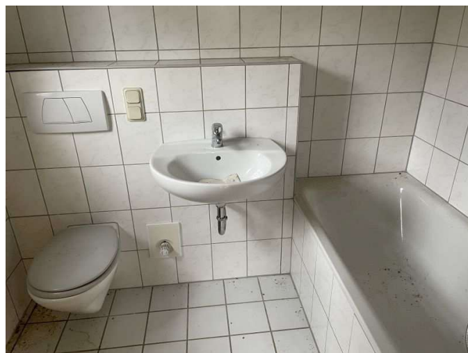
Bad im Erdgeschoss