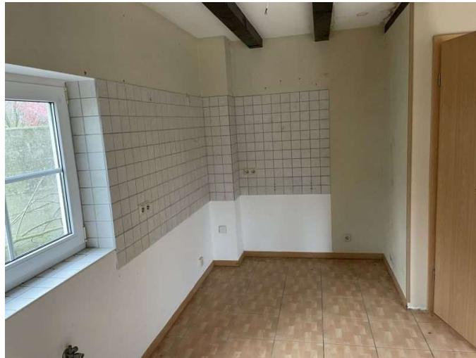
Kochecke im Erdgeschoss