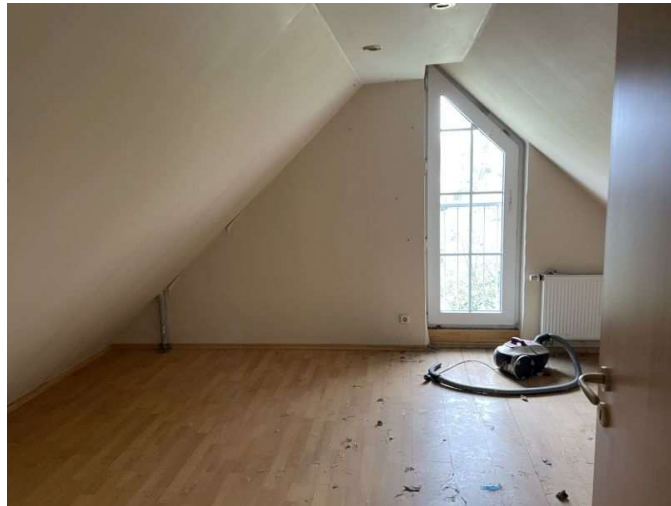
Zimmer im Dachgeschoss