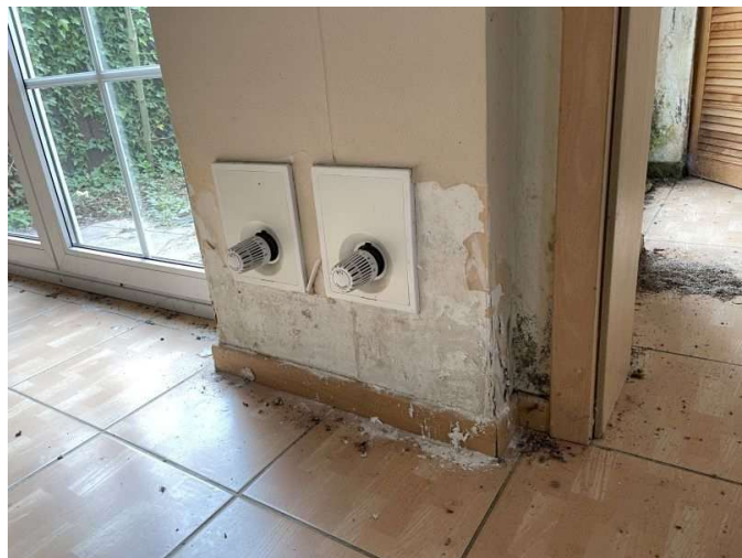
Feuchtigkeitserscheinungen im Wohnzimmer