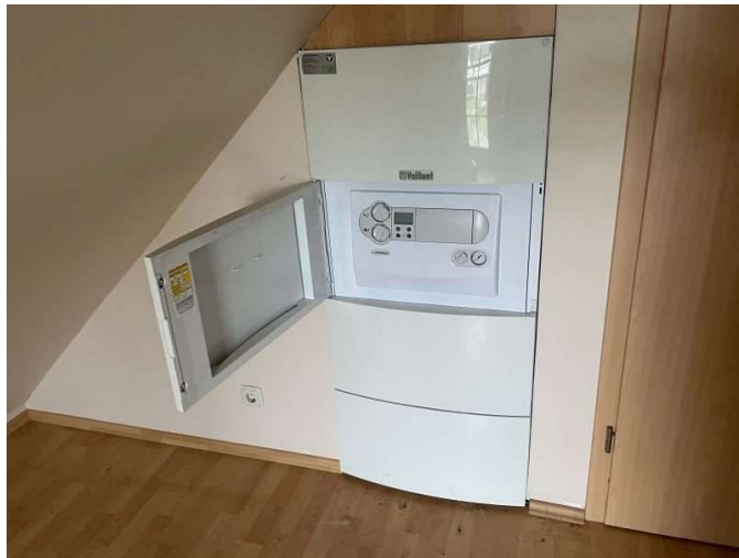
Gastherme im Dachgeschoss