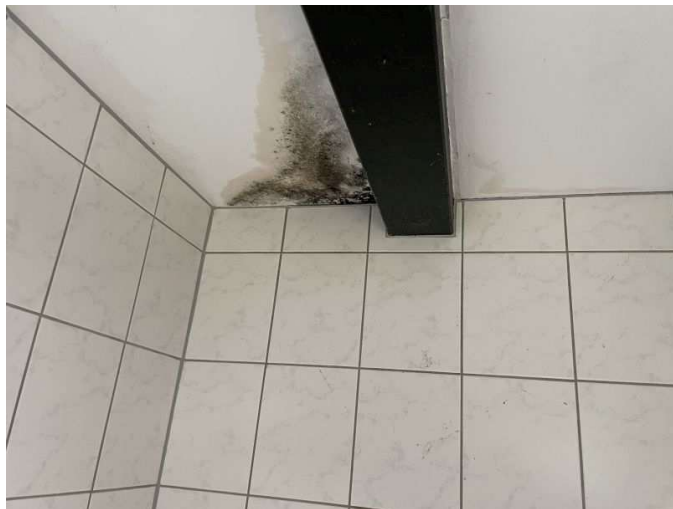
Feuchtigkeitserscheinungen im Bad im Erdgeschoss