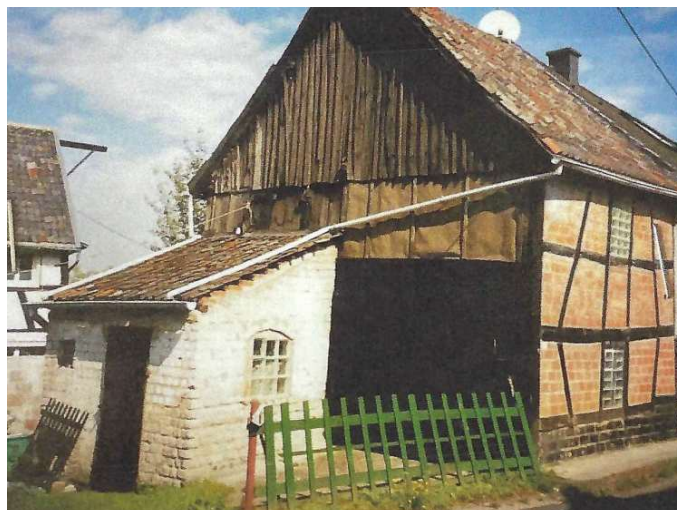
Gebäude Wielpützer Straße 25 b vor dem Umbau