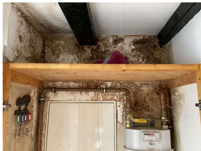
Feuchtigkeitserscheinungen im Flur im Erdgeschoss