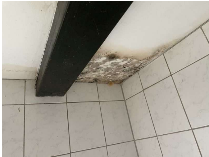
Feuchtigkeitserscheinungen im Bad im Erdgeschoss