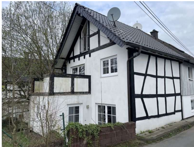
Einfamilienhaus Wielpützer Straße 25 b