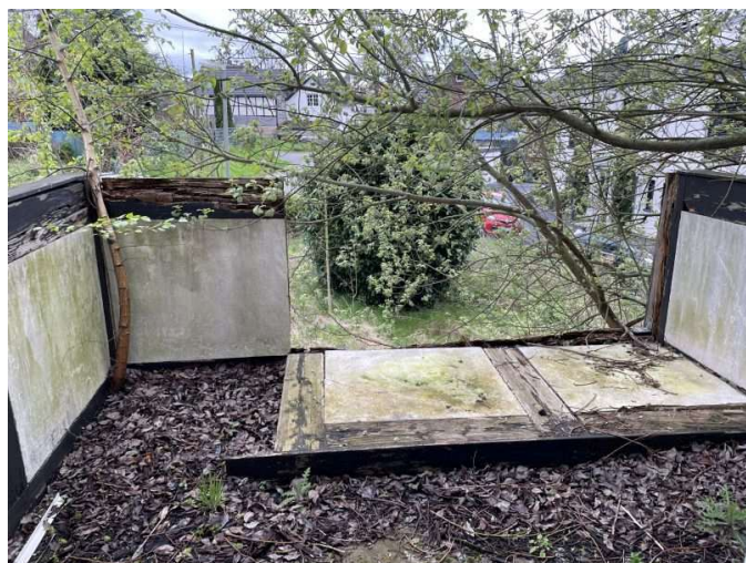
Balkon im Obergeschoss