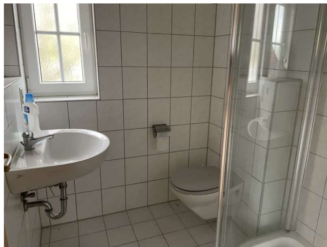
Duschbad im Obergeschoss