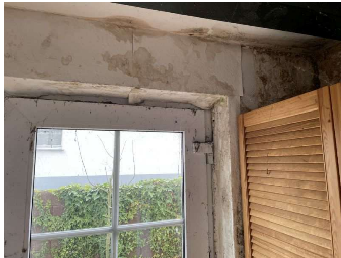
Feuchtigkeitserscheinungen an der Hauseingangstür