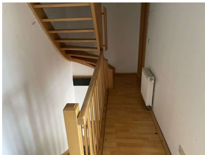
Treppe zum Dachgeschoss