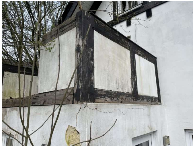
Balkon im Obergeschoss