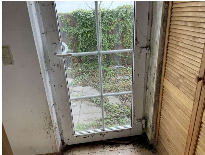
Feuchtigkeitserscheinungen an der Hauseingangstür