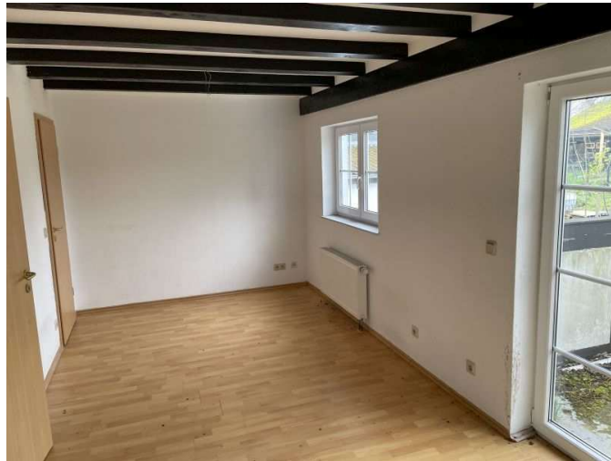
Schlafzimmer im Obergeschoss