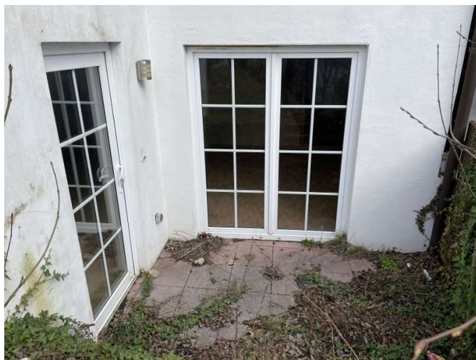
Hauseingang mit Terrasse