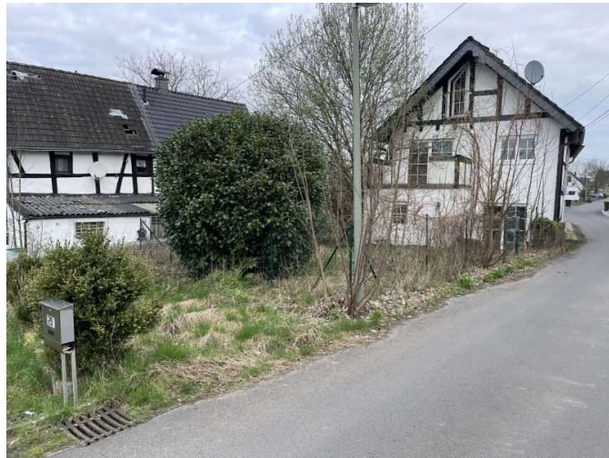
Grundstück Wielpützer Straße 25 b