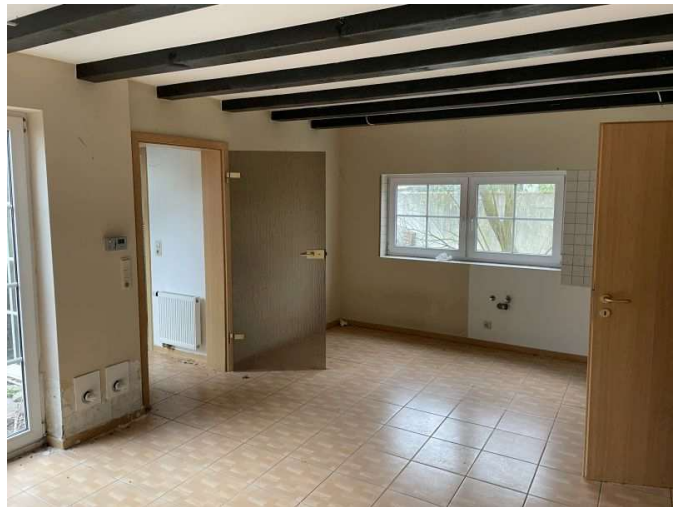
Wohnzimmer im Erdgeschoss