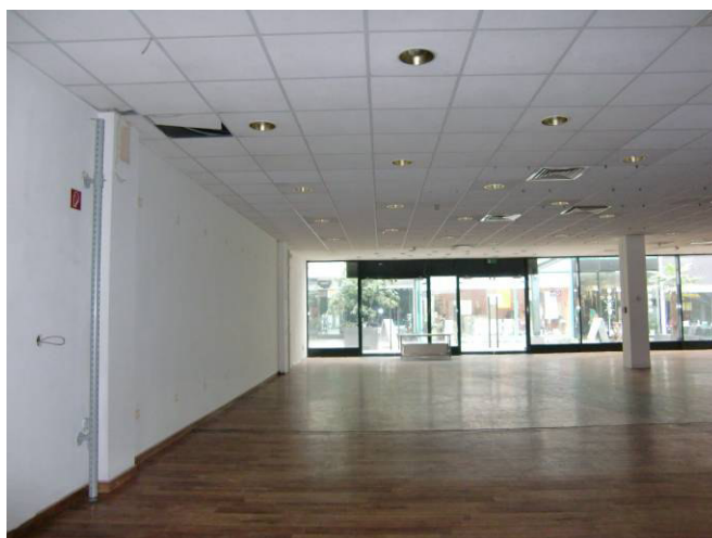
Ladenlokal mit Erweiterungsfläche