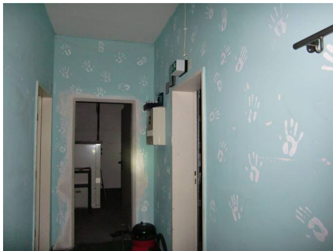
Flur zu den Personalräumen