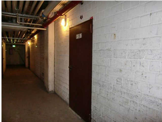
Zugang zum 2. Lagerraum T6 nur aus der Andienungszone