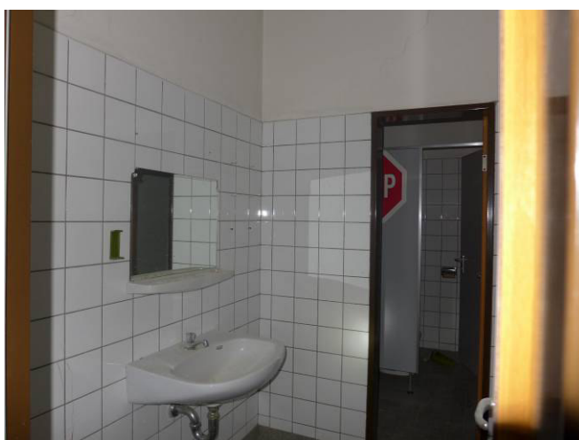
WC-Raum 1 (rechts) T4 im 1.UG (Achse H/14)