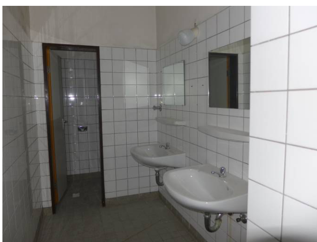
WC-Raum 2 (links) 1.UG (Achse H/14)