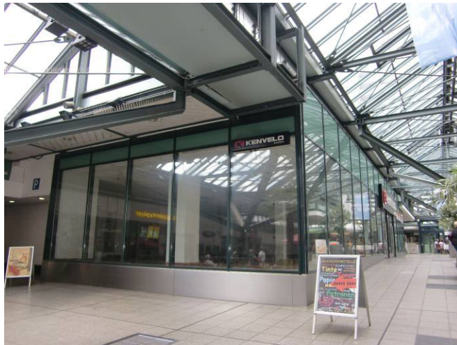
Eckfassade (Erweiterungsfläche) Ladenlokal T6 1. OG