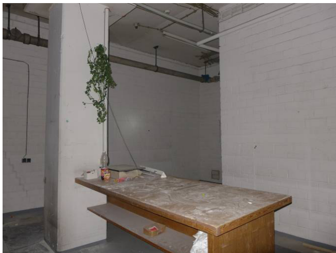
vorderer Kellerraum T 4 Bereich (Achse H/15)