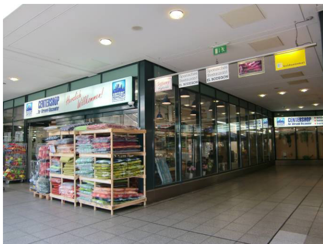
Eingangsvorbau (AMBV) Bereich T6 zu Passage