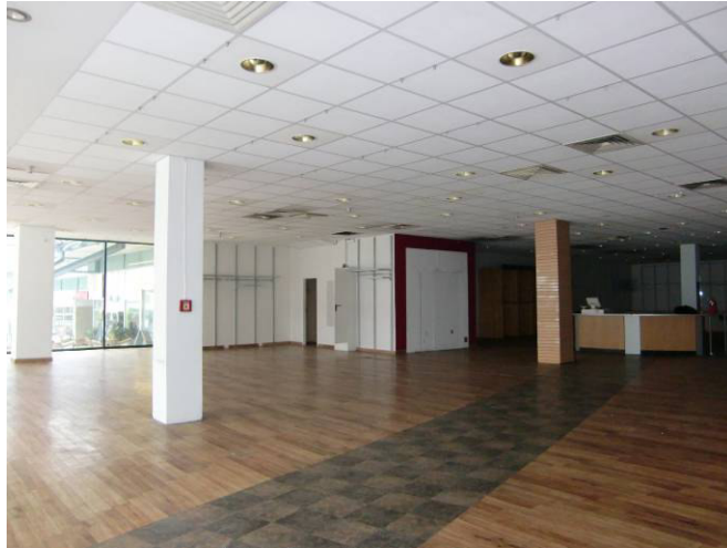
Ladenlokal (Achse K-L/13)