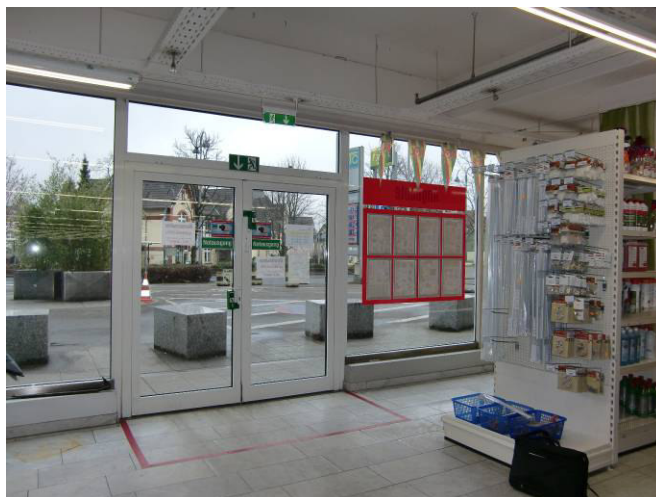
Eingang Wöhlerstraße T4 (Warenannahme)