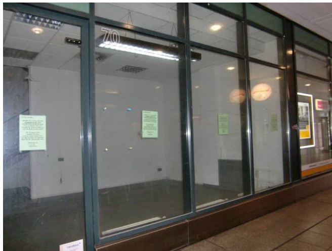
Eingang kleines Ladenlokal T6