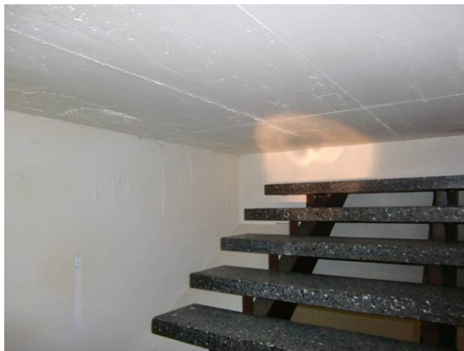
stillgelegte Treppe zum 1.OG (Teilbereich 3)