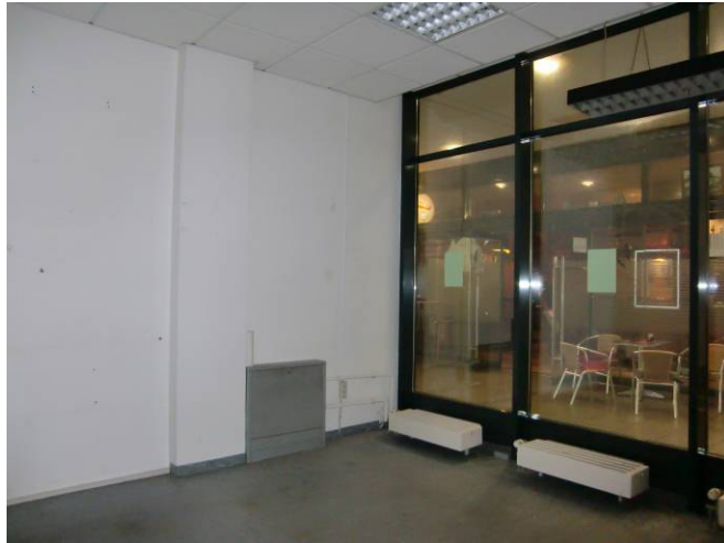
Verkaufsraum Erdgeschoss (Achse M/13)