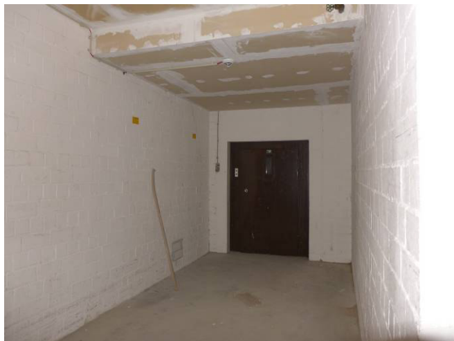
Kellerflur mit Aufzug (außer Betrieb)