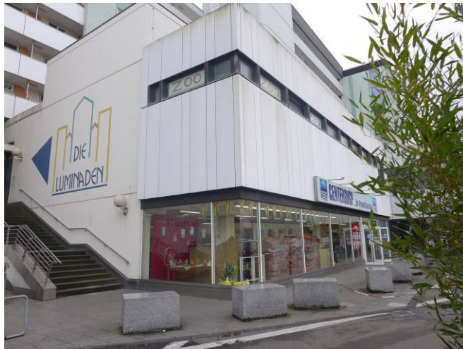
Rückseite Eingang Wöhlerstraße (Warenannahme)