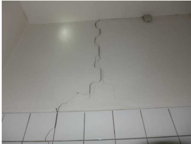
Riss in Kellerwand (Achse H/14)