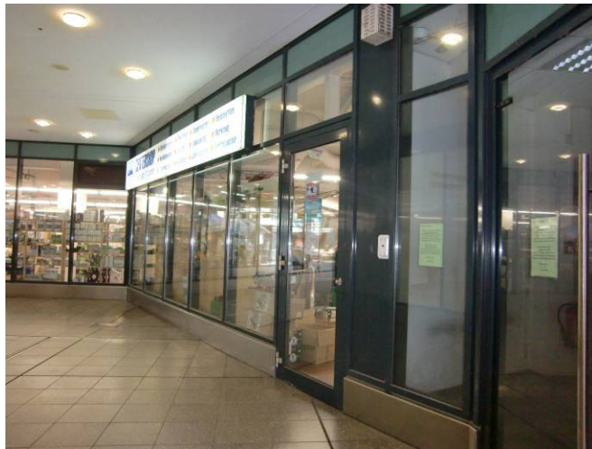
Fassade T6 (Achse L/13)