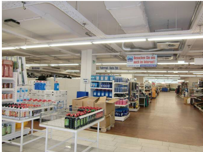
Verkaufsraum T4 (Achse E/14)

Innenaufnahmen zu Lager- und Nebenräumen s. Originalgutachten.