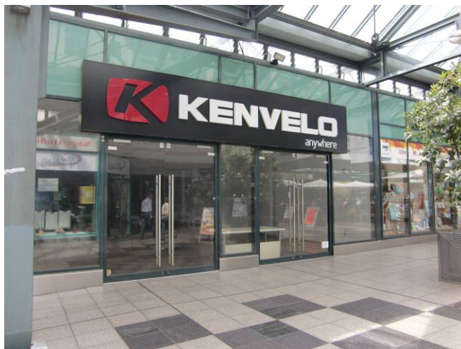
Eingang T6 1. OG Schrägstraße