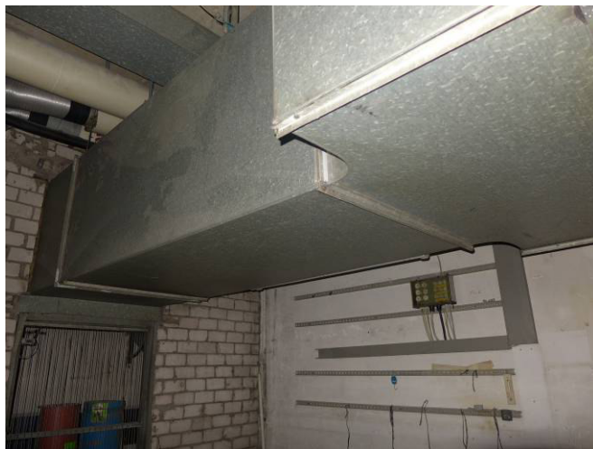
hinterer Kellerraum T4 mit Lüftungskanal