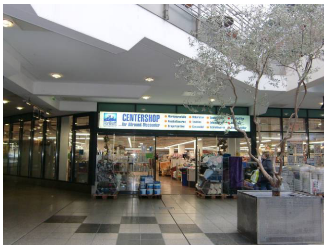
Eingang/Ausgang Achse H-J/11 Bereich T4/T5