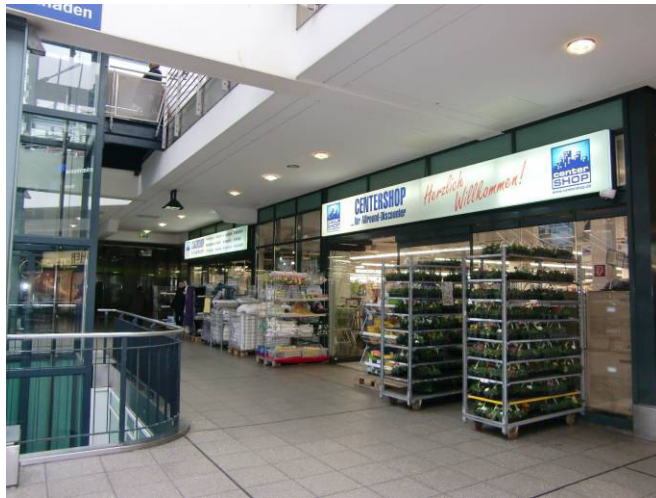
Eingangsbereich mit (AMBV-) Vorraum Centershop Luminaden