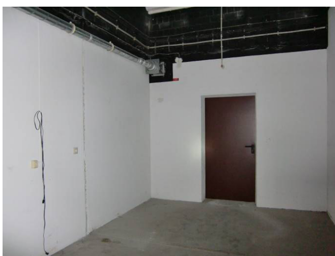
Lagerraum 1. UG mit Ausgang zur Andienungszone