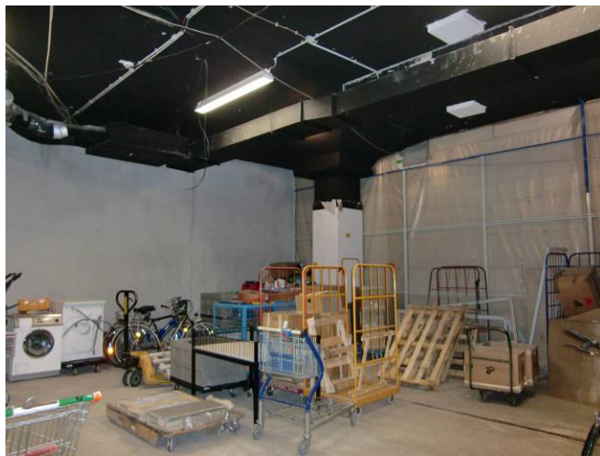
2. Lagerraum T6 im 1. UG