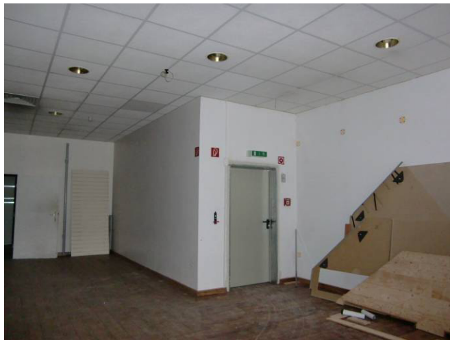
Zugang vom EG durch allg. Treppenhaus