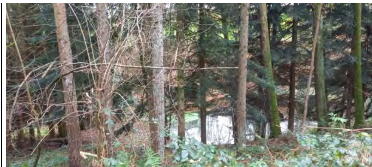
Abb.9 Fl.St. 8-120 Waldbestand im Teichbereich (Lärche, Küstentanne, Erle)