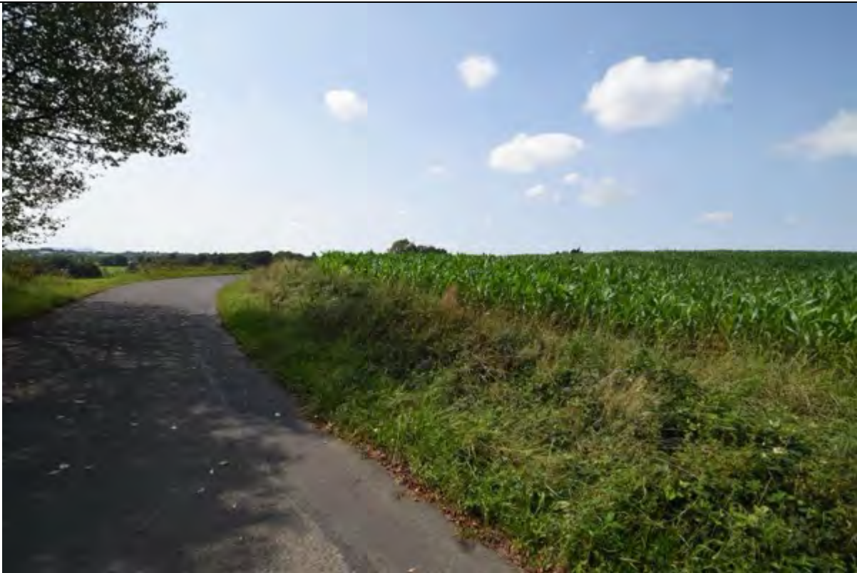
Bild 37 Blick von der Wegkreuzung Schöneschofer Straße über Flurstück 346 mit Maisanbau