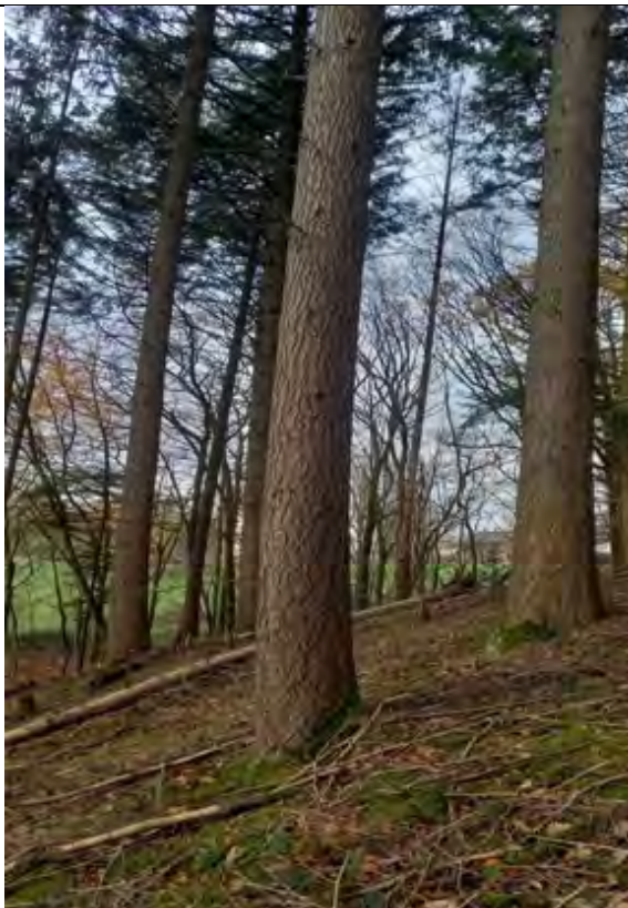
Abb.15 FISt. 7-177 Douglasien Baumholz guter Qualität