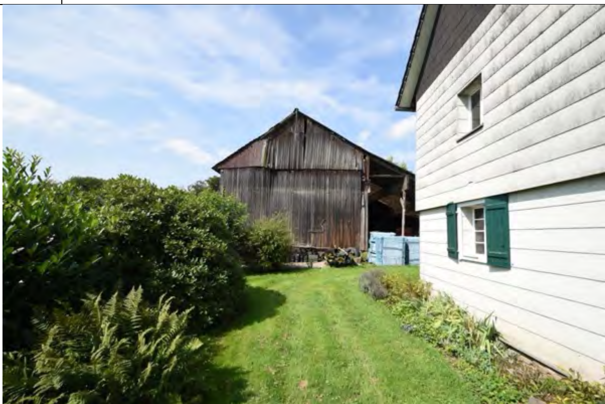
Bild 10 südlicher Giebel des Altenteilerhauses mit Blick auf den östlichen Giebel des Scheunengebäudes