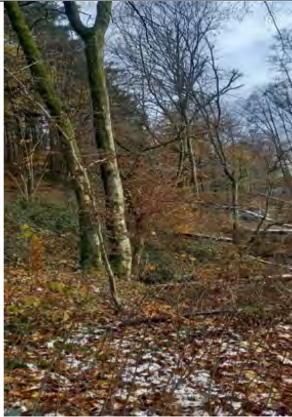
Abb.12 Fl.St. 9-113 und 115 Blick in Richtung O