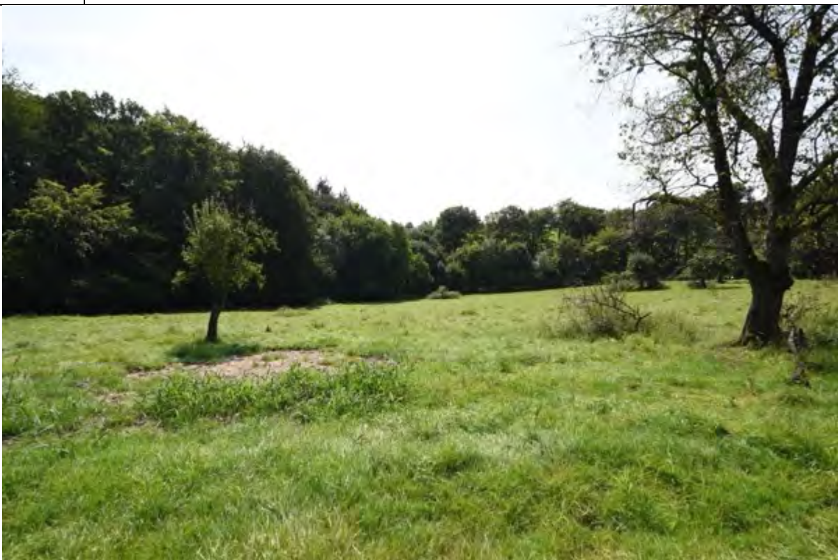
Bild 30 Grünlandanteil Flurstück 147