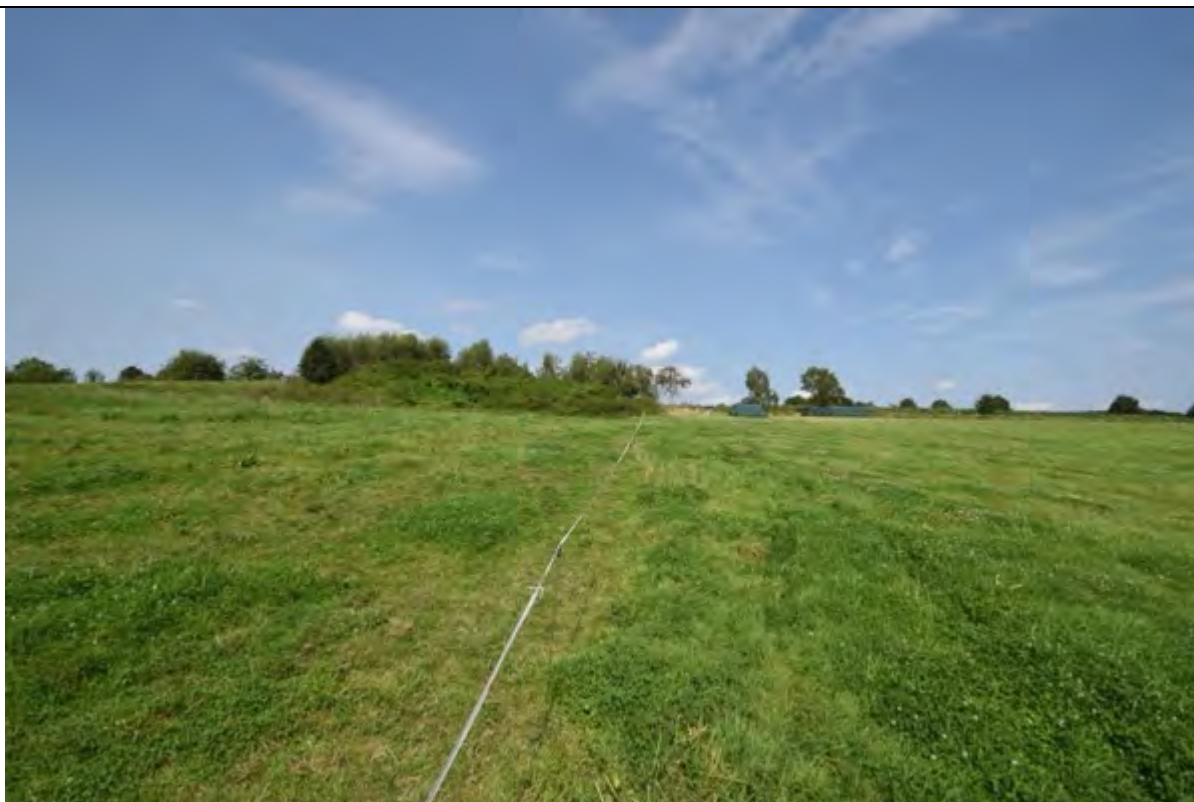
Bild 33 Blick von der Waldgrenze Richtung Norden über das Flurstück 177