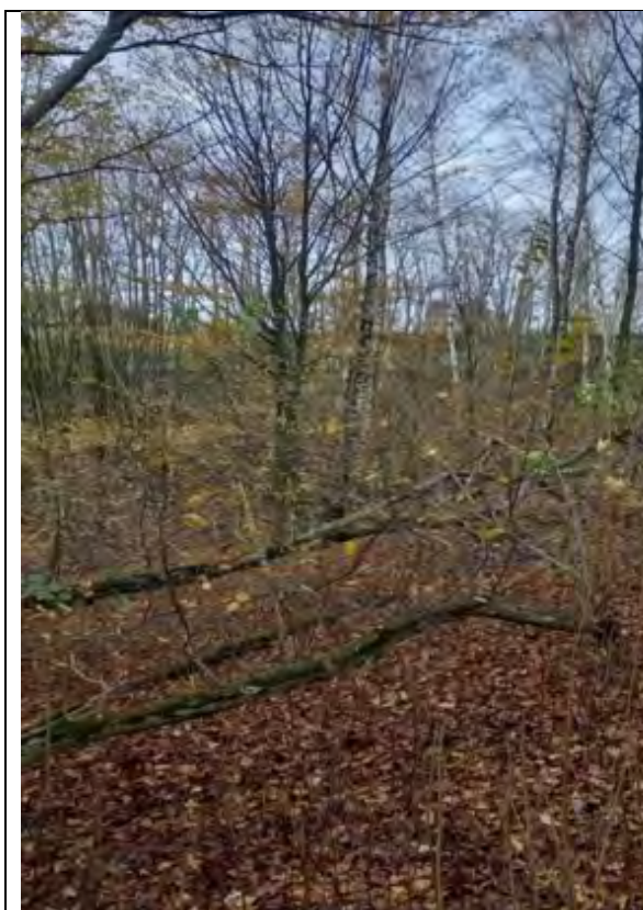
Abb.19 FIST. 7-179 und 9-229 Minderwertiges Weichholz mit Ahorn (Jungwuchs bis Stangenholz)