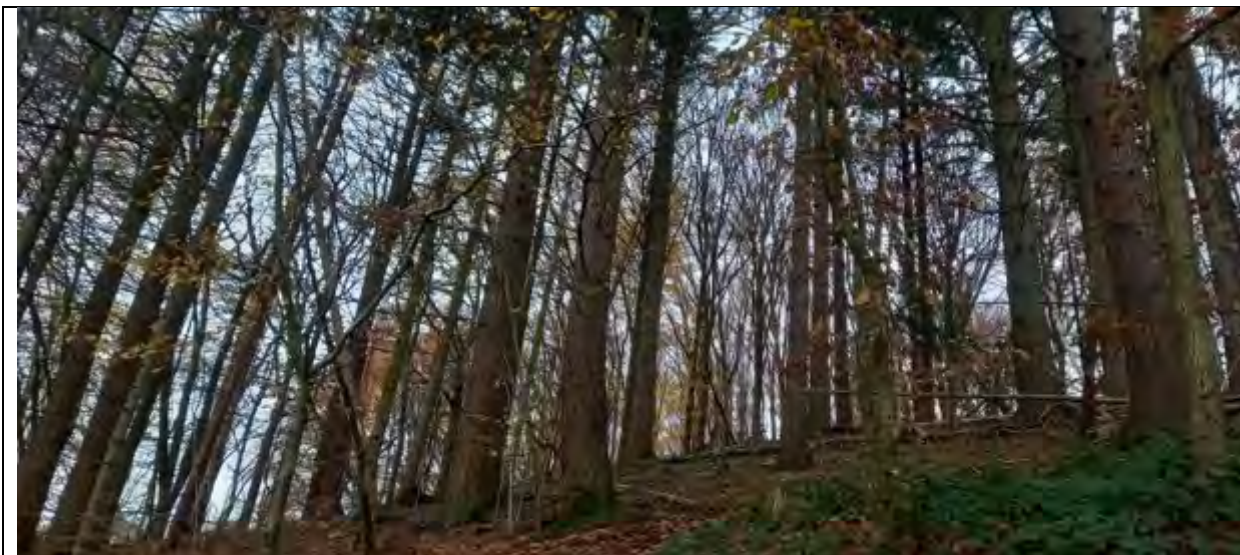
Abb. 5 Fl.St. 7-177 Douglasienbestand (Blick in Richtung hangaufwärts)