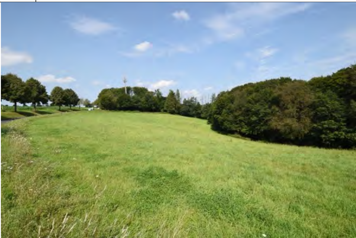
Bild 40 Blick über Flurstück 307 zu Flurstück 5 mit Fernmeldemast