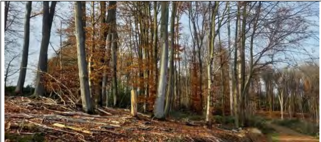
Abb.1 Fl.St. 7-5 Waldbestand in Teilbereichen licht bis lückig