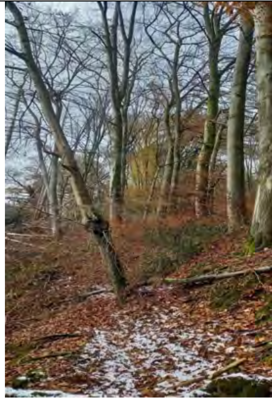
Abb.14 FISt. 9-115 Altholz Blick in Richtung W