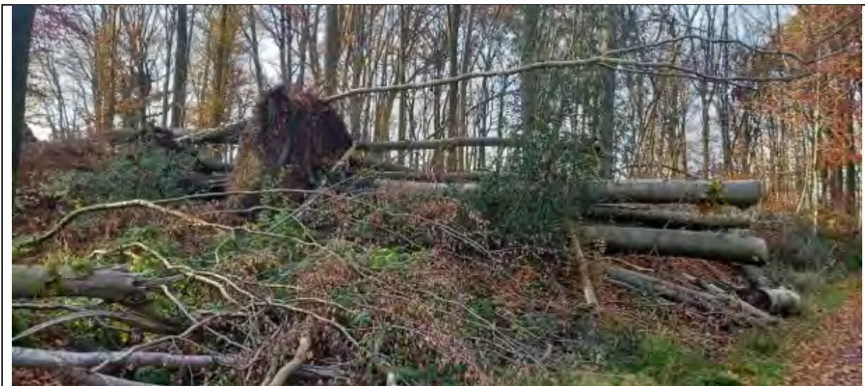
Abb.2 Fl.St. 7-5 Hohe Schadenholzmengen (Sturmholzposition)