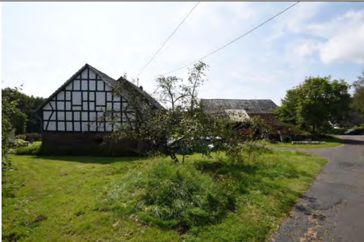
Bild 9 nördlicher Giebel des Altenteilerwohnhauses mit Anbau; rechts im Bild Dachflächen des Scheunengebäudes Flurstück 147