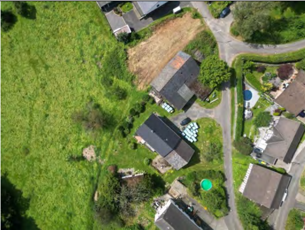
Bild 3 Flurstück 147 mit Altenteilerhaus und Scheunengebäude