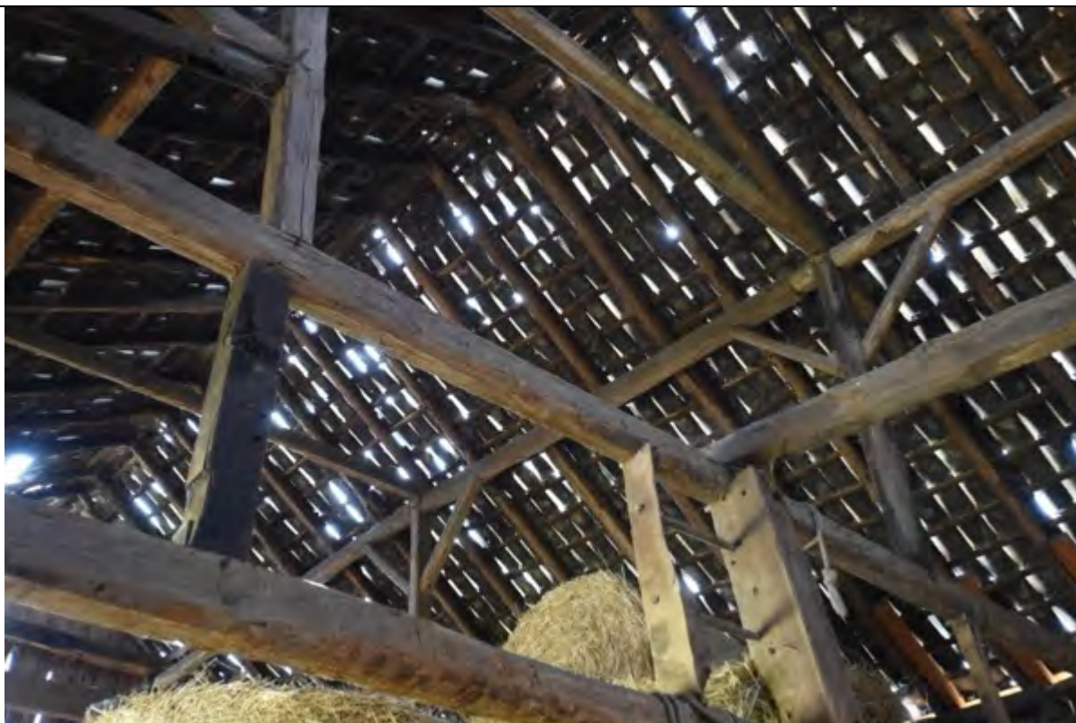
Bild 15 Innenansicht des Scheunengebäudes Flurstück 147