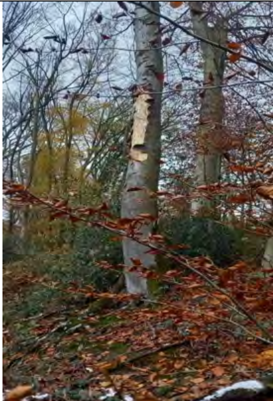
Abb.13 FISt. 9-115 Sonnenbrandexposition (wg.Abholzung des vorgelagerten Kalamitätsfichtenbestandes im S)