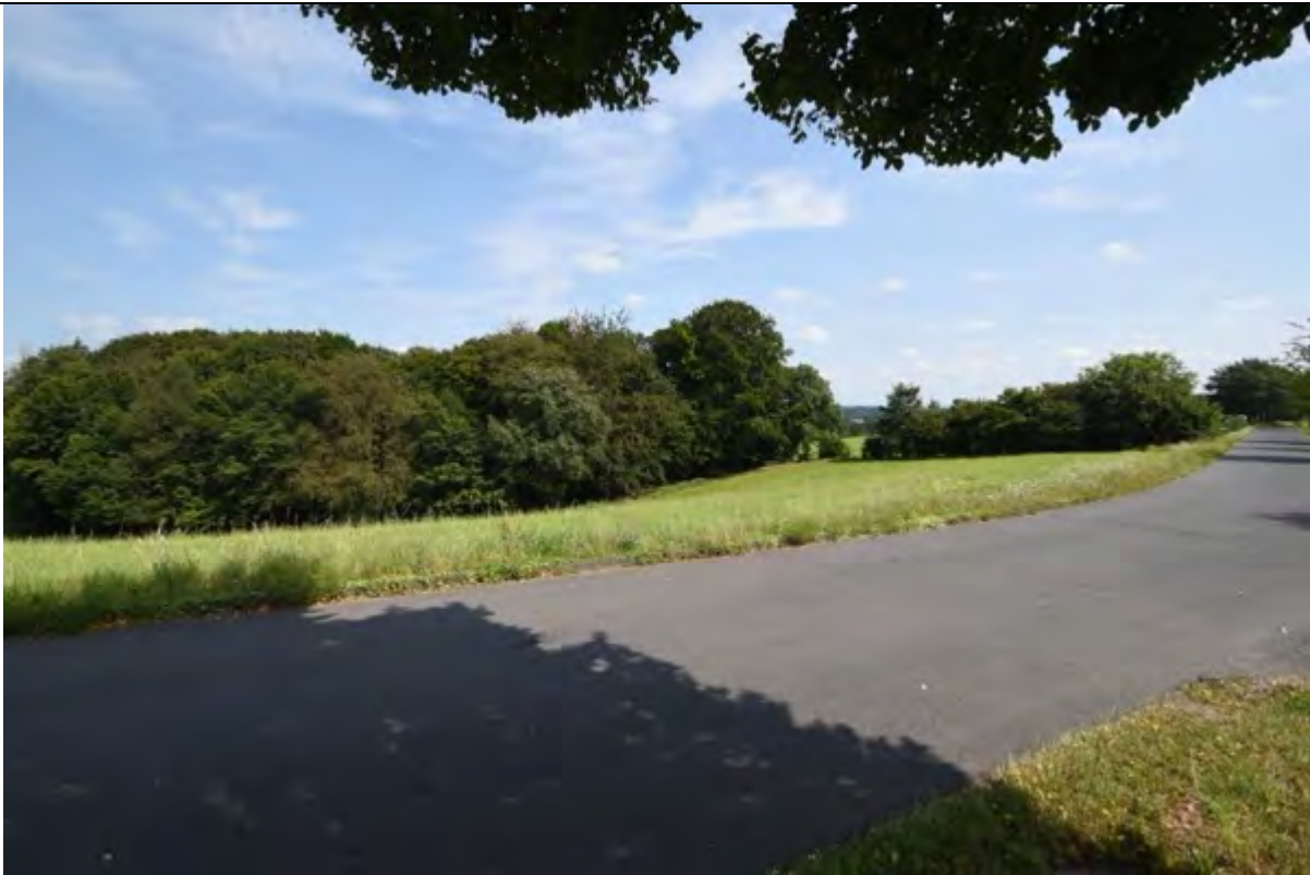
Bild 39 Blick über Flurstück 307 an der Schöneshofer Straße