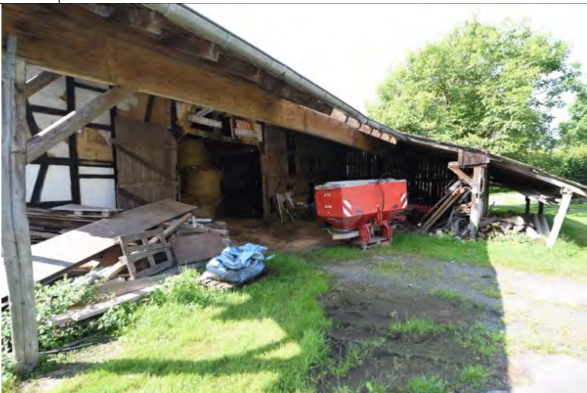
Bild 14 Vorplatz des Scheunengebäudes Flurstück 147