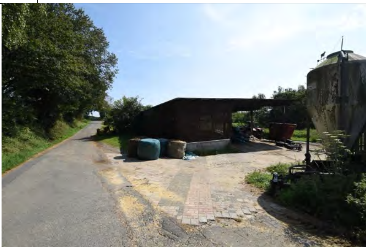
Bild 24 Blick auf den südwestlichen Giebel des Jungviehstalls auf Flurstück 229