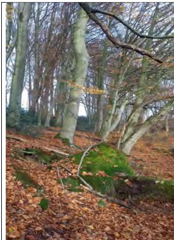
Abb.17 Fl. St. 7-177 Waldbestand im O Übergang zu FIST. 7-175