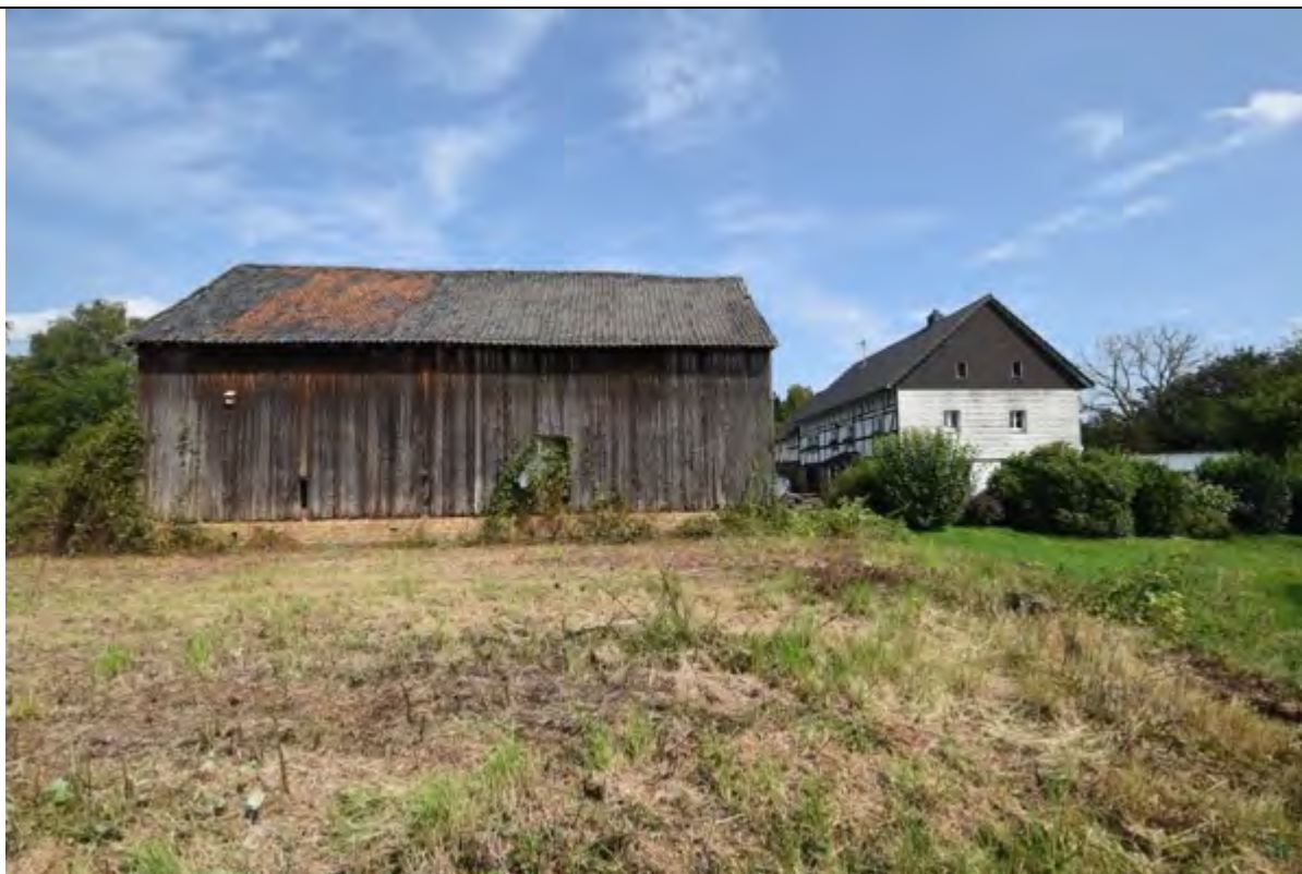
Bild 11 Rückseite, südliche Seite des Scheunengebäudes links und südlichem Giebel des Altenteilerhauses rechts