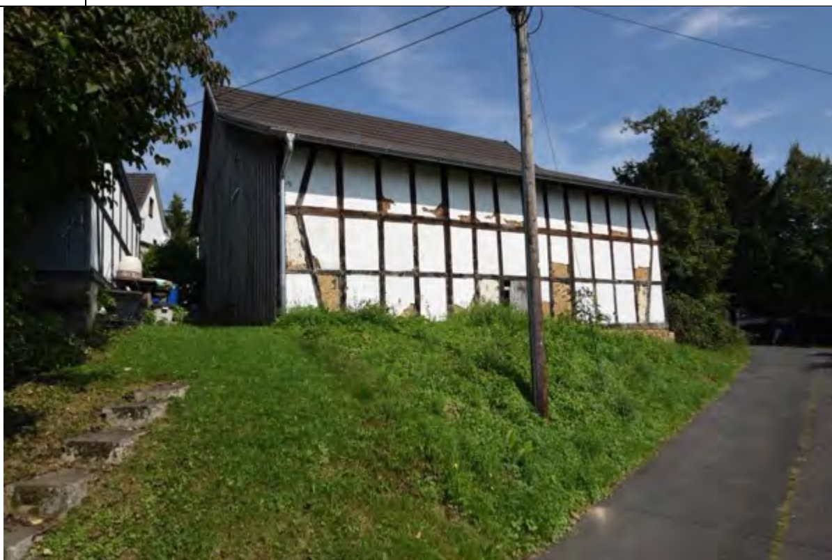
Bild 16 südliche Seite des Gebäudes auf Flurstück 140