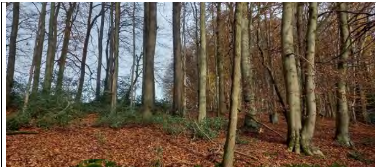
Abb.8 Fl.St. 7-307 Bestandesinnere Blick hangaufwärts in Richtung N-O