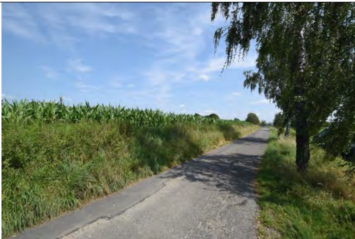
Bild 35 Wirtschaftsweg zwischen den Flurstücken 180 rechts und 346 (als Ackerland mit Mais bestellt) links