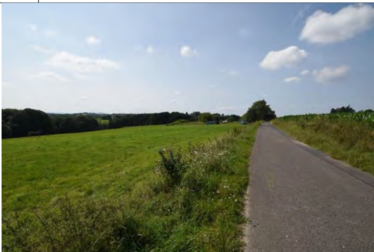
Bild 36 Blick über das Flurstück 180 Richtung Südwesten Ortslage Birken mit der Hofstelle und rechts im Bild Flurstück 346 mit Maisanbau