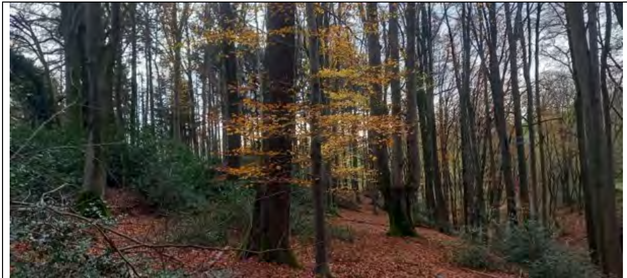
Abb.7 Fl.St. 7-177 Bestandesinnere (im Westen) Blick hangabwärts in Richtung S zum Fl.St. 9-147 gegenüberliegender Hang