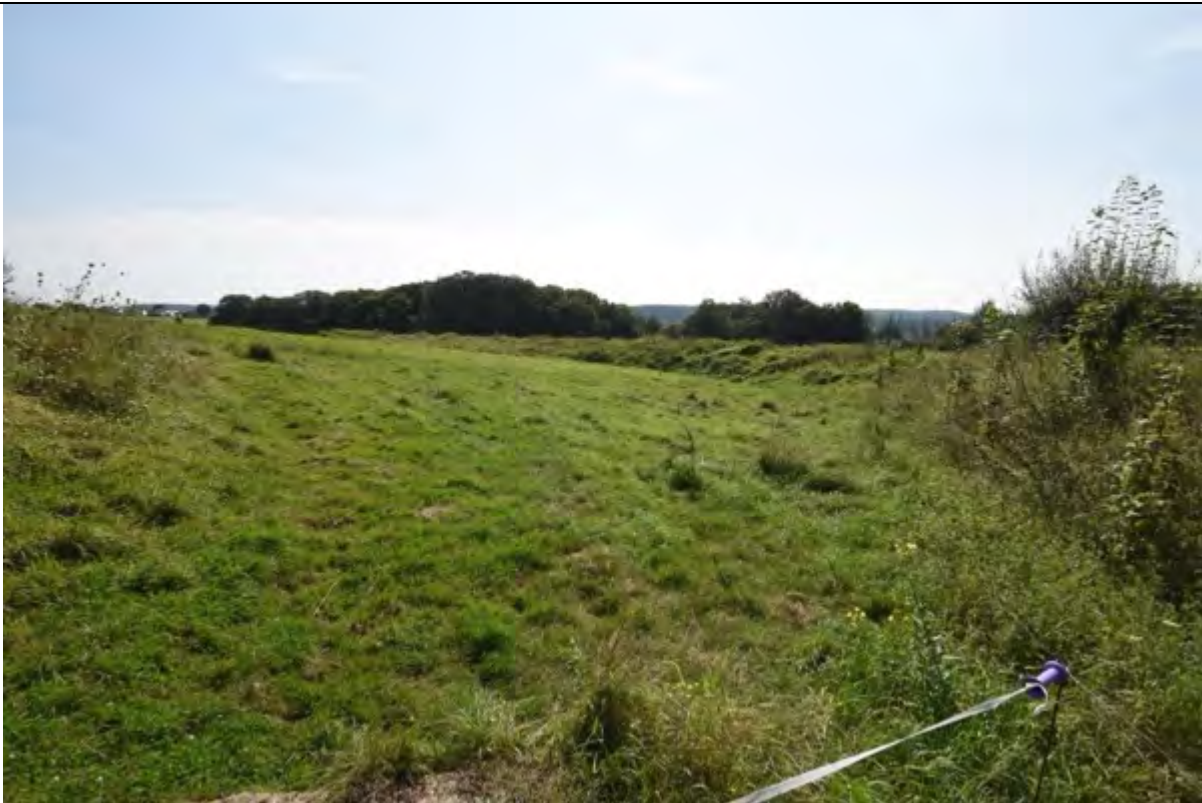
Bild 29 Schutzwall zur Biogasanlage und Grünland auf den Flurstücken 179 und 177