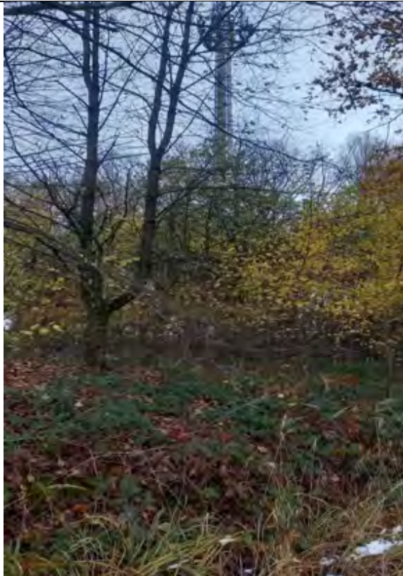
Abb.11 Fl.St. 7-5 Dem Sendemast vorgelagerte Gehölzfläche (Weichholz) im S der Parzelle