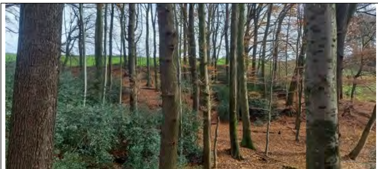
Abb.6 Fl.St 7-177 Buchen, Eichen-Altholz (Bestandesmitte)