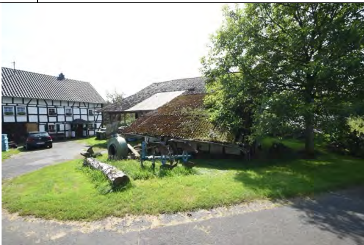
Bild 12 Dachflächen des Scheunengebäudes rechts mit Blick auf das Altenteilerwohnhaus links