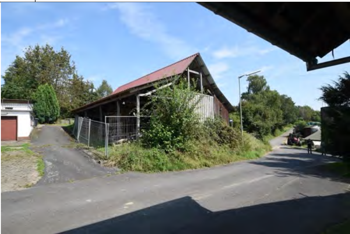
Bild 20 südlicher Giebel des Gebäudes auf Flurstück 135