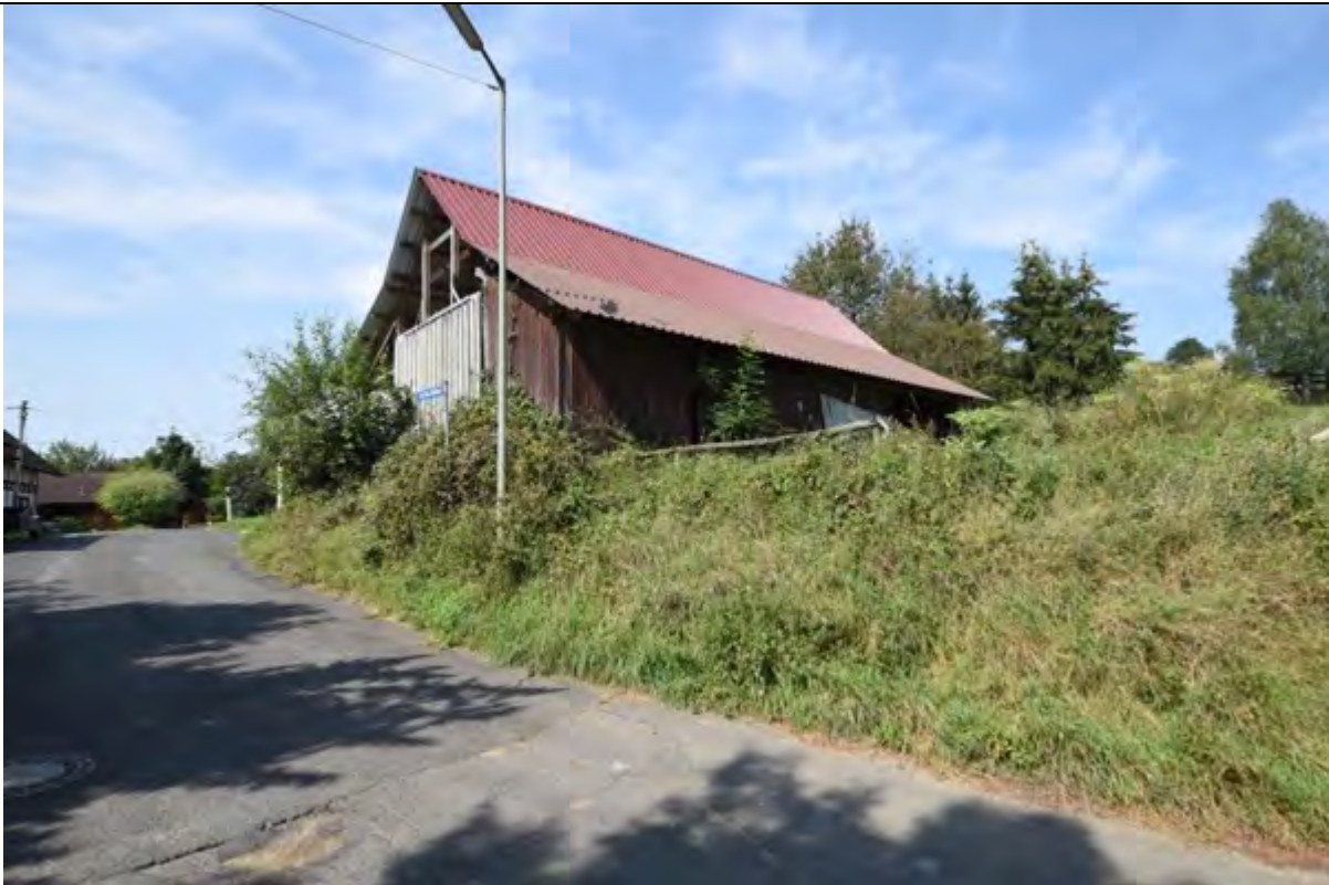
Bild 21 östliche Seite des Gebäudes auf Flurstück 135