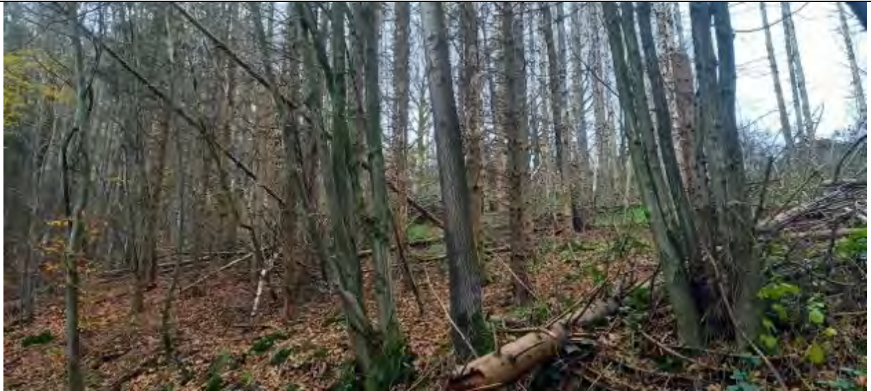
Abb.10 Fl.St. 7-177 Kalamitätsfläche (teilweise nicht geräumt)