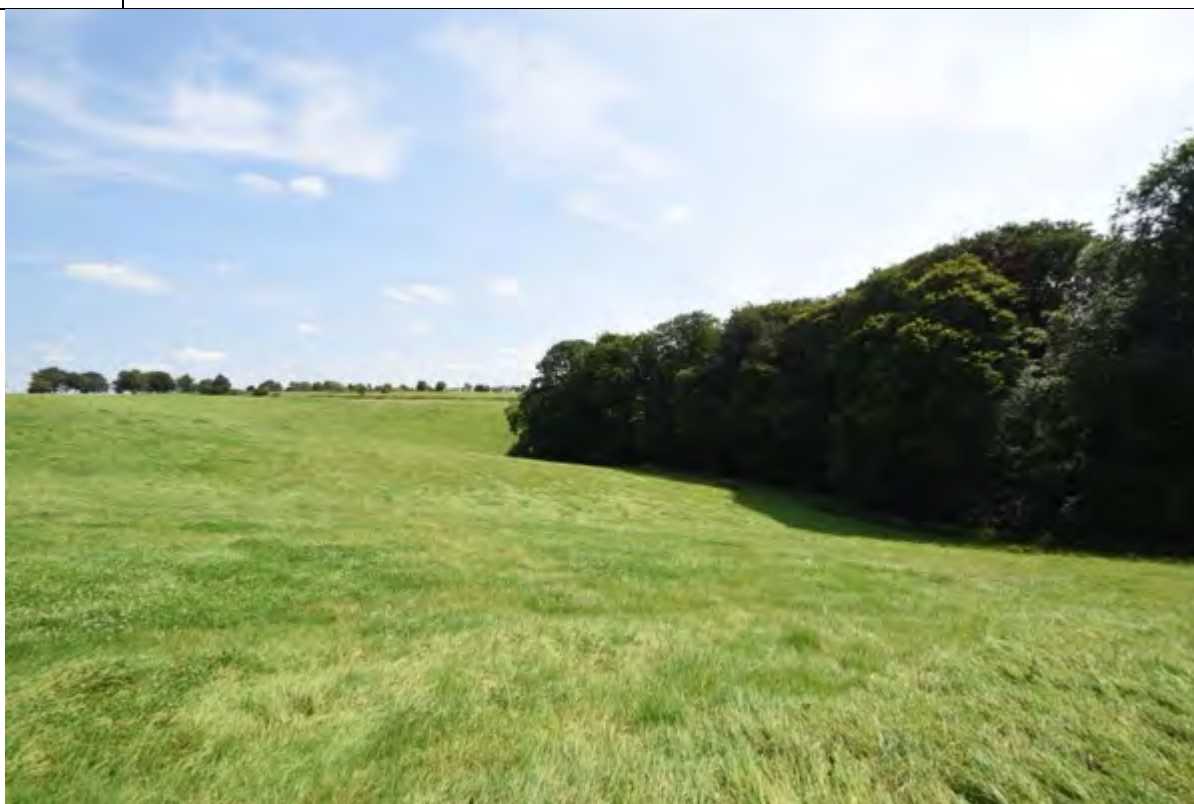
Bild 34 Blick entlang des Waldrandes über das Grünland des Flurstücks 177