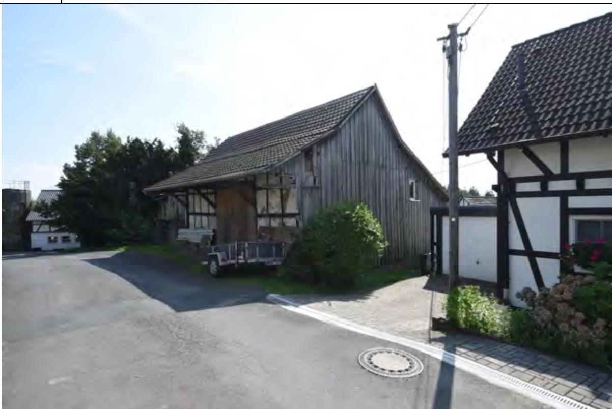
Bild 18 westlicher Giebel des Gebäudes auf Flurstück 140 und Straßenfront entlang der Straße „Zu den Birken“