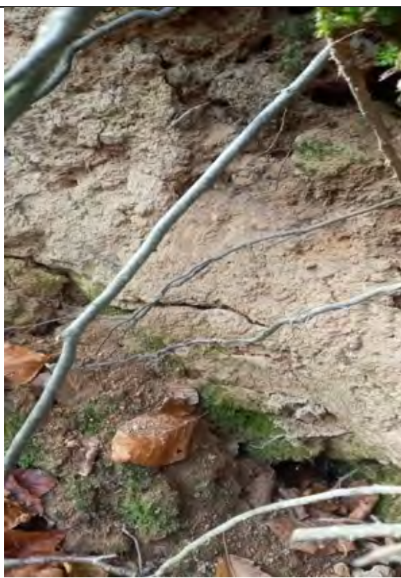
Abb.20 Waldboden grusig-schluffiger Lehm mit hohem Skelettanteil