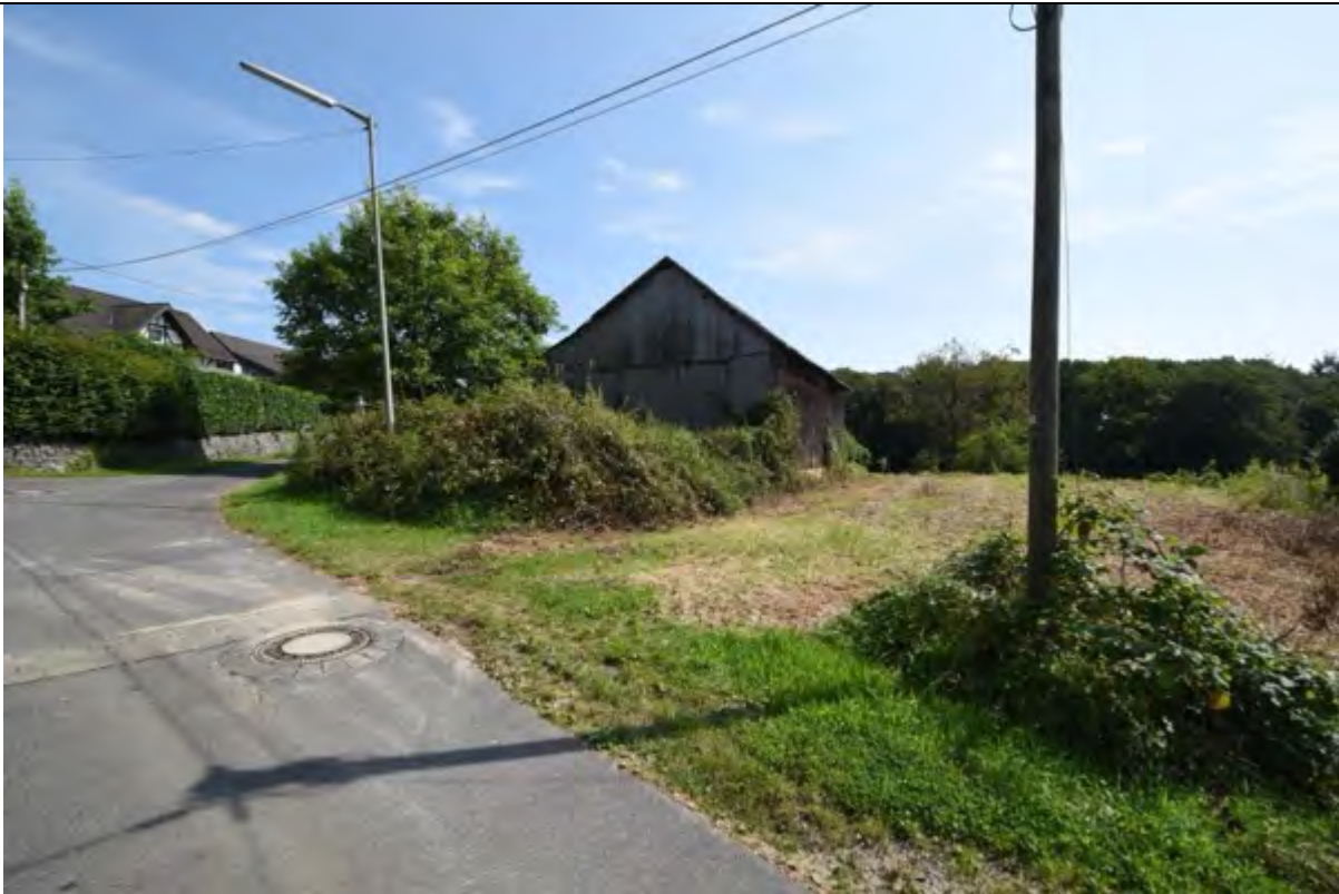
Bild 13 westlicher Giebel des Scheunengebäudes auf Flurstück 147 mit Grünlandstreifen zur Straße „Zu den Birken“