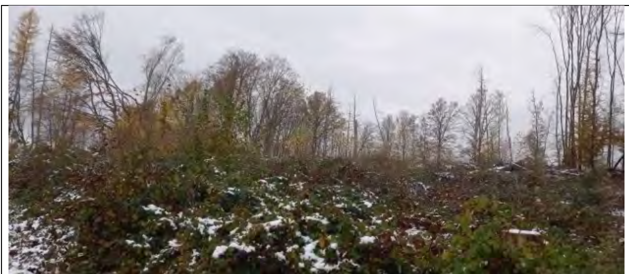
Abb.3 Fl.St. 7-5 Kalamitätsfläche (stark verwildert mit invasiver Brombeere, stellenweise Birken, Fichten-Anflug ungesichert)