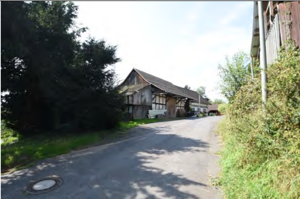
Bild 19 Blick von Flurstück 229 auf das Flurstück 140 mit dem Lagergebäude