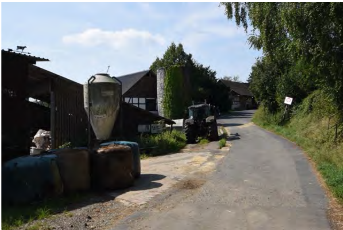
Bild 23 Blick entlang des Wirtschaftsweges Flurstück 183 entlang des Grundstücks 229 mit den Wirtschaftsgebäuden und Futtersilos