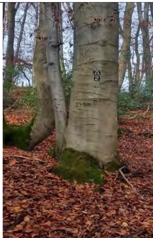
Abb.18 Fl. St. 7-177 Erholungswald (Wanderweg)