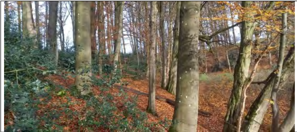
Abb.4 Fl.St. 7-177 Laub-Altholz Blick in Richtung NO