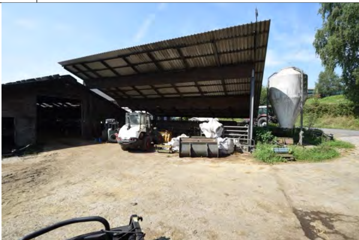
Bild 26 Offenstall in Verlängerung des neuen Kuhstalls