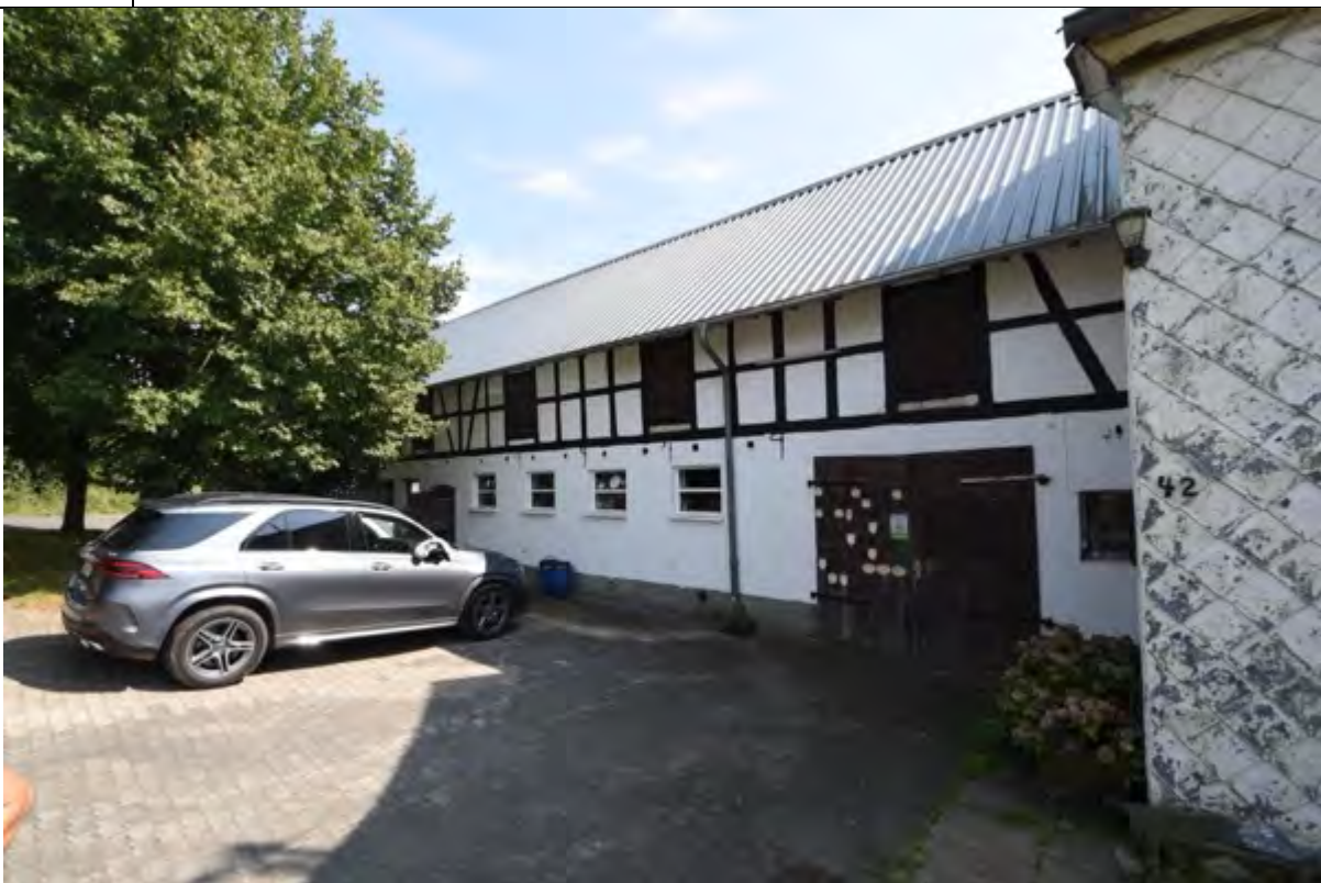
Bild 22 ehemaliger Kuhstall, angebaut an das Wohnhaus Nr. 42 auf Flurstück 228