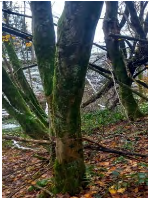
Abb.16 FI.St. 9-113 Minderwertige Bestockung Blick vom Wirtschaftsweg in Richtung S