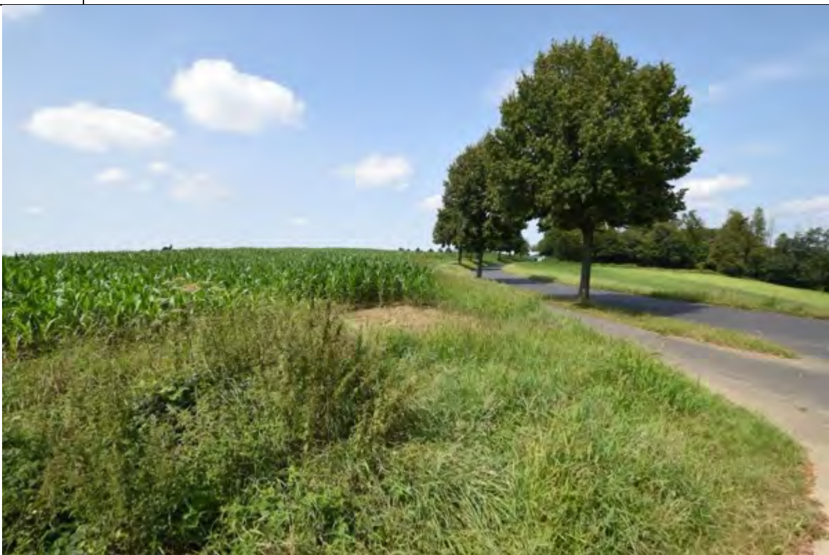
Bild 38 Blick entlang der Schöneschofer Straße über das Flurstück 346 mit Maisanbau und rechts im Bild Flurstück 307