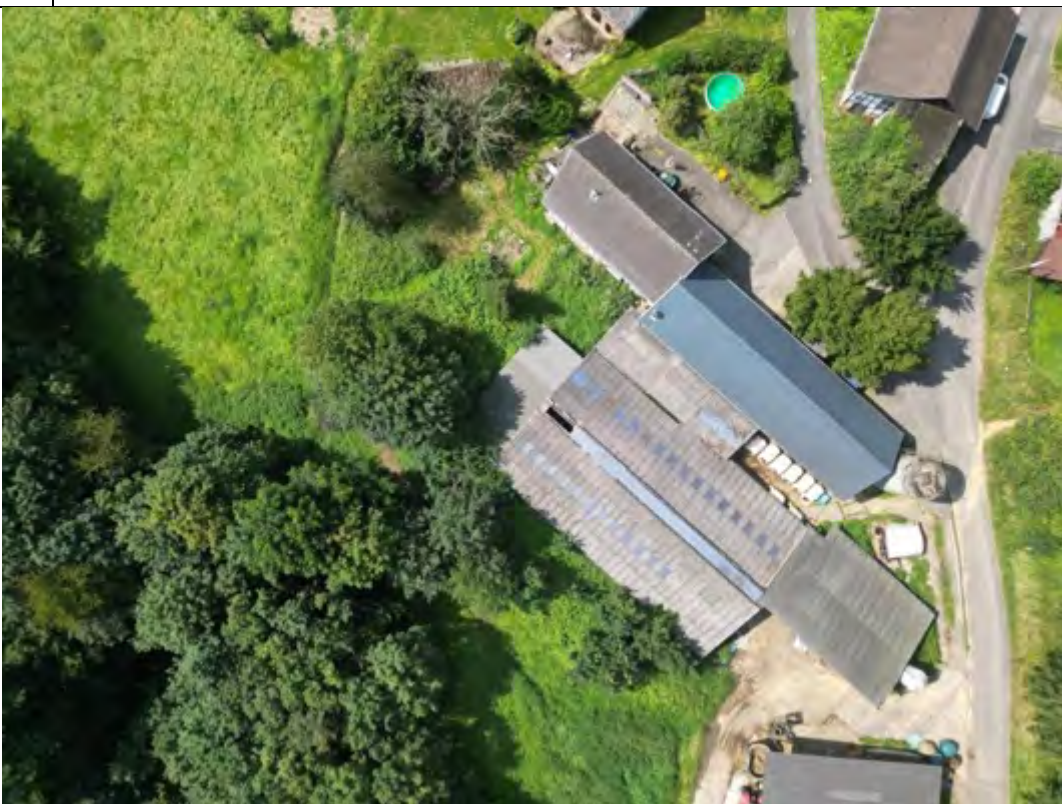
Bild 4 am rechten oberen Bildrand Gebäude auf Flurstück 140 sowie Wohnhaus auf Flurstück 228 mit angebautem alten Kuhstall, Verbindungsgebäude und neuem Kuhstall