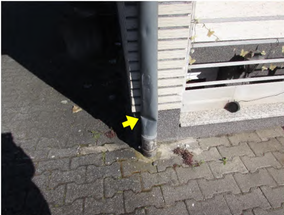
Foto 3: Mehrfamilienhaus: verbeultes Fallrohr der Dachentwässerung