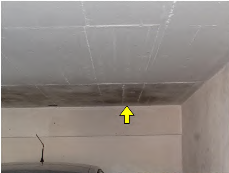
Foto 12: PKW-Garage: Feuchtigkeitsflecken an der Untersicht der Decke