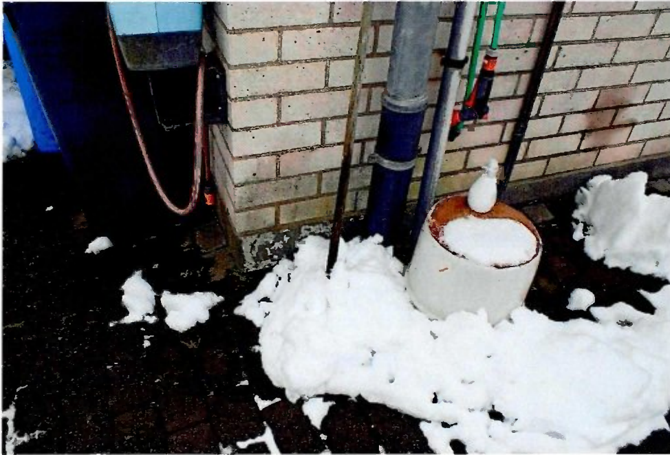
Bild 73 Beispiel für Feuchteschäden Sockel EG frontseitig