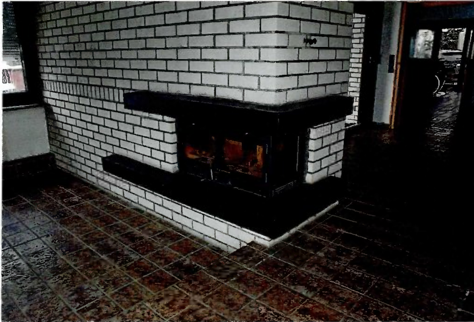
Bild 81 Nicht mehr betriebsbereiter, da nicht gewarteter Innenkamin