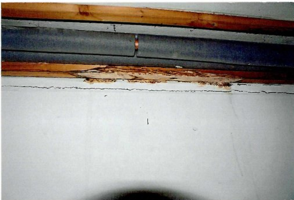
Bild 76 Risse und Feuchteschäden im Vorraum des KG