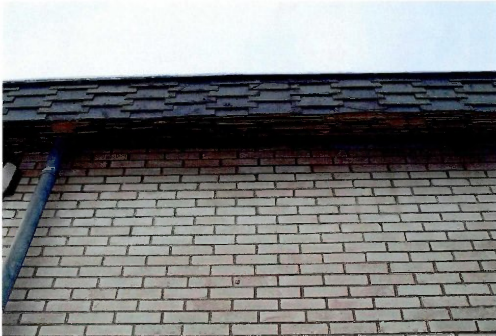
Bild 67 Beispiel für Witterungsschäden am Holzwerk des Daches