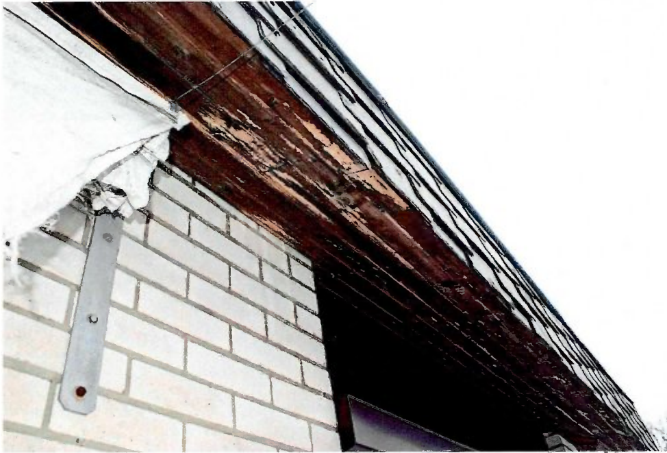
Bild 69 Starke Nässeschäden der Holzverkleidung