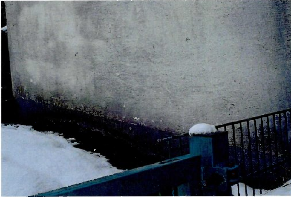
Bild 71 Feuchteschäden an der Wand neben dem Gartenzugang