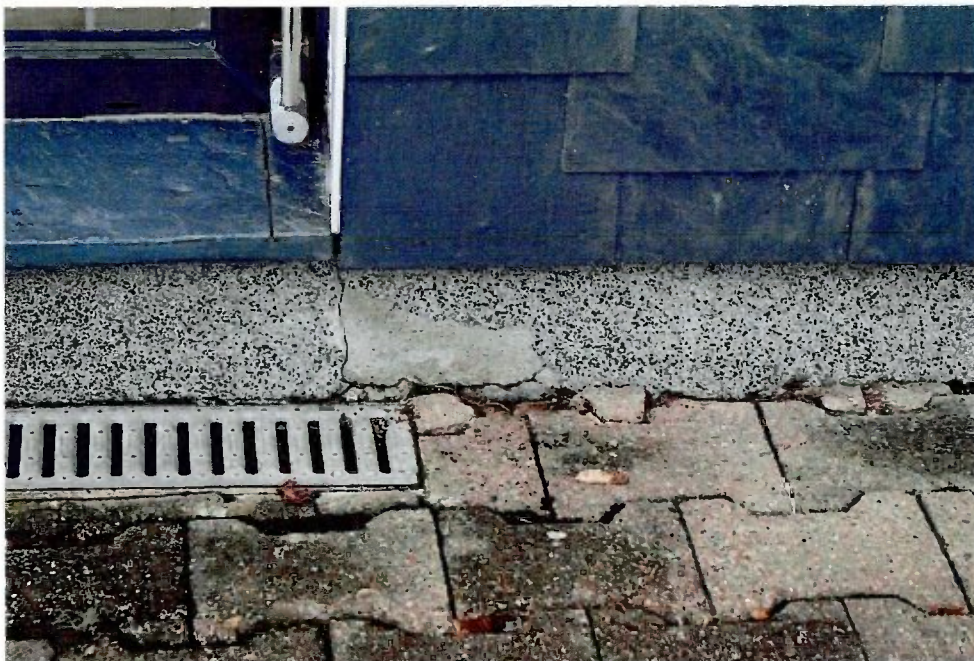
Bild 70 Schäden am Sockel im Bereich des Ladeneingangs UG