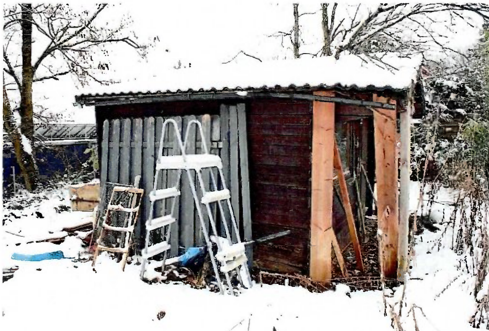
Bild 82 Schäden am Gartenhaus zur WE 1