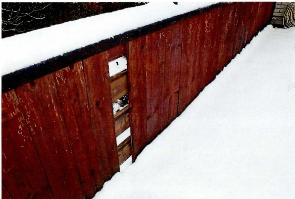
Bild 74 Beispiel für Schäden an der Terrassenverkleidung