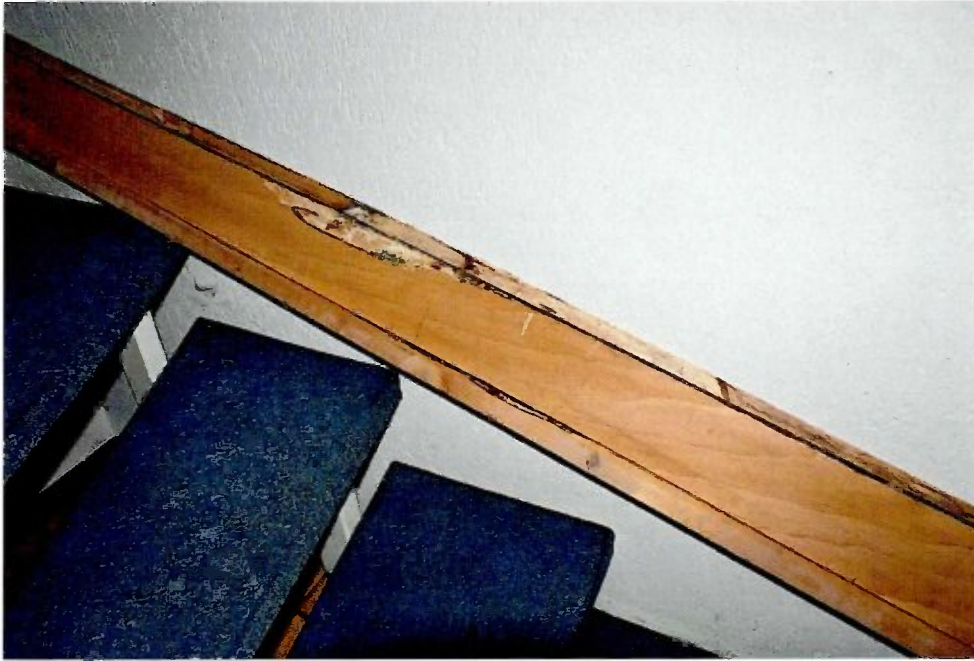
Bild 77 Feuchteschaden Bereich Kellerinntreppe