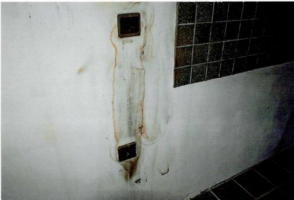
Bild 78 Wasserschaden in der Küche auf der Schrankseite