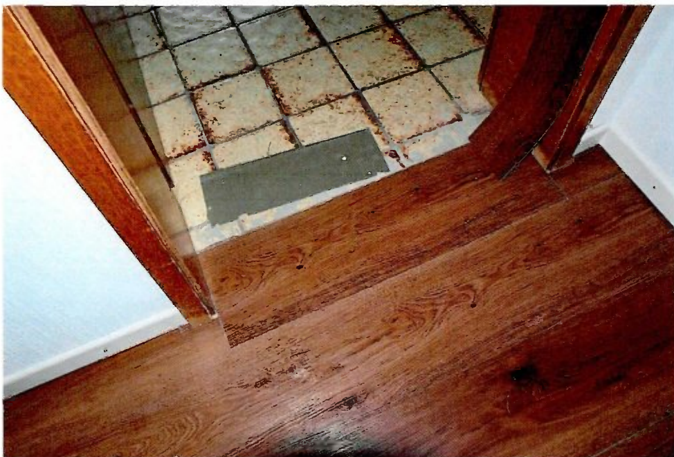
Bild 80 Mangelhafter Übergang Fliesen zu Parkett