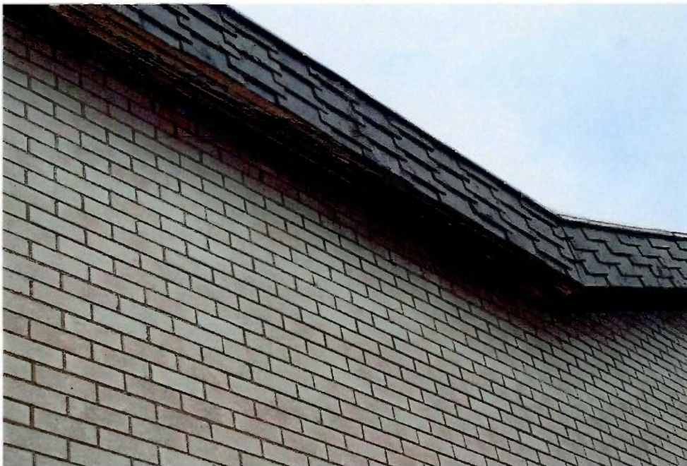
Bild 68 Weiter Schäden Holzwerk und an der Gesimsverkleidung