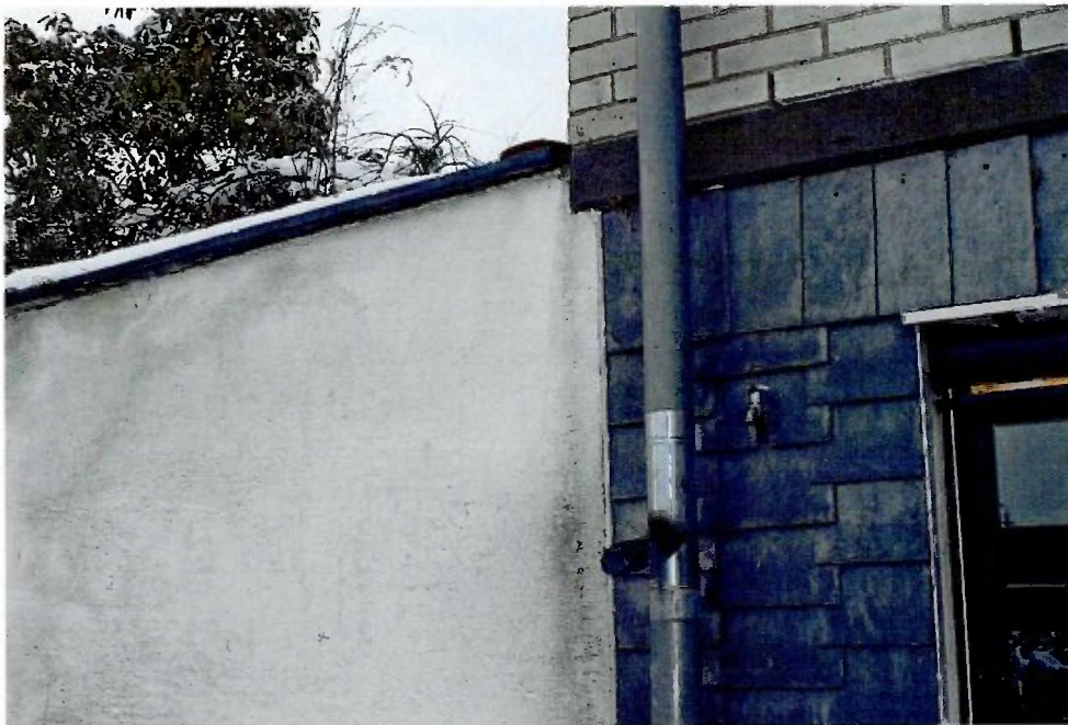
Bild 72 Weitere Nässeschäden neben dem Laden