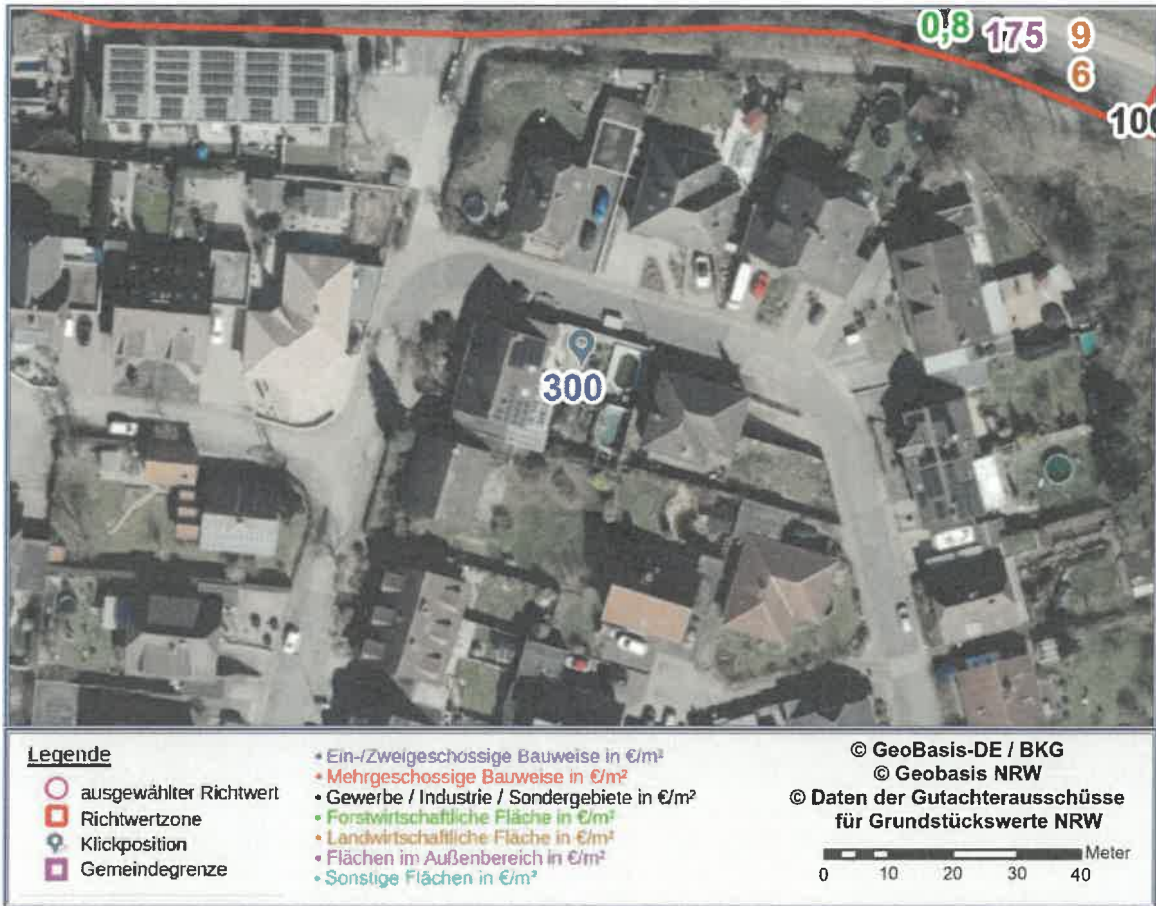
Abbildung 2: Detailkarte gemäß gewählter Ansicht