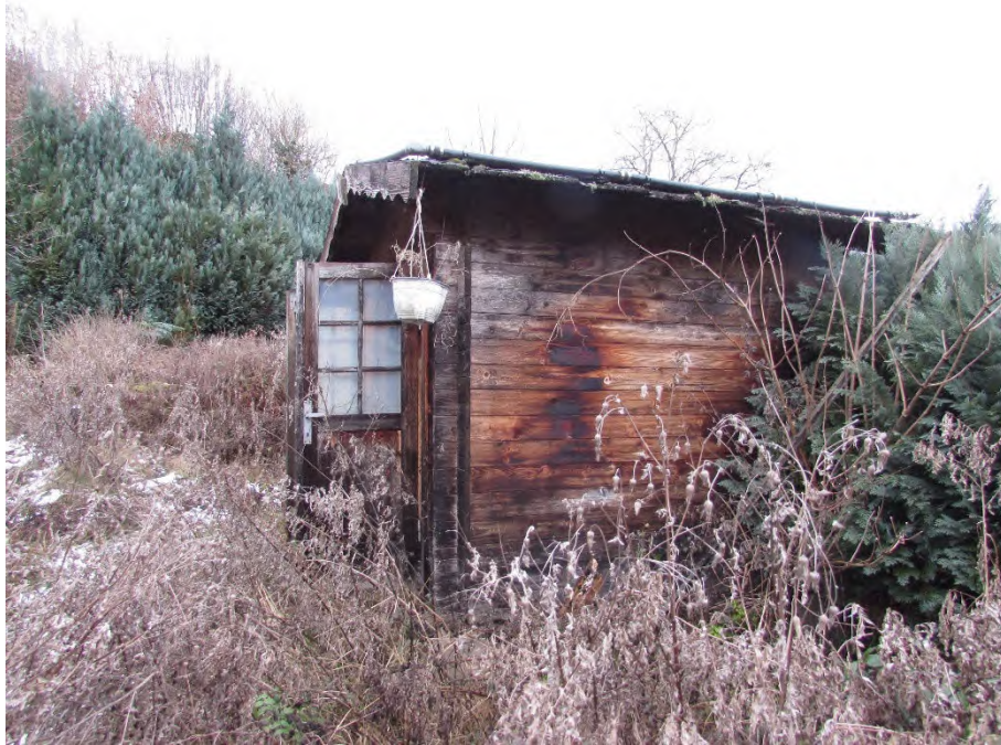
Foto 17: rückwärtiger Grundstücksbereich, Außenanlagen: verwittertes Holzgartenhaus, verwilderte Eingrünung