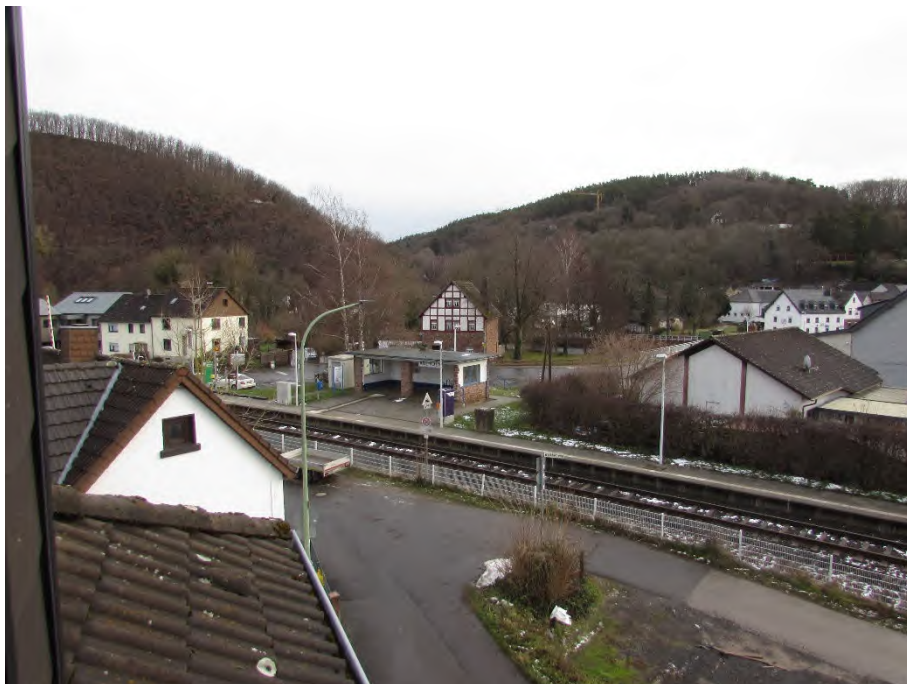
Foto 8: Dachgeschoss Altbau, Ausblick von der Dachterrasse: nahegelegene Bahnstrecke mit Bahnhof