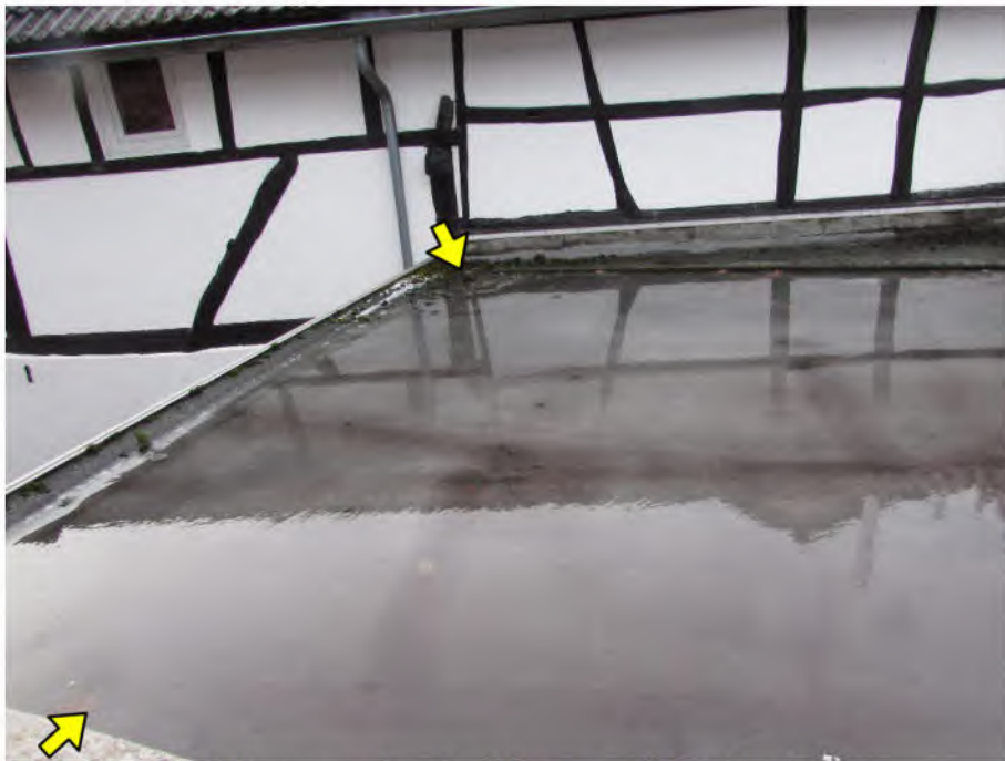
Foto 10: PKW-Garage: stehendes Wasser auf dem Dach, überprüfungsbedürftiger Ablauf