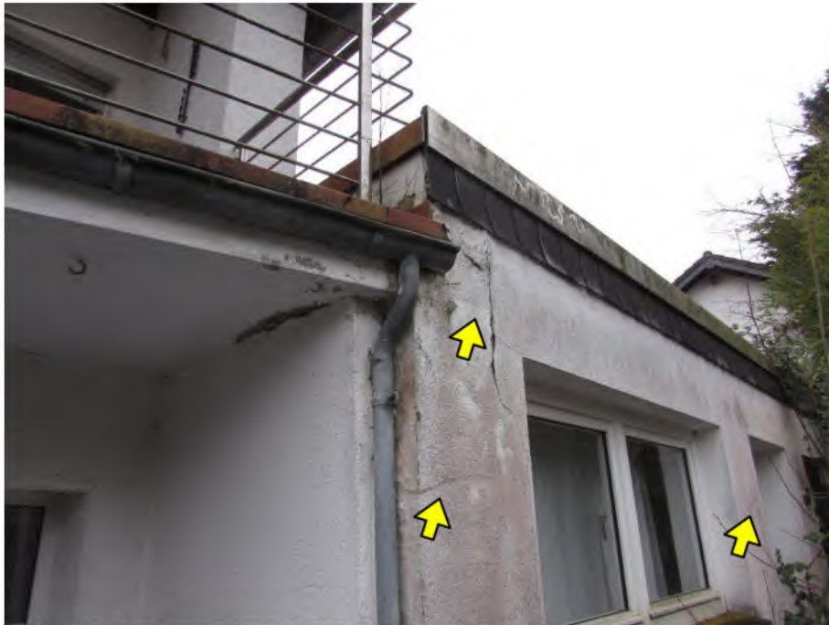
Foto 11: PKW-Garage, rückwärtige Ansicht: fleckige Fassade, Putzschäden