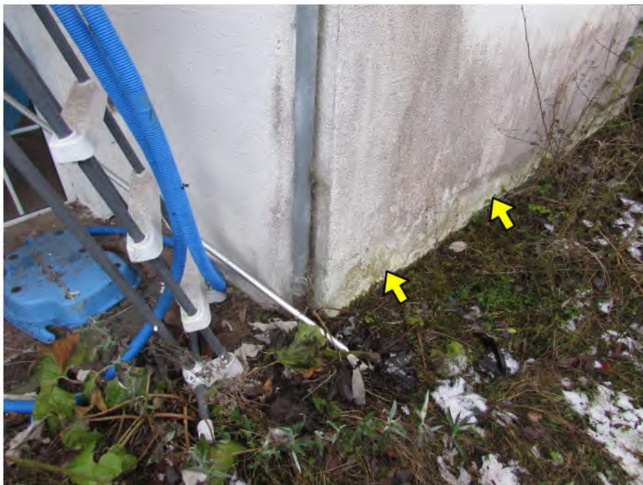
Foto 12: PKW-Garage, rückwärtige Ansicht: Feuchtigkeit im Fassadenbereich