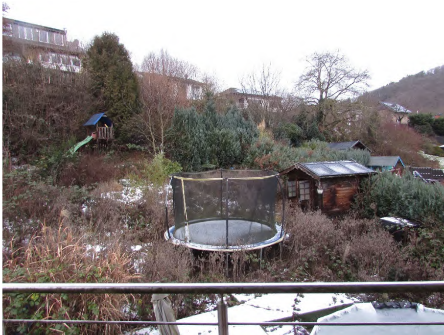
Foto 7: Erdgeschoss Anbau (Whg 1), Ausblick von Dachterrasse/Balkon auf den rückwärtigen Grundstücksbereich