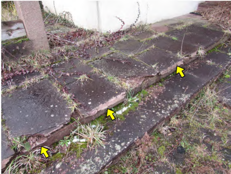
Foto 15: Außenanlagen: beschädigte Sandsteinplatten der Zugangsbefestigung