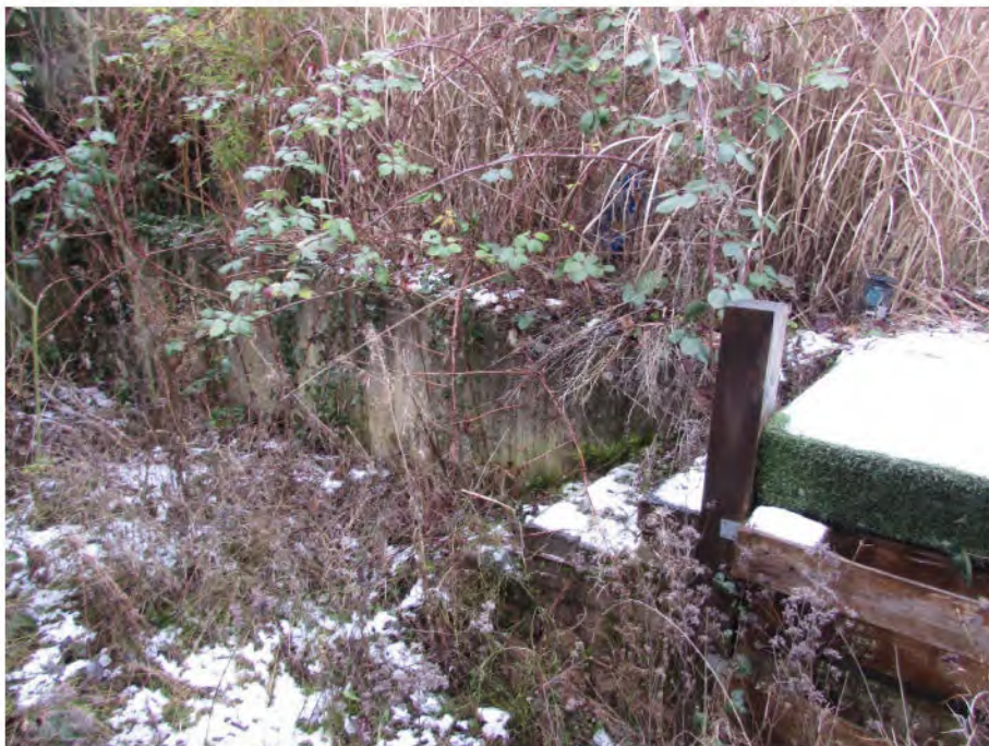
Foto 16: rückwärtiger Grundstücksbereich, Außenanlagen: massiver Sockel im Terrassenbereich, verwilderte Eingrünung