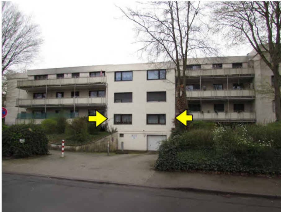
Foto 3: Mehrfamilienhaus "Im Wohnpark 10", zu bewertende Wohnung Nr. 85, Ansicht von der Straße "In der Freiheit"