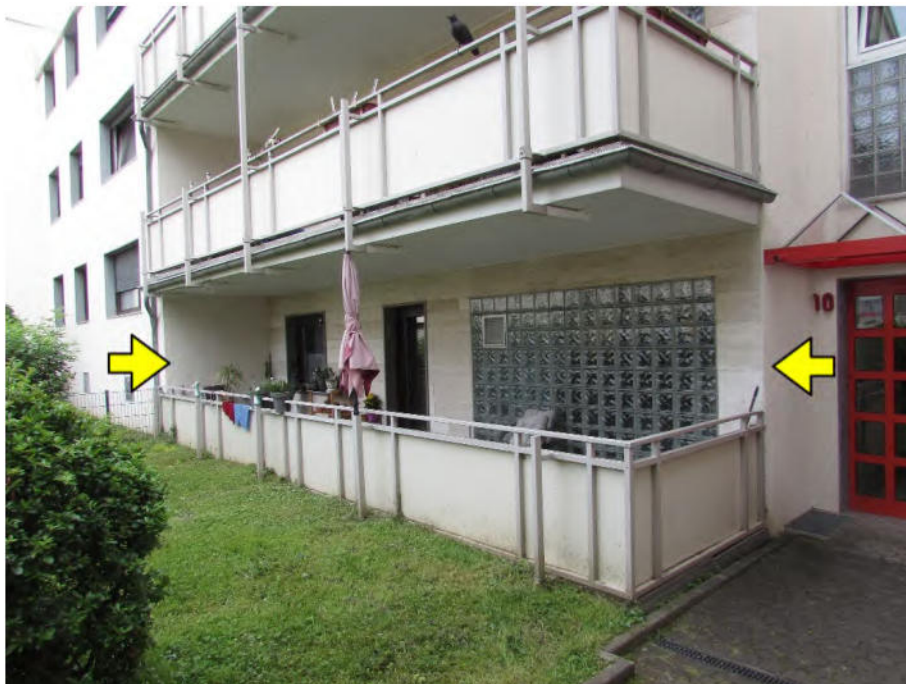
Foto 2: Mehrfamilienhaus "Im Wohnpark 10", zu bewertende Wohnung Nr. 85, Terrasse