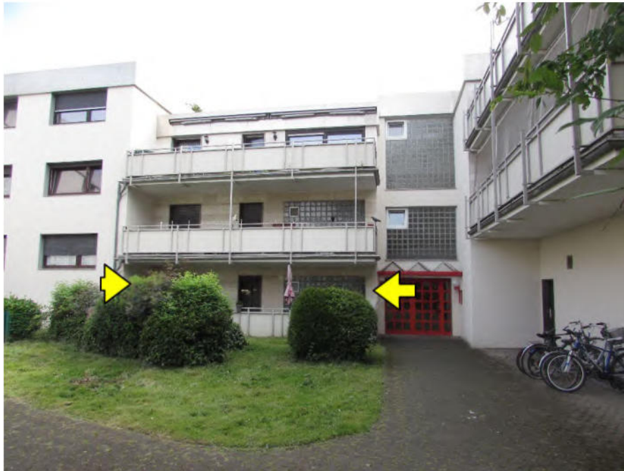
Foto 1: Mehrfamilienhaus "Im Wohnpark 10", 50127 Bergheim-Ahe, zu bewertende Wohnung Nr. 85