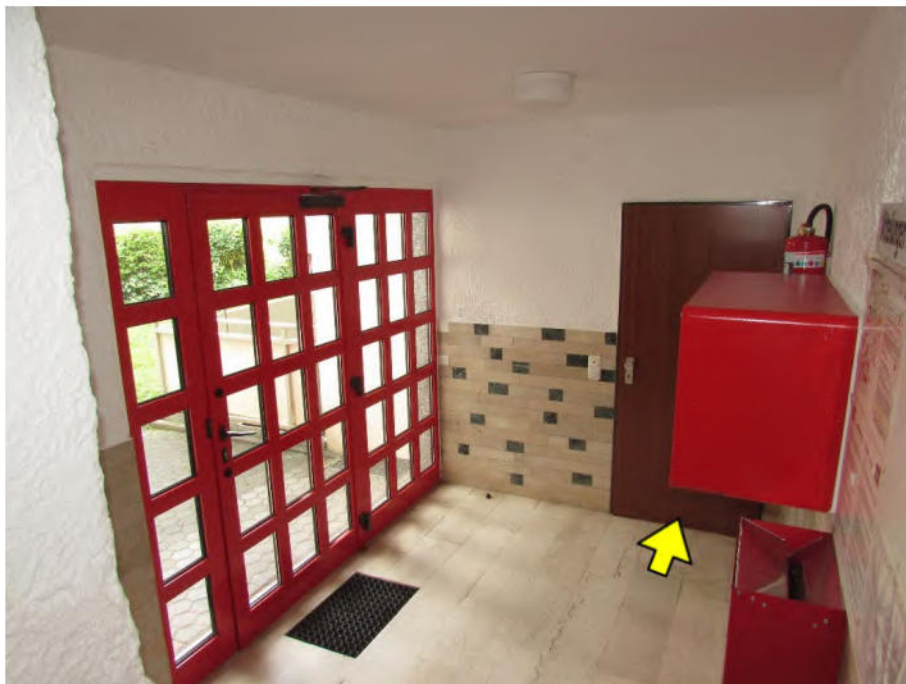
Foto 6: Hauseingangsflur, Zugang zu der zu bewertenden Wohnung Nr. 85