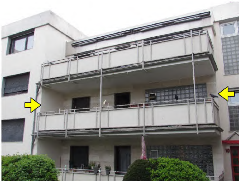
Foto 2: Mehrfamilienhaus "Im Wohnpark 10", zu bewertende Wohnung Nr. 88