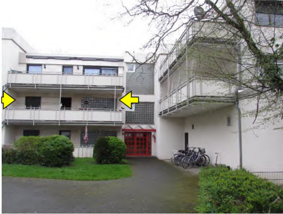
Foto 1: Mehrfamilienhaus "Im Wohnpark 10", 50127 Bergheim-Ahe, zu bewertende Wohnung Nr. 88