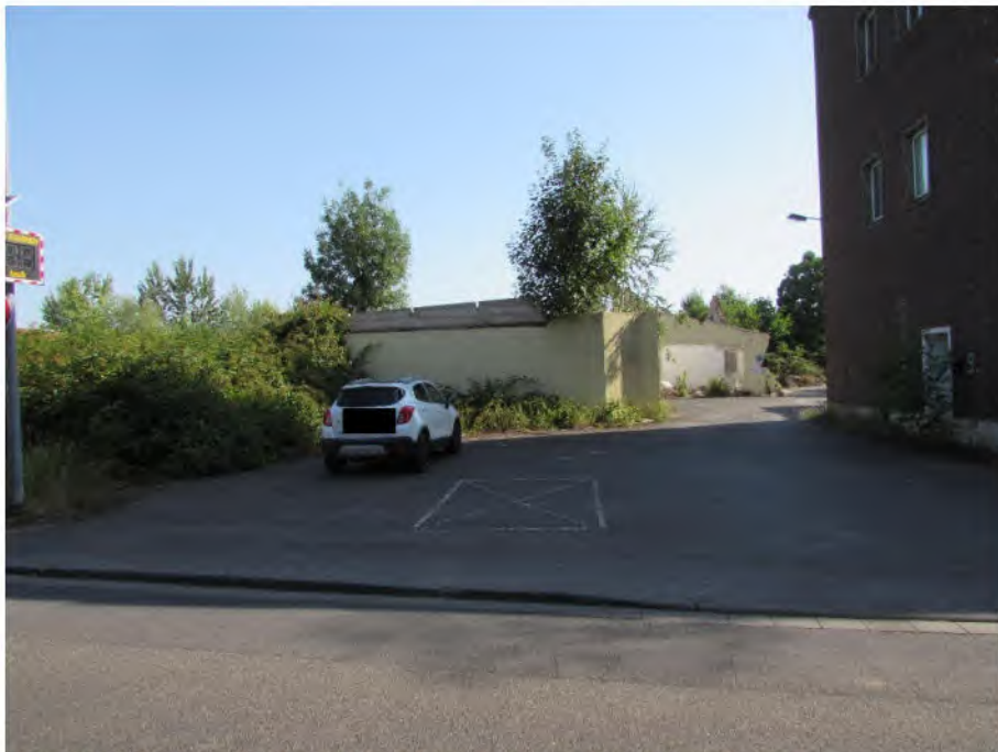
Foto 16: südwestlicher Grundstücksbereich, abbruchreifes Nebengebäude 2, Hoffläche/Feuerwehzufahrt