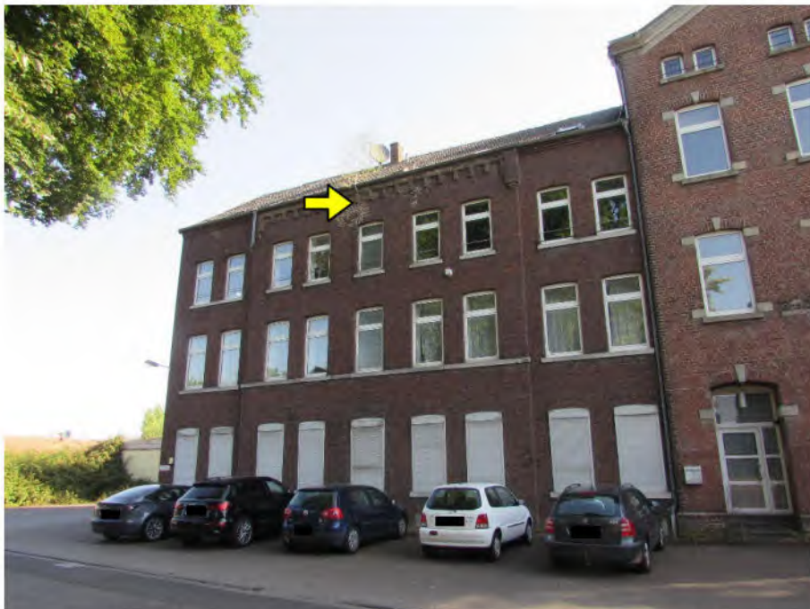
Foto 4: ehem. Klostergebäude, Süd-Ansicht: Stockausschlag im Fassadenfugenbereich