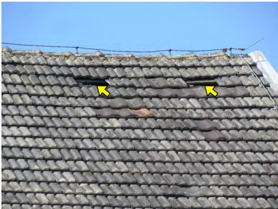
Foto 8: ehem. Klostergebäude: überalterte Dacheindeckung, tlw. fehlende Ziegel