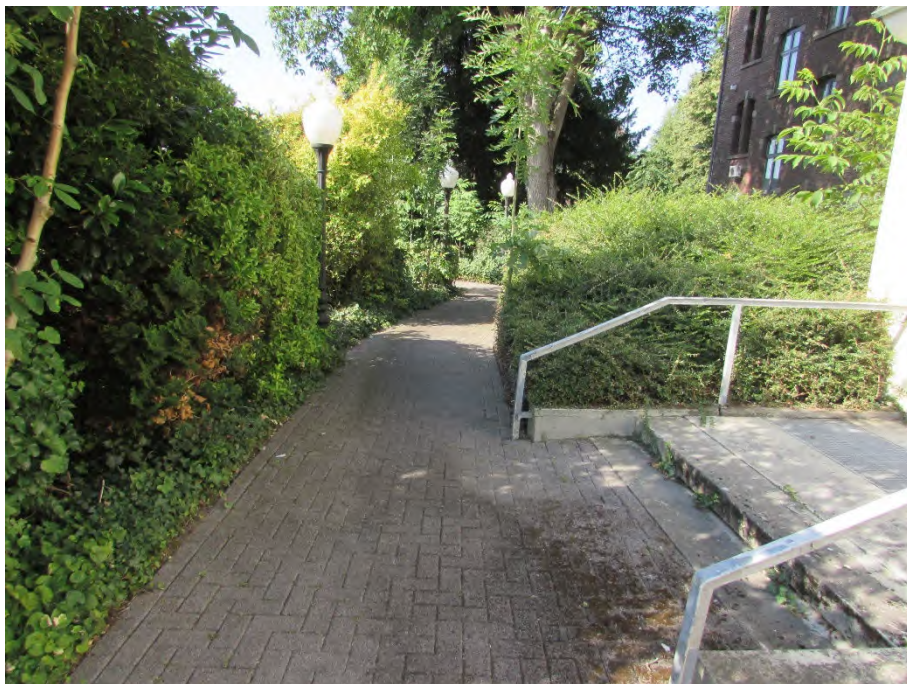
Foto 18: östlicher Grundstücksbereich, Weg zur Lagerhalle (ehem. Kapelle)