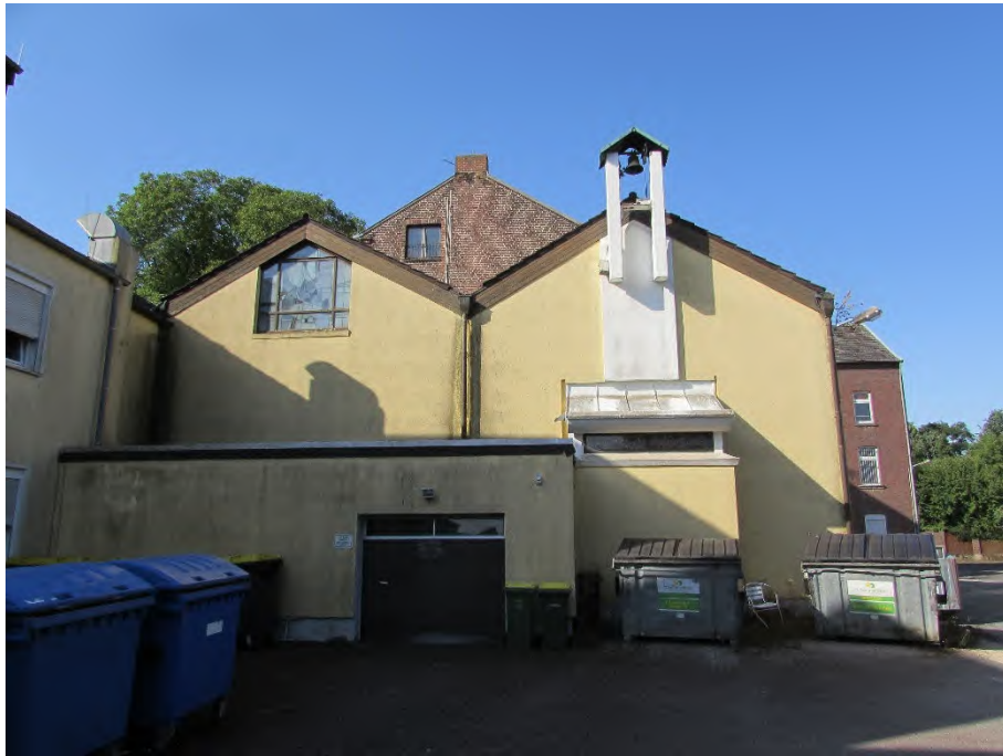
Foto 13: vorne: Nebengebäude 1, dahinter: Lagergebäude (ehem. Kapelle), Nord-Ansicht