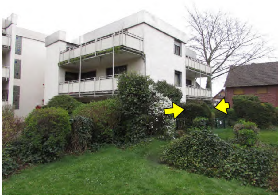
Foto 3: Mehrfamilienhaus "Im Wohnpark 6", Wohnung Nr. 34, Süd-Ansicht