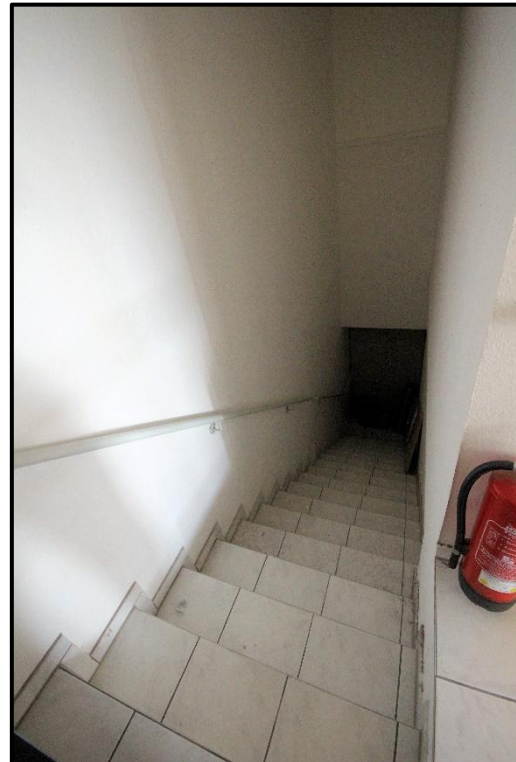
Bild 14: Treppe zum Teileigentum Nr. 31 a) V im EG (ehem. orthopädische Praxis)