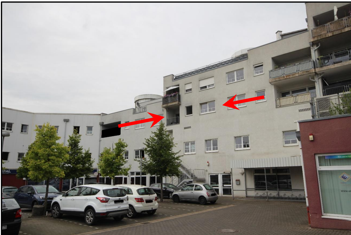
Bild 6: Ansicht von Südosten mit Kennzeichnung des Wohnungseigentums Nr. 5