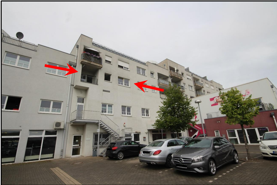
Bild 5: Ansicht von Süden mit Kennzeichnung des Wohnungseigentums Nr. 5