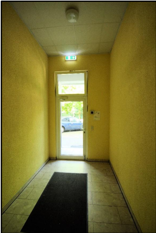
Bild 7: Eingangsbereich des Treppenhauses im Erdgeschoss an der Nordseite