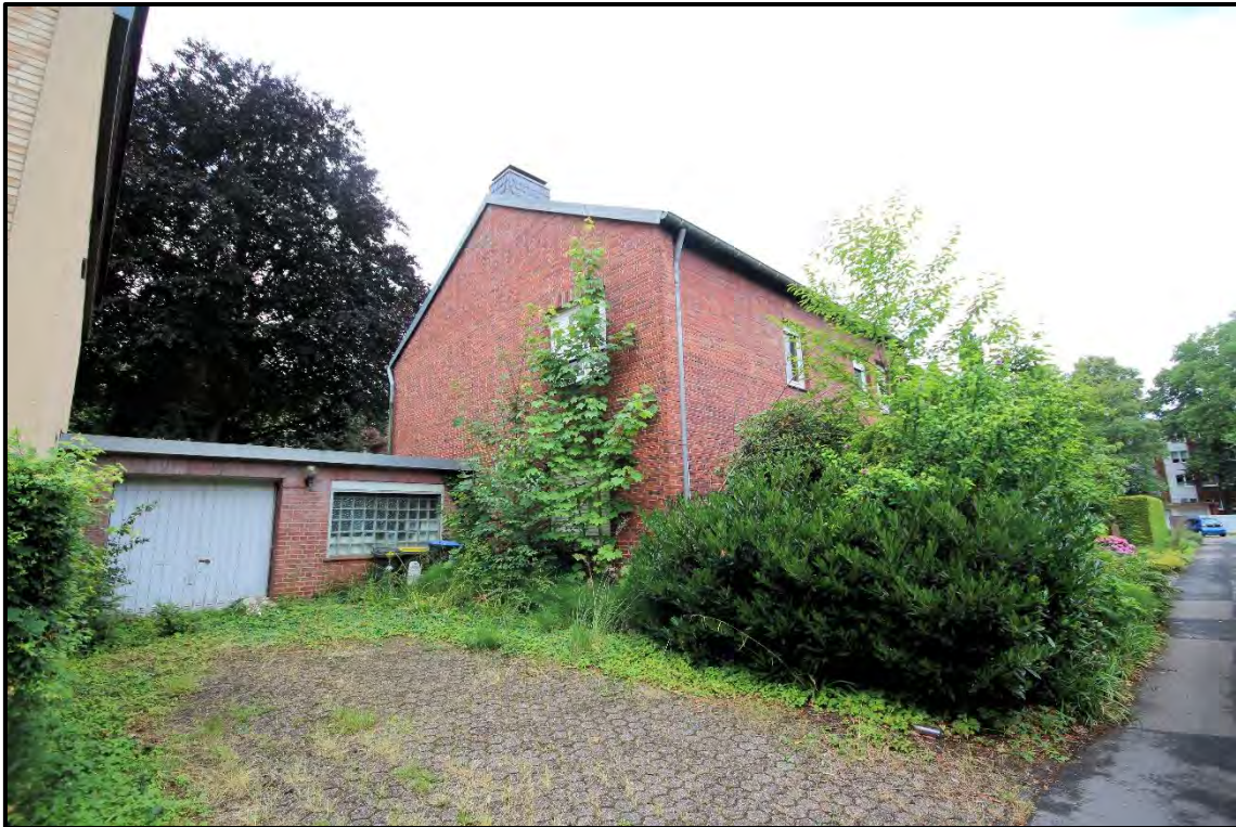
Bild 9: Ansicht von Osten (Bild vom 09.07.2025)