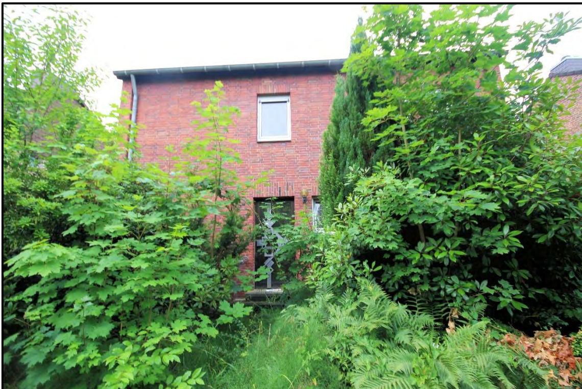
Bild 4: Ansicht von Nordosten (Bild vom 09.07.2025)