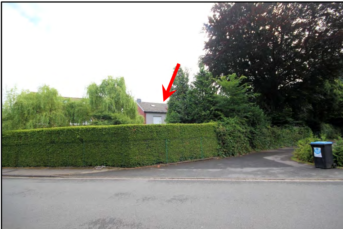
Bild 12: Ansicht von Südwesten (Bild vom 09.07.2025)