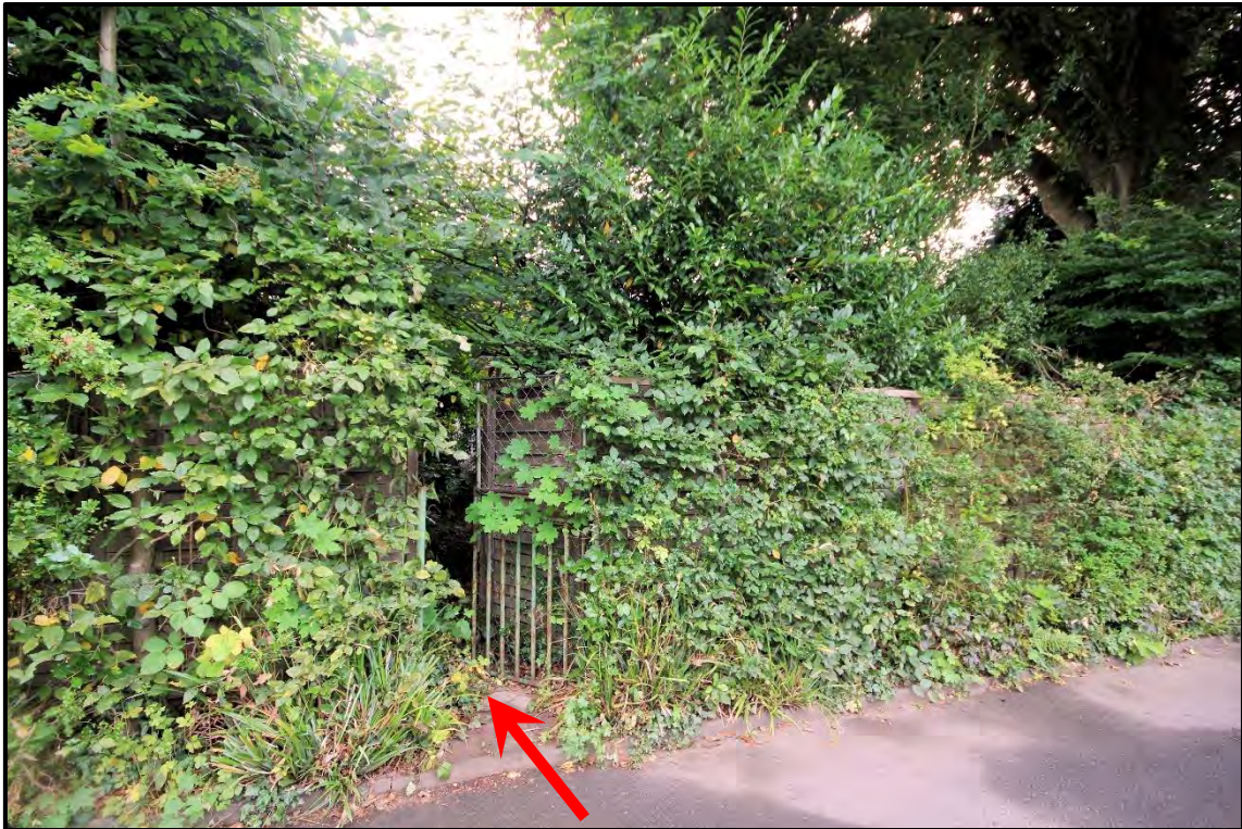
Bild 13: gartenseitiger Eingang an der Südseite (Bild vom 09.07.2025)