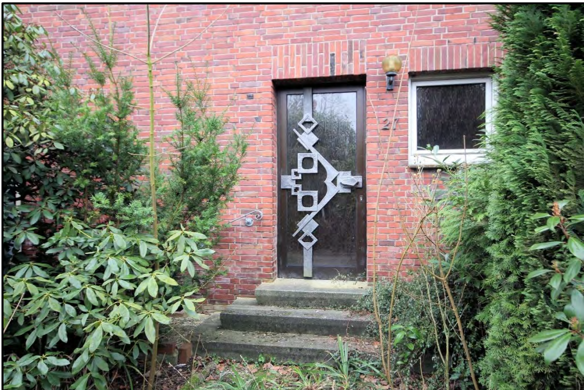
Bild 6: Hauseingang Nonnenbusch 27 Ansicht von Nordosten (Bild vom 11.03.2025)