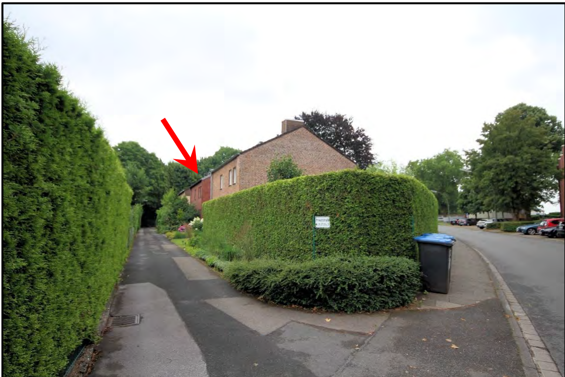
Bild 2: Abzweig des Nonnenbuschs mit den Häusern 25, 27, 29 und 31 (Bild vom 09.07.2025)