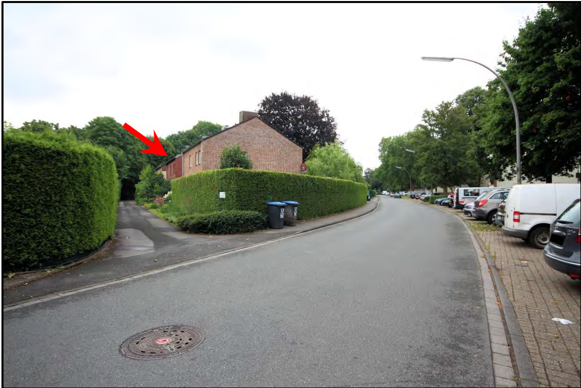
Bild 1: Blick in den Nonnenbusch, Richtung nach Südosten (Bild vom 09.07.2025)