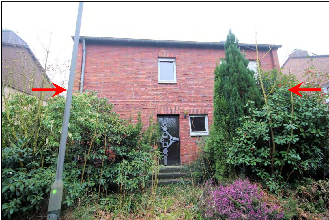
Bild 5: Ansicht von Nordosten (Bild vom 11.03.2025)