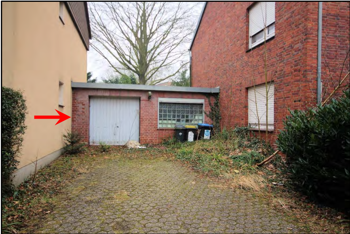
Bild 7: zugehöriges Nebengebäude (Bild vom 11.03.2025)