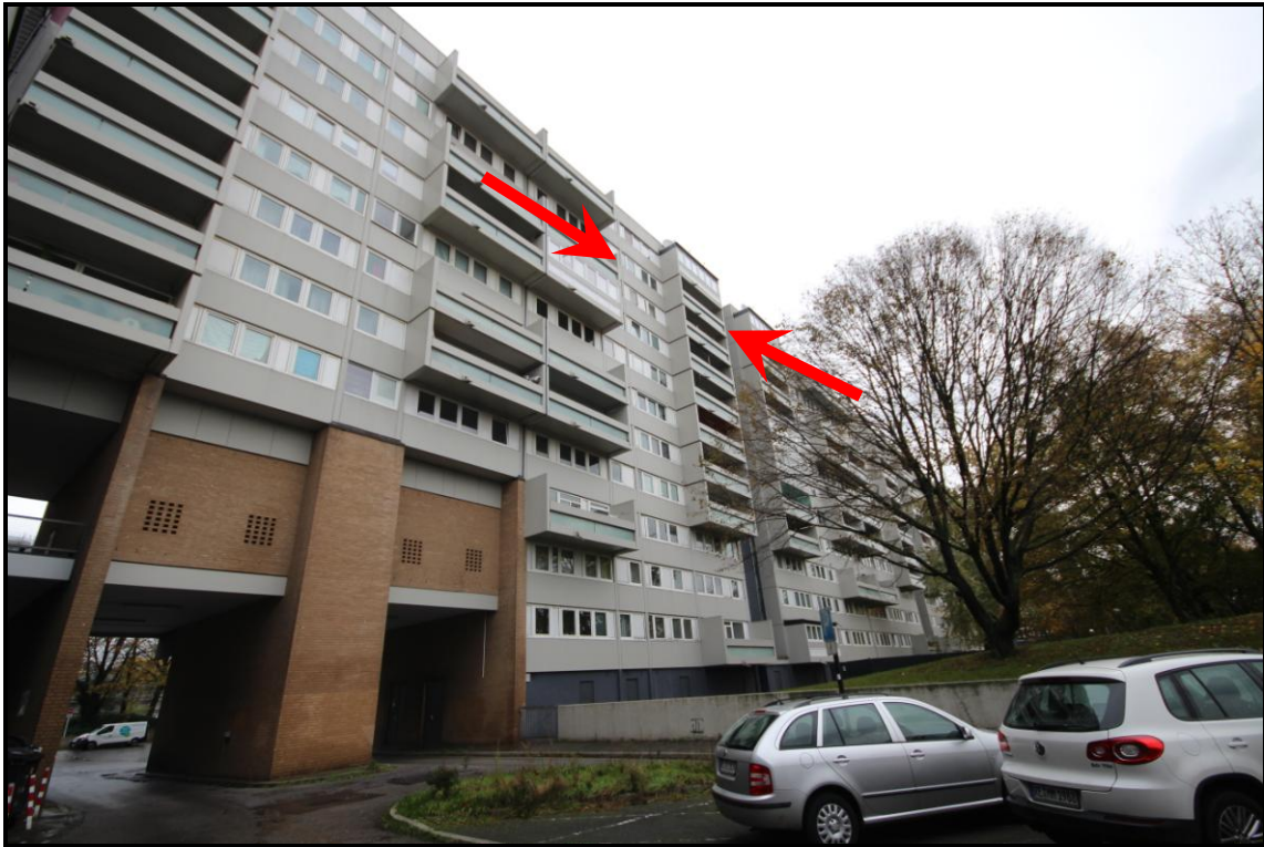
Bild 5: Kennzeichnung des Wohnungseigentums W 314 im 10. OG des Hauses Adolf-Grimme-Straße 12