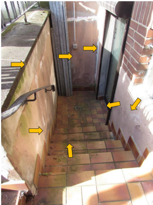
Foto 10: Wohnhaus, Kelleraußentreppe, Feuchtigkeit im Boden- und Wandbereich