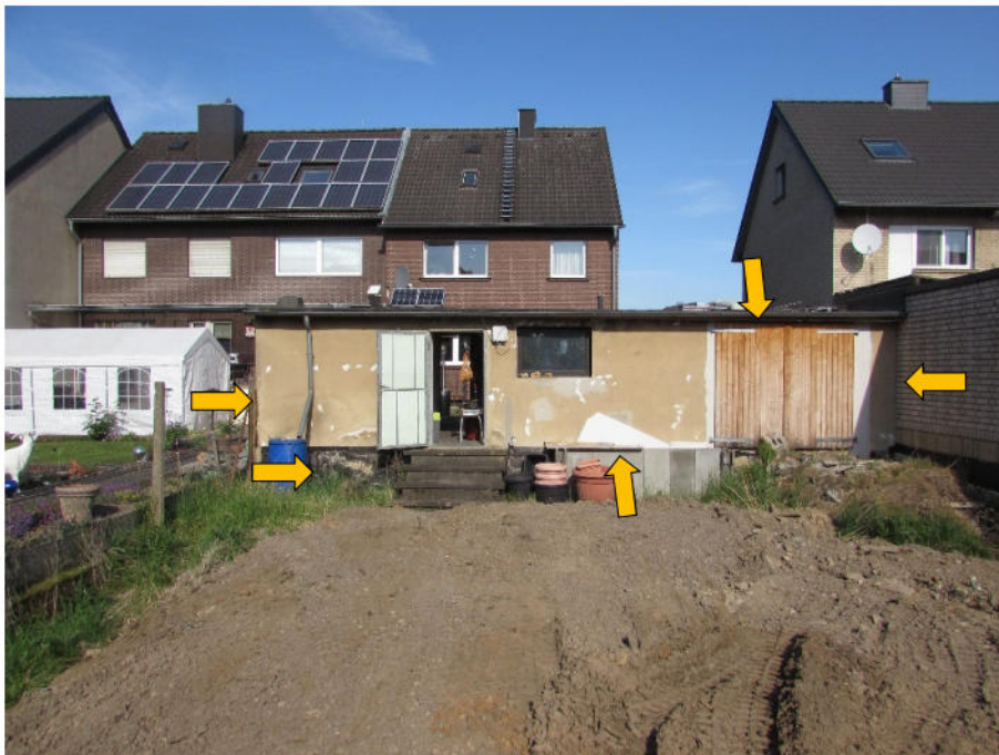
Foto 8: Garagengebäude, Rückansicht, Schäden und Feuchtigkeit an der Fassade, verwittertes Holztor