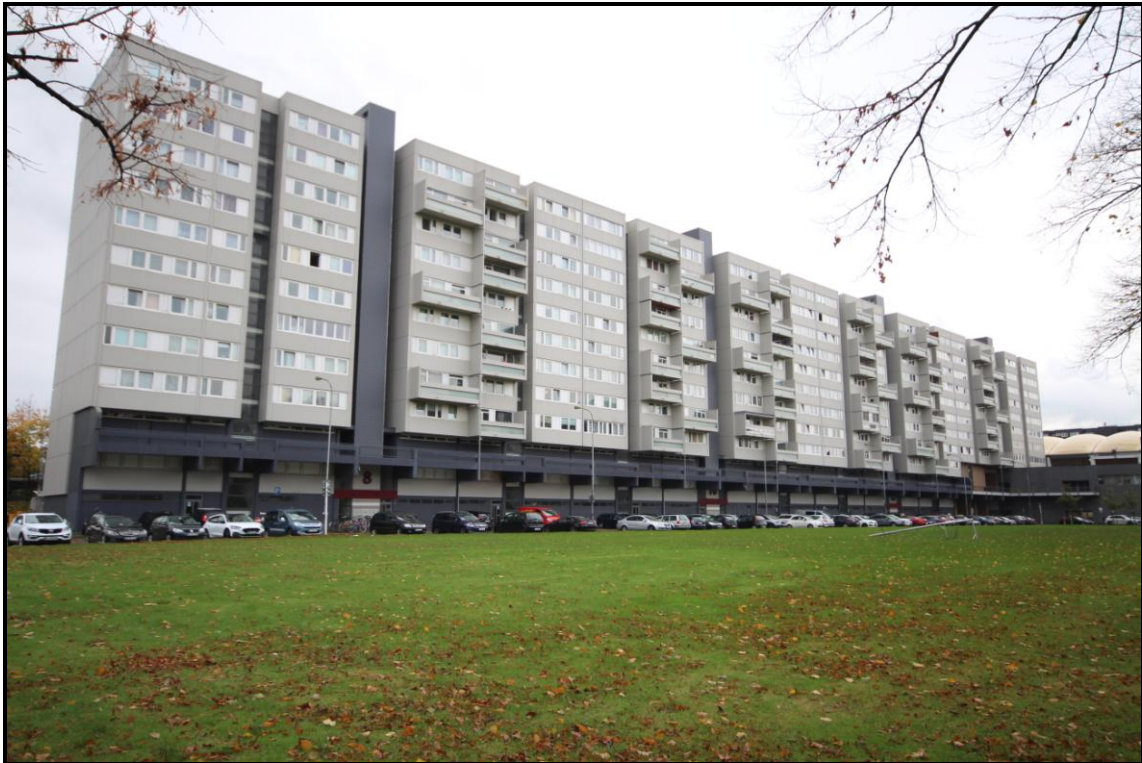
Bild 1: Gesamtansicht Adolf-Grimme-Straße 8, 10, 12, 14 von Nordosten