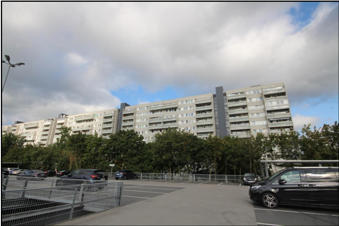
Bild 7: Gesamtansicht Adolf-Grimme-Straße 8, 10, 12, 14 von Südosten