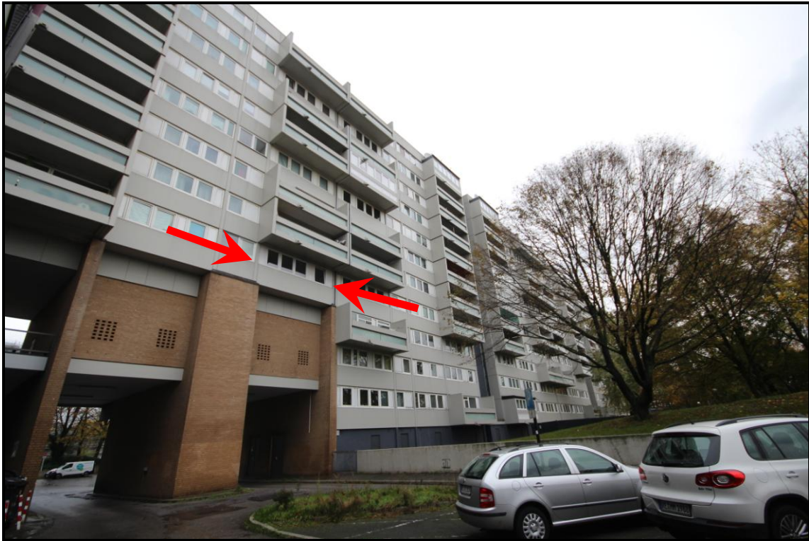
Bild 5: Kennzeichnung des Wohnungseigentums W 208 im 4. OG des Hauses Adolf-Grimme-Straße 14