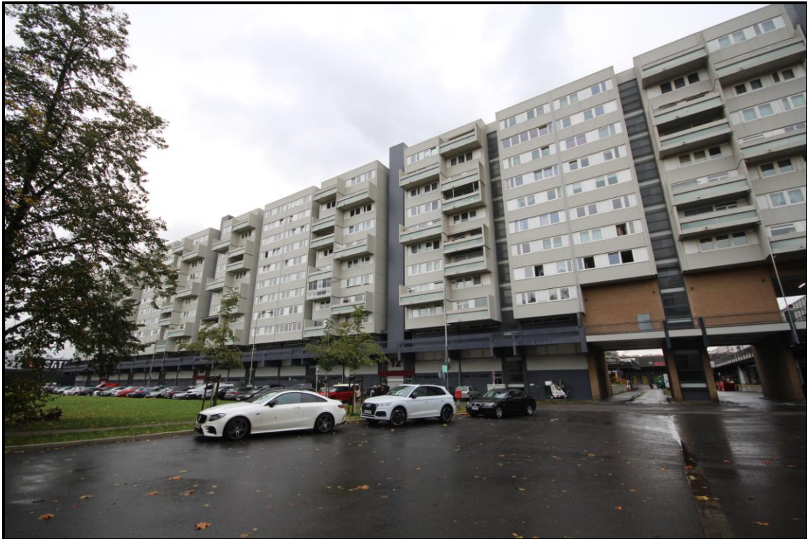
Bild 3: Gesamtansicht Adolf-Grimme-Straße 8, 10, 12, 14 von Nordwesten