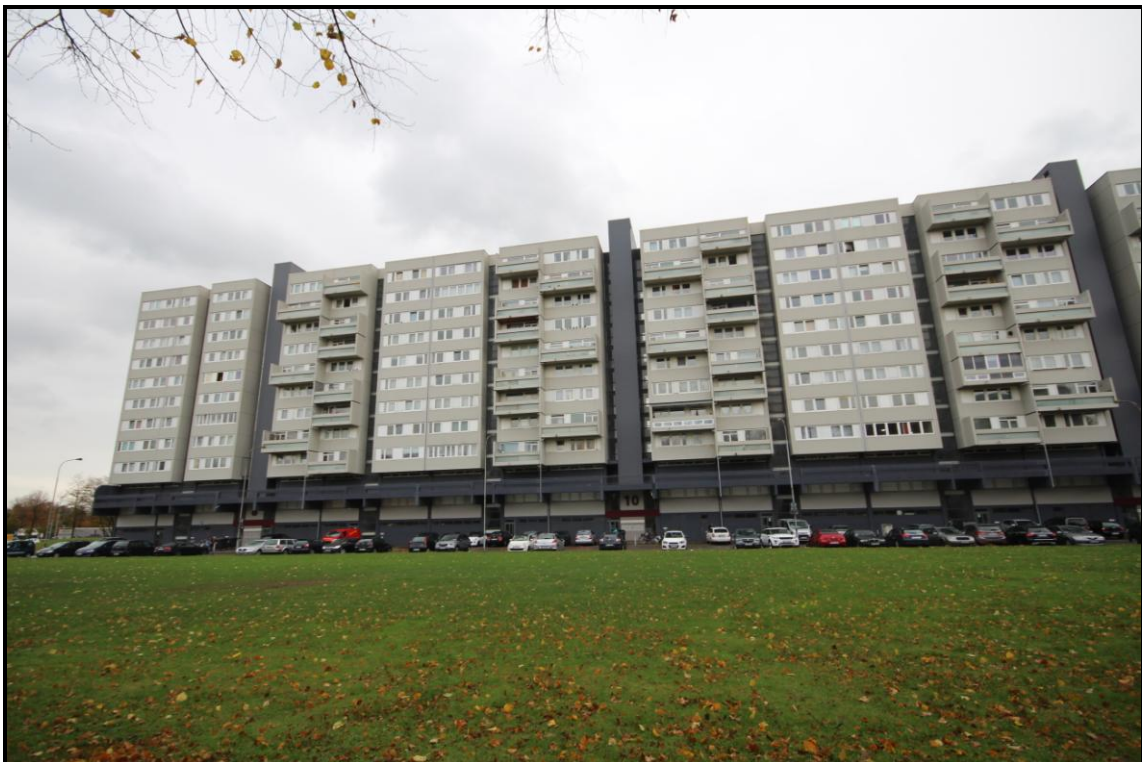
Bild 2: Gesamtansicht Adolf-Grimme-Straße 8, 10, 12, 14 von Norden