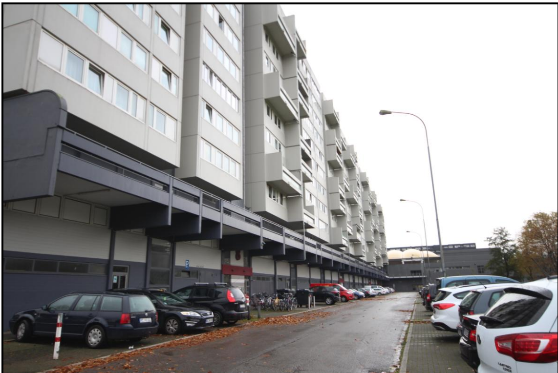
Bild 8: Blick in die eingangsseitige Erschließungsanlage von Osten