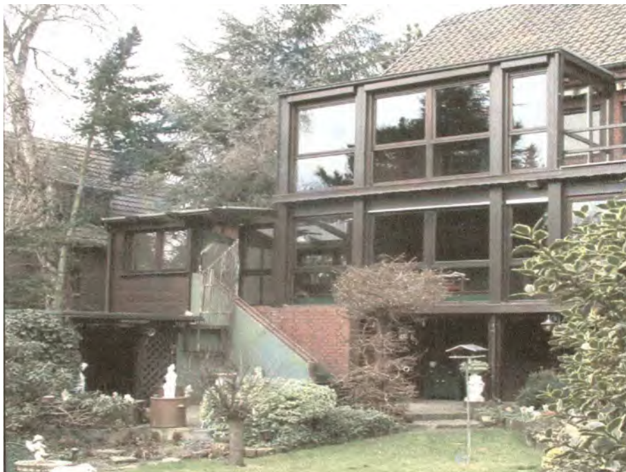
Foto 8: rückwärtige Wohnhaus-Ansicht (aus dem überlassenen Exposé)