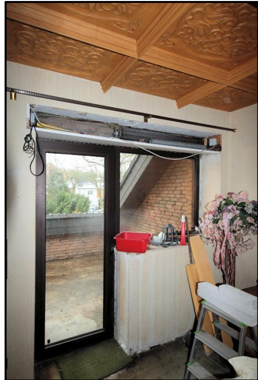
Bild 36: schadhafte Rolllade im gartenseitigen Schlafzimmer zur Dachterrasse