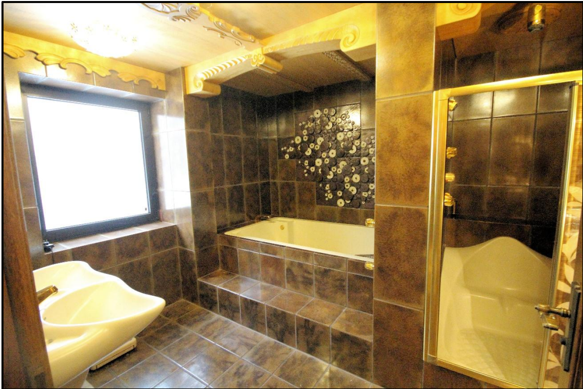
Bild 33: Bad im OG mit geschnitzter individuell gefertigter Deckenvertäfelung und vergoldeten Armaturen