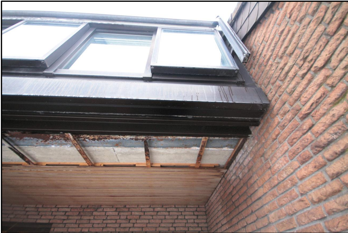
Bild 11: Unterseite des Wintergartens mit schadhafter Deckenkonstruktion