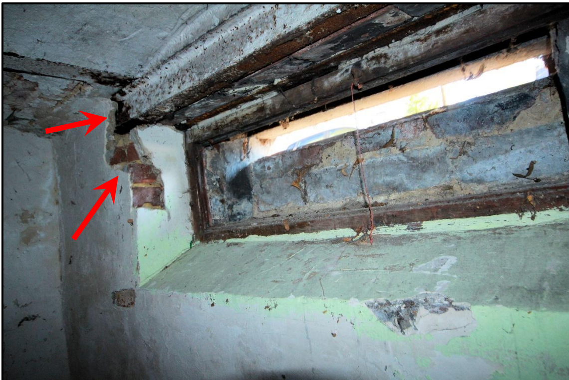
Bild 22: herausgebrochener Stahlträger über einem straßenseitigen Kellerfenster