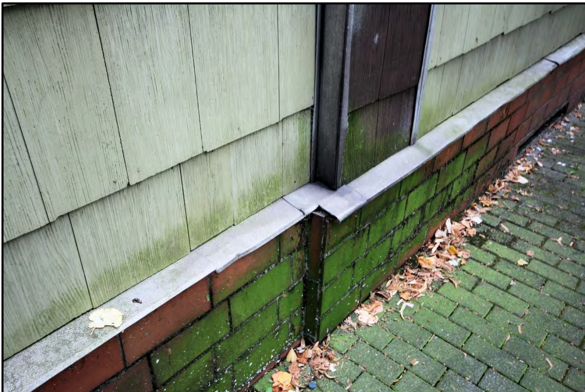
Bild 8: Sockelausführung mit Riemchen und Kunstschieferverkleidung