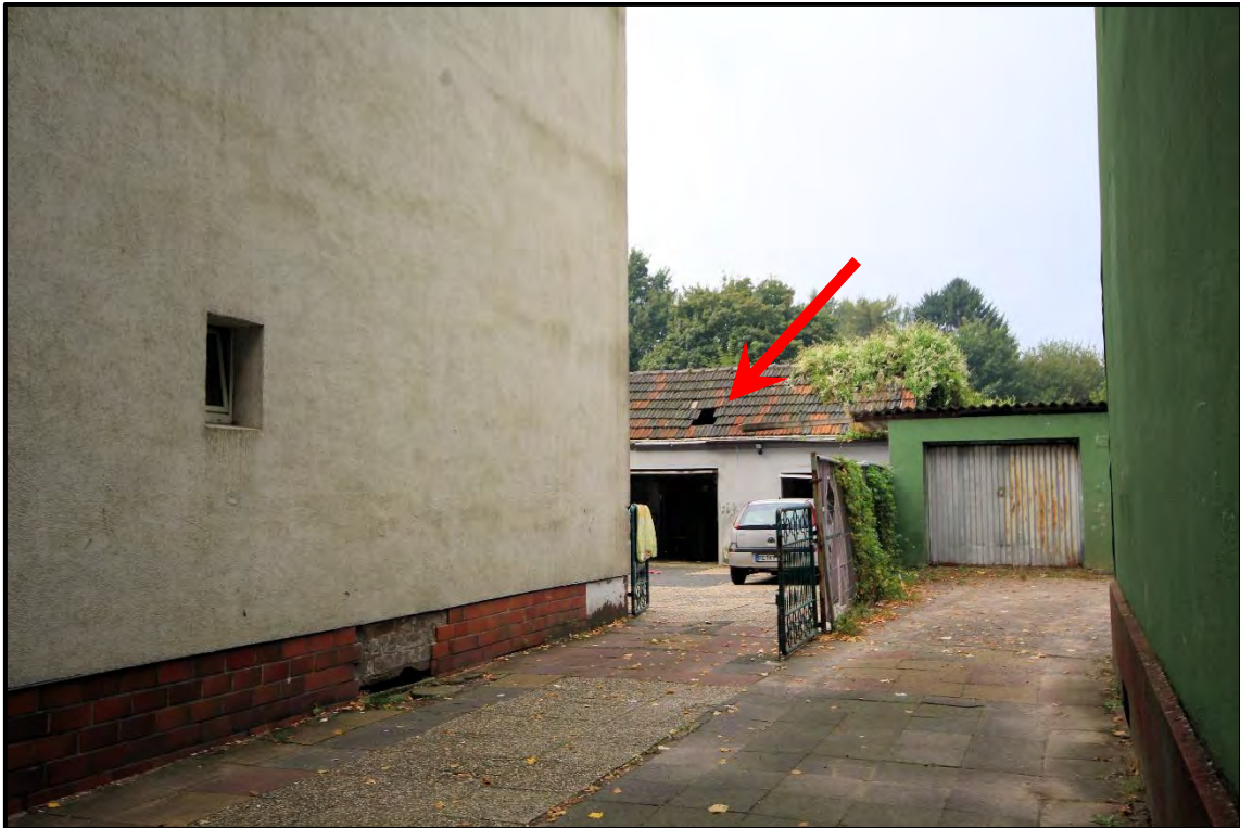
Bild 11: Blick in den rückwärtigen Hof mit dem geschädigten Garagengebäude