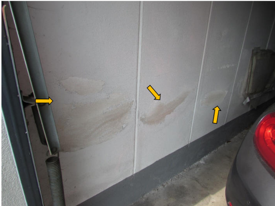
Foto 13: PKW-Fertigarage, Schäden und Feuchtigkeit im Wandbereich