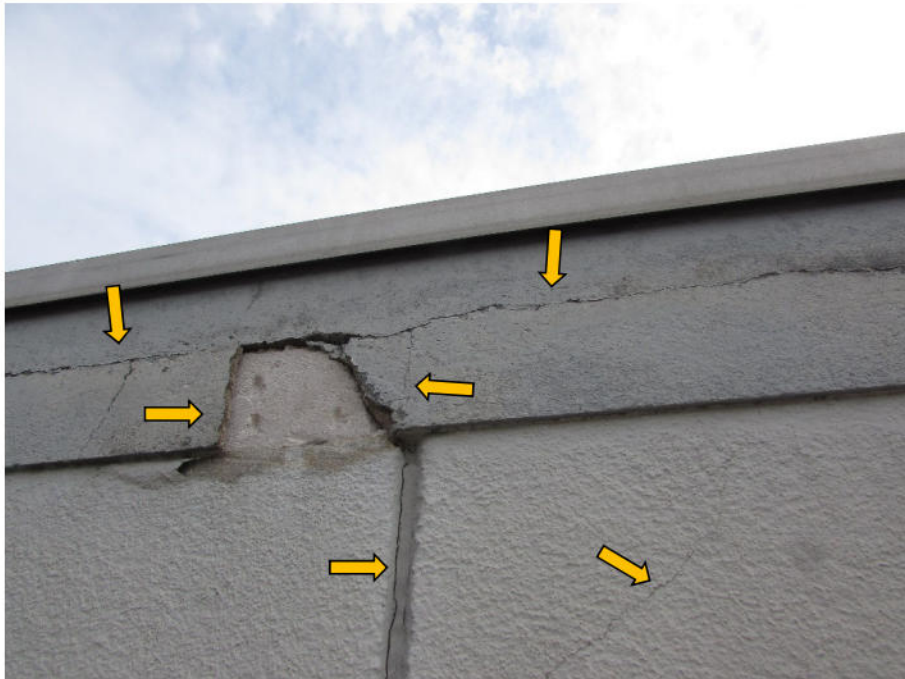
Foto 11: PKW-Fertigarage, Risse und Beschädigungen an der Fassade