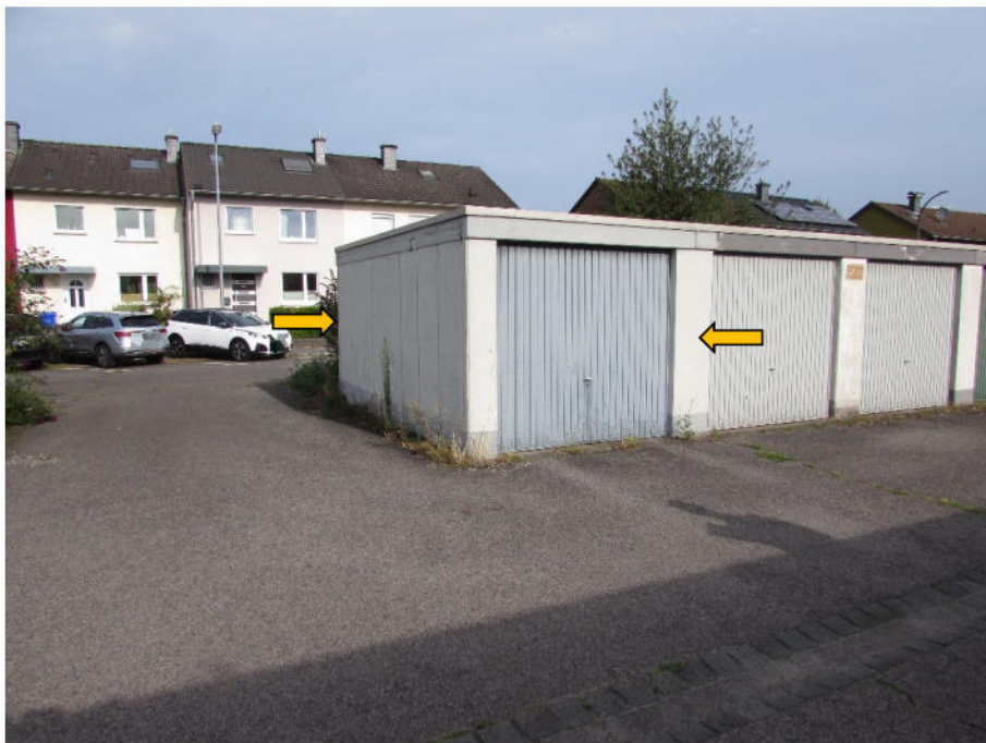
Foto 10: Flurstücke 1502, 1478 und 1446 : PKW-Fertigarage, Front-/Seitenansicht