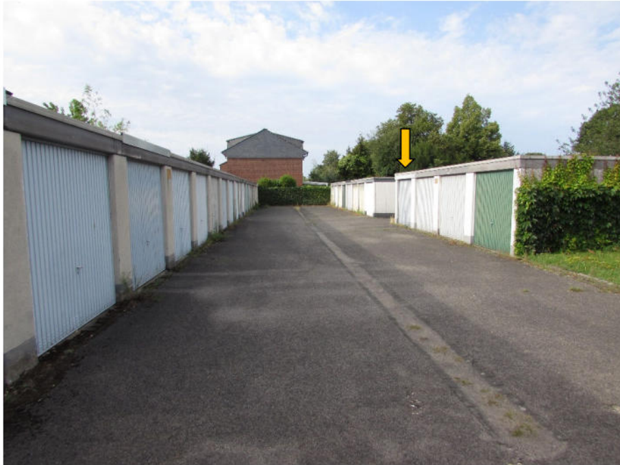
Foto 9: Garagenvorplatz Flurstücke 1478 und 1446 : PKW-Fertigarage (rechts)