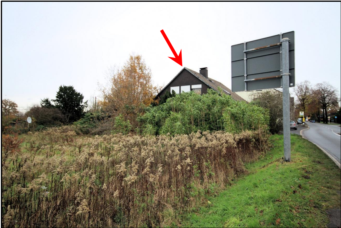
Bild 11: Ansicht von Südwesten mit Blick in die Schachtstraße nach Nordosten