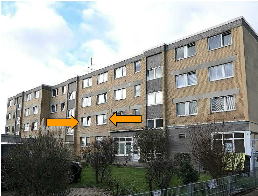
Straßenansicht von Nordosten