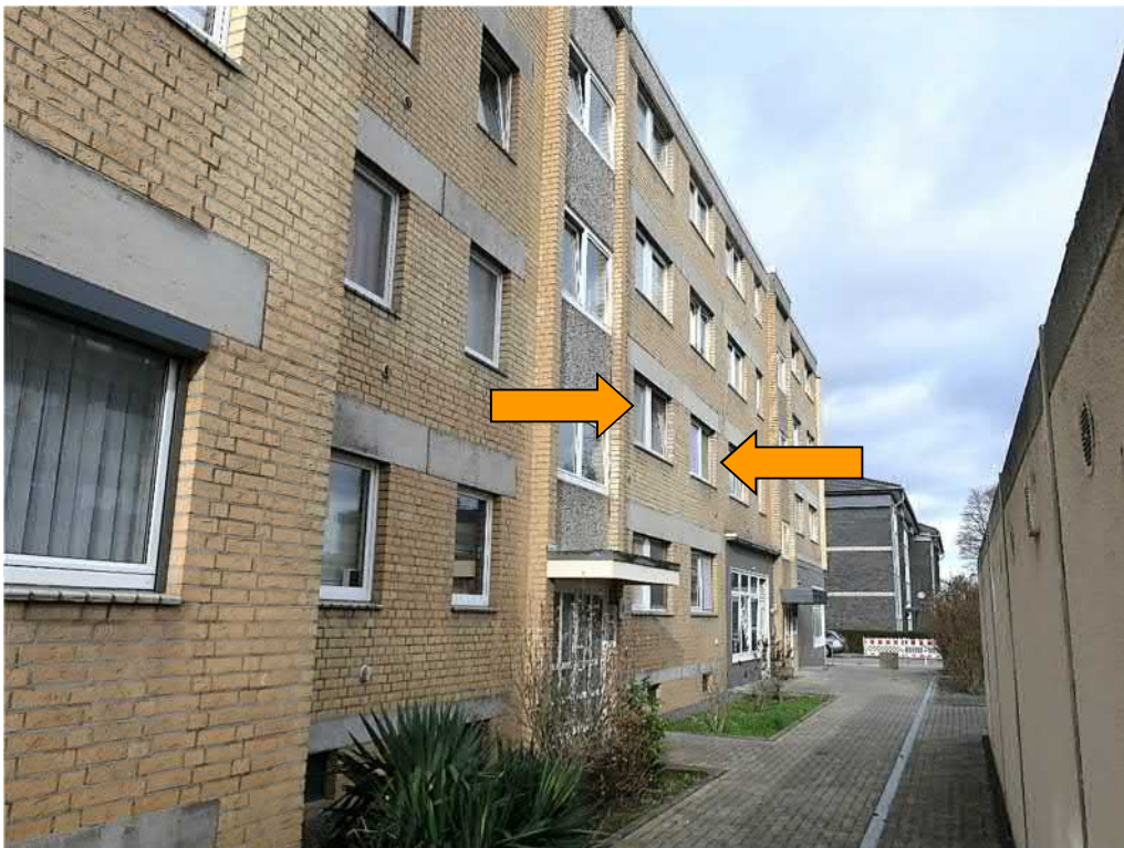
Zugang zu den Häusern Theodor-Heuss-Straße 3 und 5