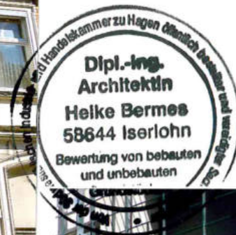
Bild 1 und 2 Straßenseitige Ansicht des zu be- wertenden Mehrfamilienhauses Hohler Weg 23 in Iserlohn