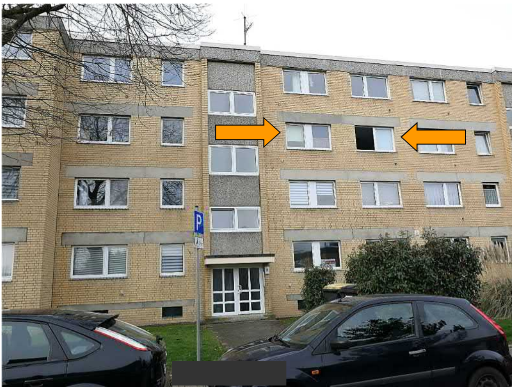
Straßenansicht von Nordosten