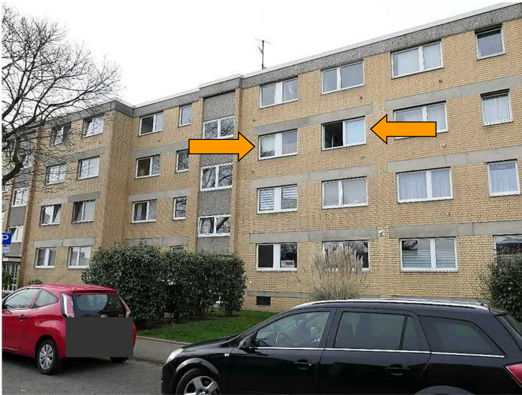
Straßenansicht von Nordosten