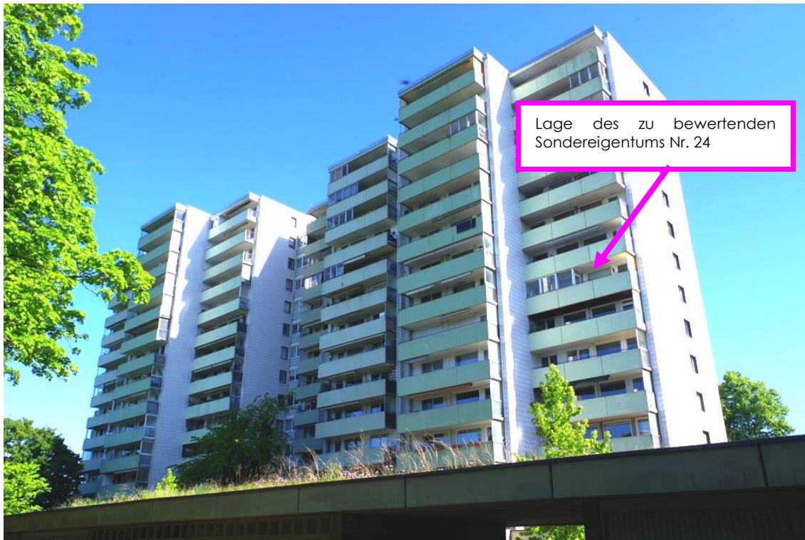
Bild 3: Rückansicht des Gebäudekomplexes aus Süd mit Lagekennzeichnung der Bewertungseinheit Nr. 24