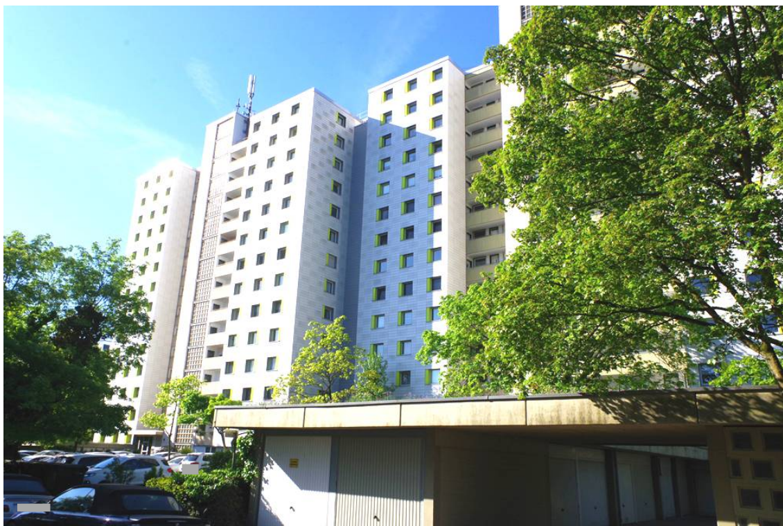
Bild 4: straßenseitige Übersichtsaufnahme des Gebäudekomplexes Flachsbleiche 70, 72