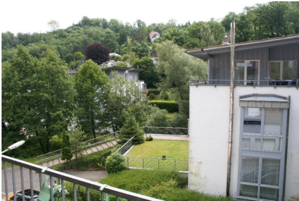
Bild 17: Ausblick Richtung Südosten (Straßenseite und Nachbarbebauung)