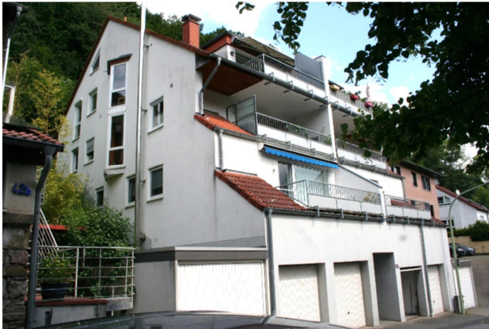
Bild 3: Straßenansicht / Südwestgiebel und Südostansicht und Bauwichegarage