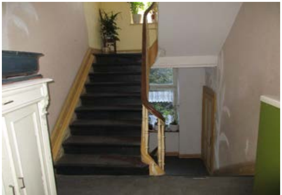
Foto 24 Treppe zum DG