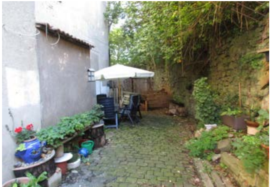
Foto 14 Schuppen im Südosten