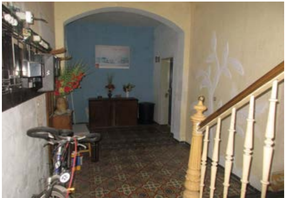
Foto 21 Treppenhausflur im EG