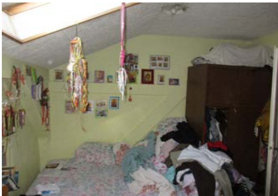
Foto 52 Wohnung D3, Kind mit Dachflächenfenster