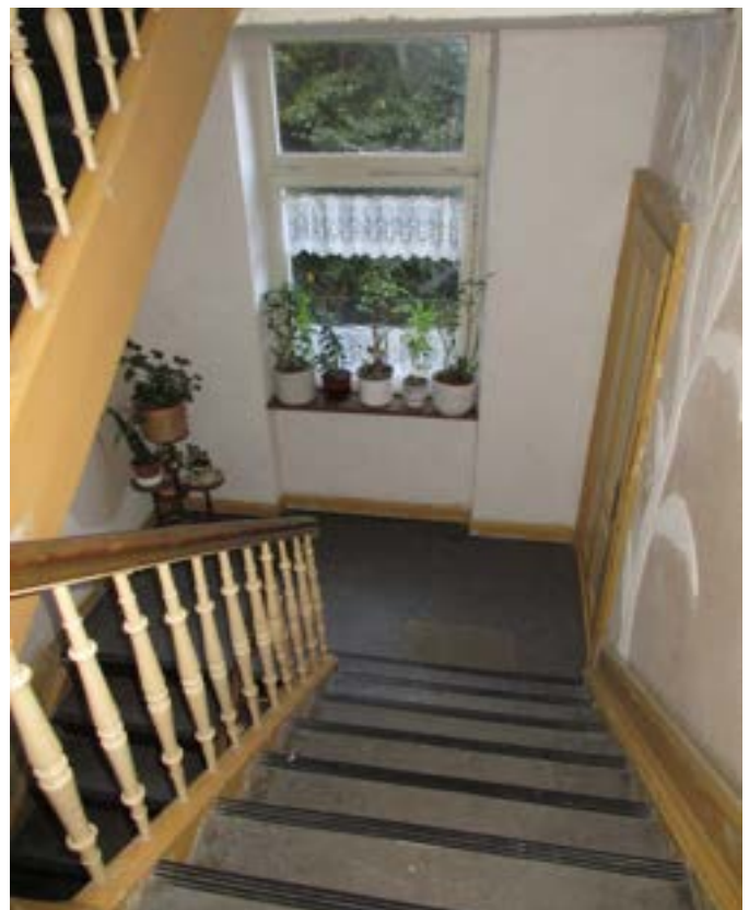
Foto 22 Treppe vom EG zum OG