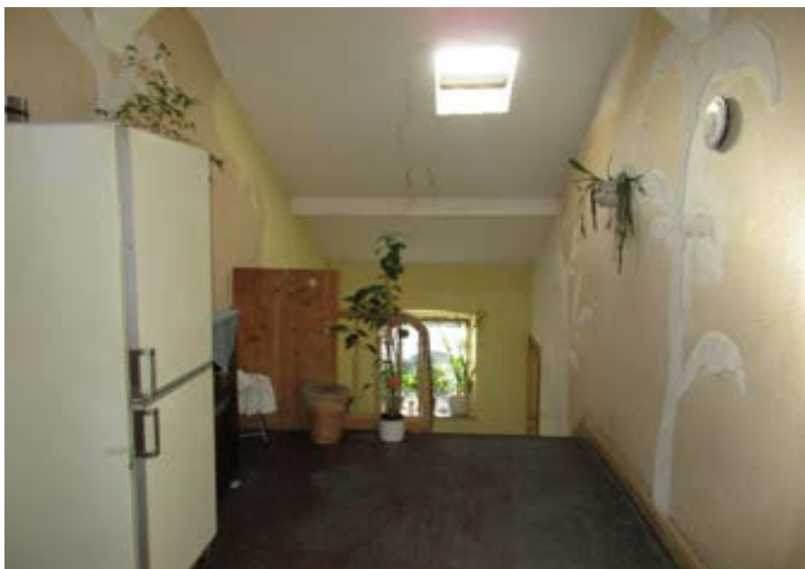
Foto 25 Treppenhausflur im DG