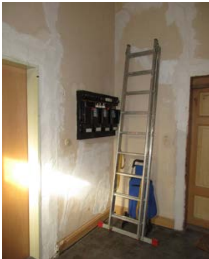
Foto 26 Elektrozählertafel im Treppenhausflur DG