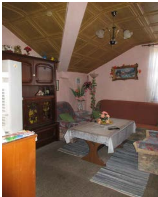
Foto 48 Wohnung D3, Wohnen