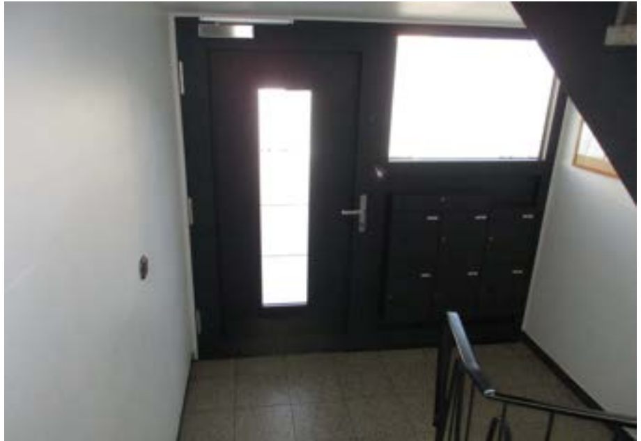
Foto 13 Hauseingangstür im EG