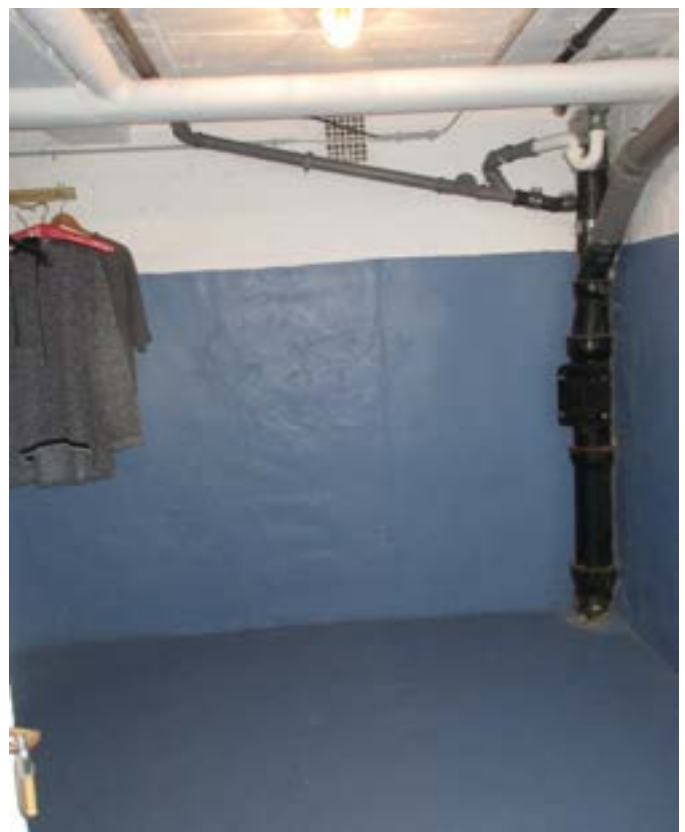
Foto 42 Trockenkeller