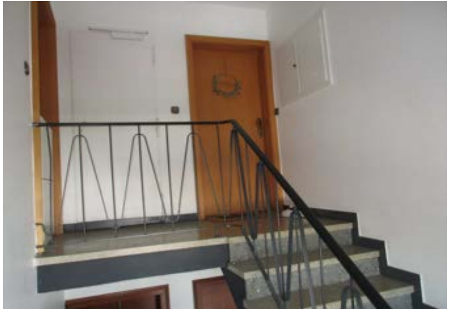
Foto 15 Treppenhaus im DG