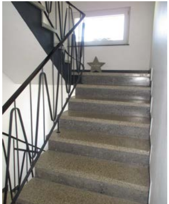
Foto 14 Treppenhaus OG/DG