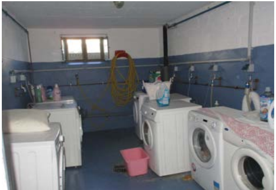
Foto 41 Waschküche