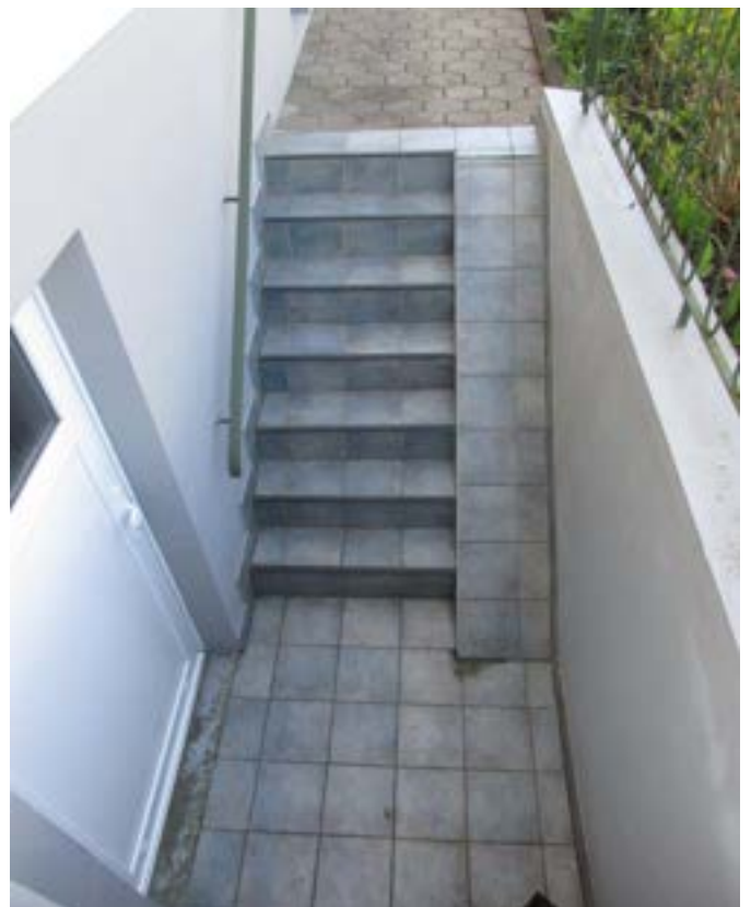
Foto 10 Kellerhalstreppe