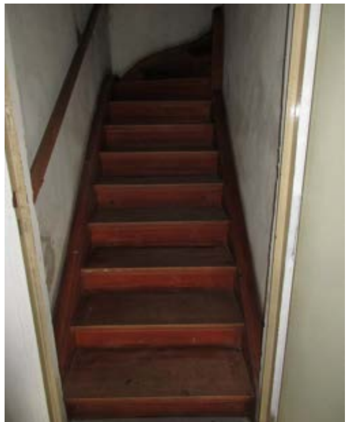
Foto 16 Treppe in den Spitzboden