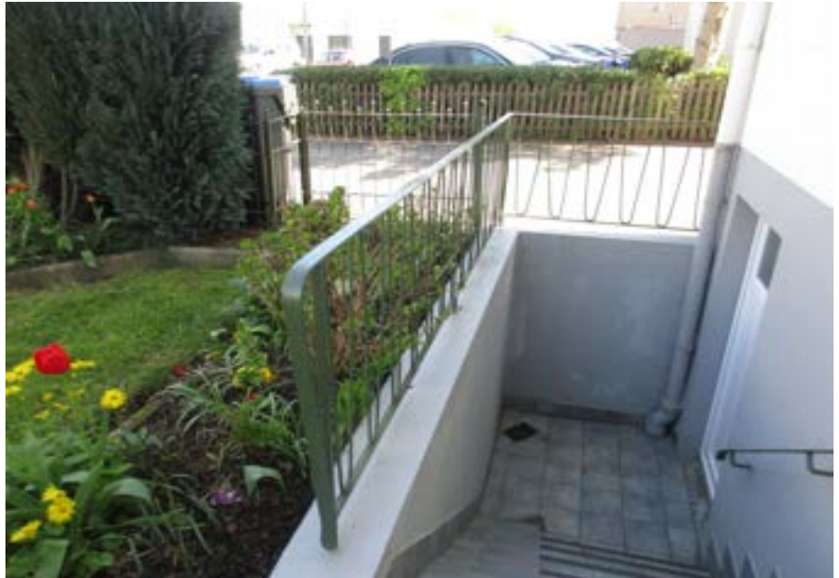
Foto 9 Kellerhalstreppe im Nordwesten