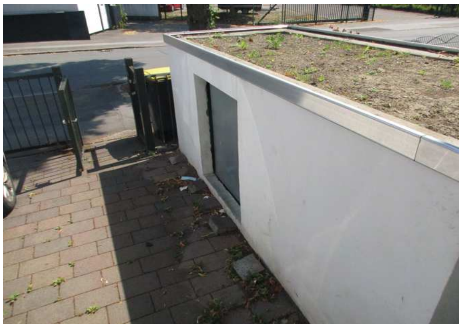
Foto 9 Abstellraum im Südosten