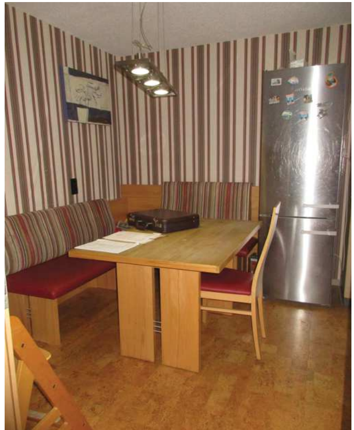
Foto 19 Küche im EG