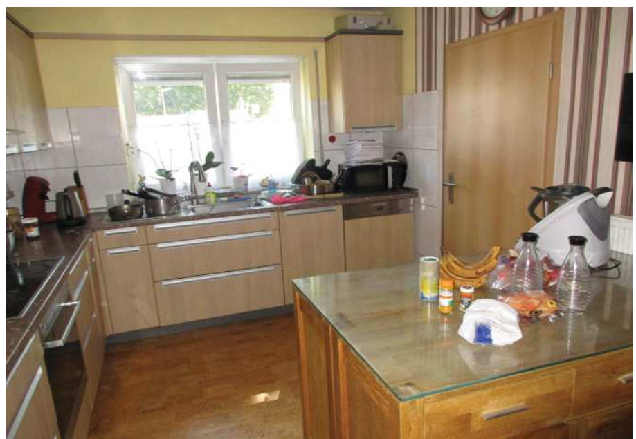
Foto 20 Küche im EG