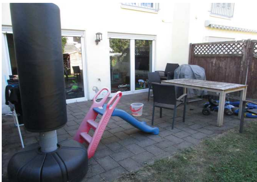
Foto 11 Terrasse im Nordwesten