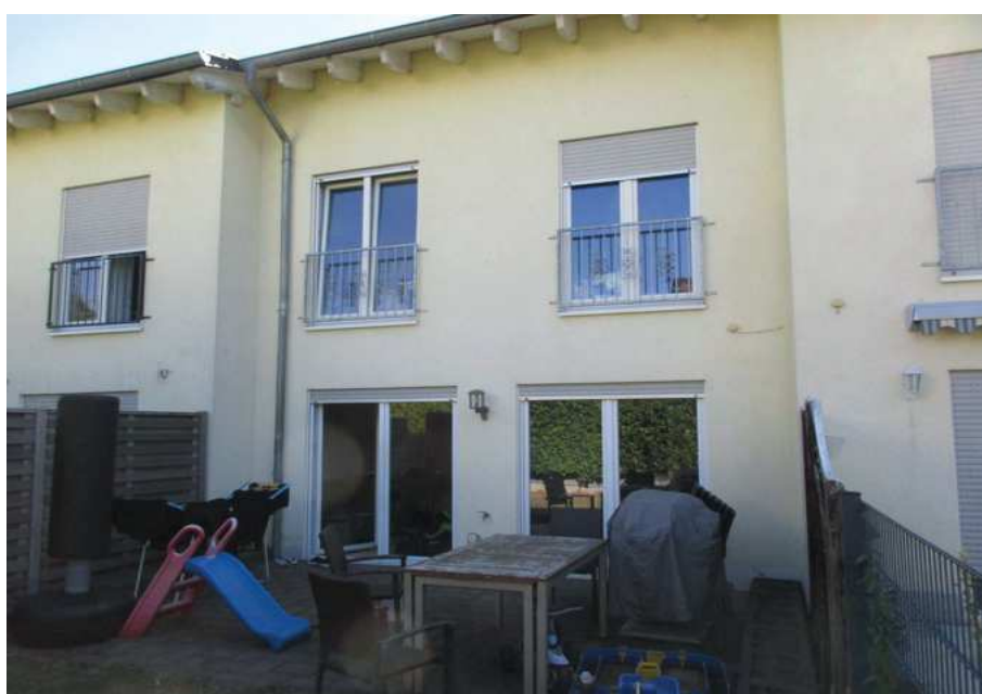
Foto 10 Nordwestfassade