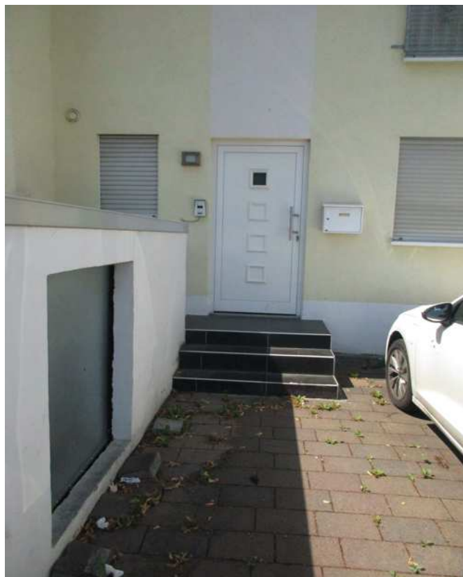
Foto 12 Hauseingangstür mit Zuwegung im Südosten