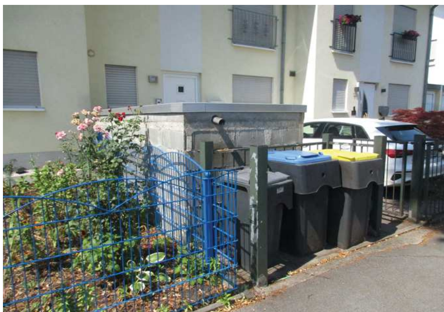
Foto 8 Abstellraum im Südosten