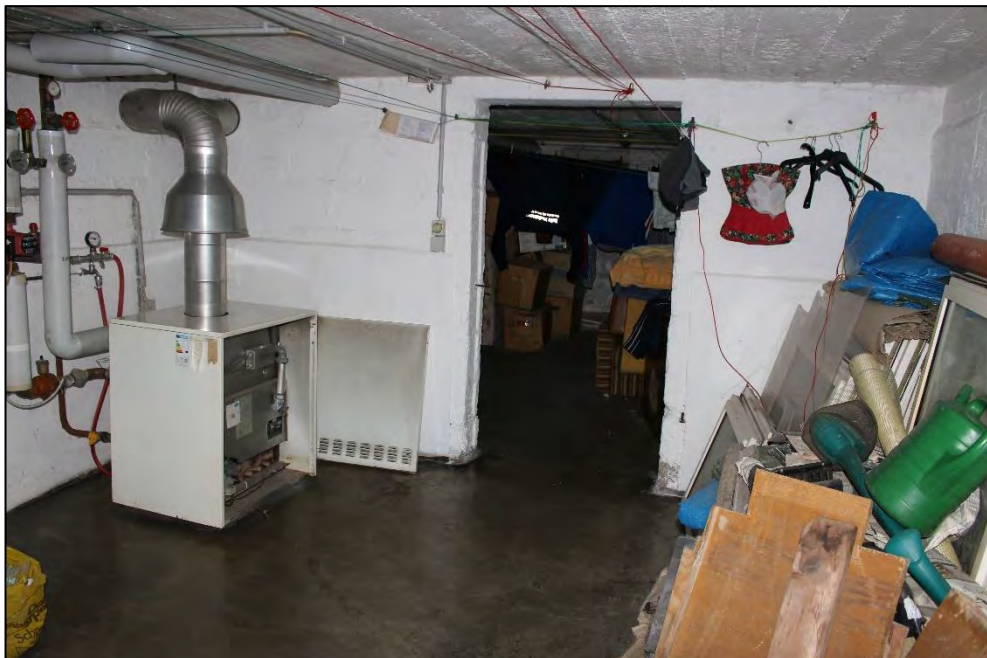
Foto Nr. 18: Kellergeschoss, Heizungsraum / Waschküche / Trockenraum