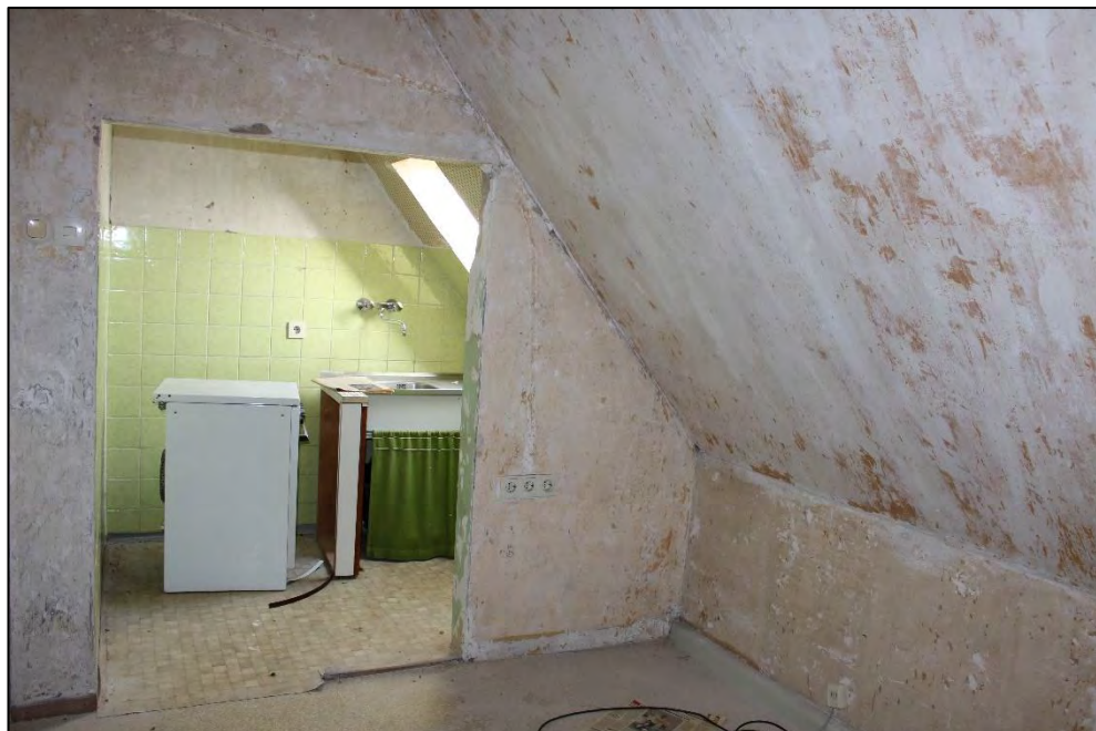
Foto Nr. 66: Dachgeschoss rechts, WE Nr. 6, Wohnzimmer / Kochnische