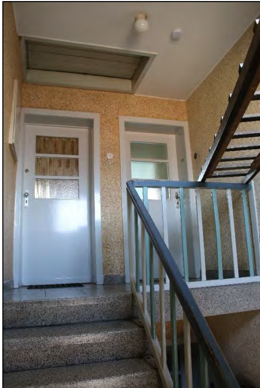
Foto Nr. 55: Gemeinschaftstreppehaus, Dachgeschoss, Eingang WE Nr. 5 / WE Nr. 6