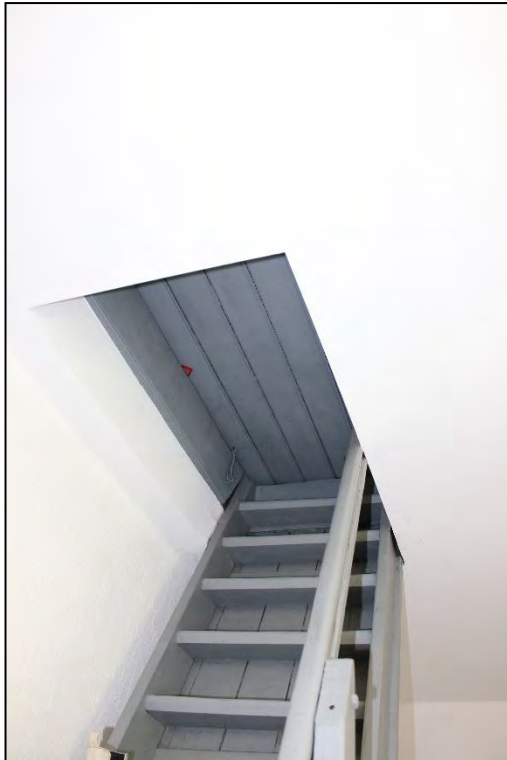
Foto Nr. 31: Gemeinschaftstreppehaus, Dachgeschoss, Treppe zum Dachboden