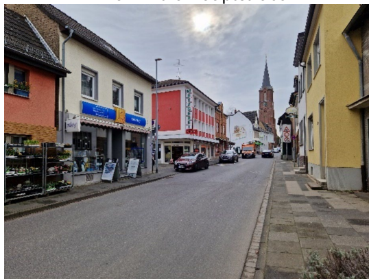
Blick in die Hauptstraße