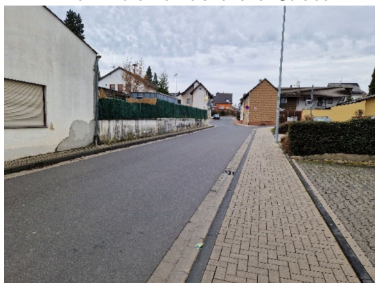
Blick in die Ramelshovener Straße