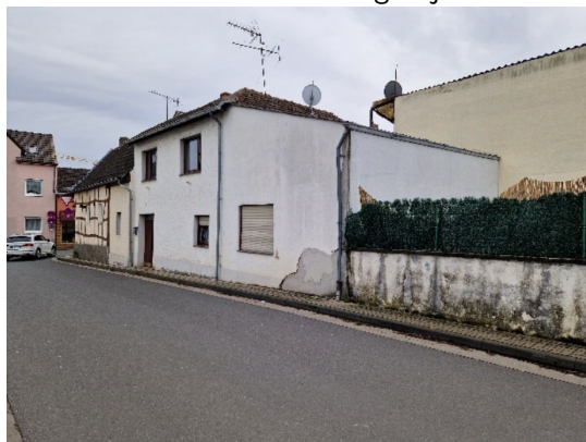
Ansicht des Bewertungsobjektes