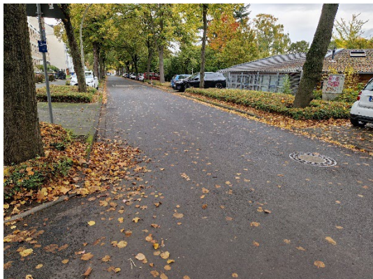
Blick in die Hainstraße