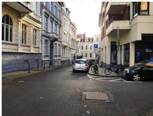
Blick in die Hans-Iwand-Straße