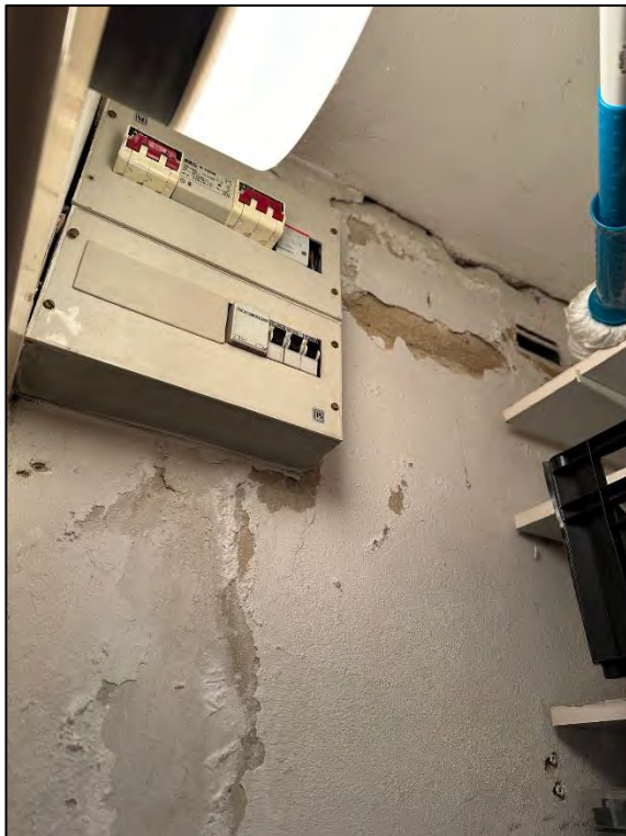
Foto Nr. 49: Dachgeschoss, WE Nr. 2, Abstellraum, Elektrounterverteilung