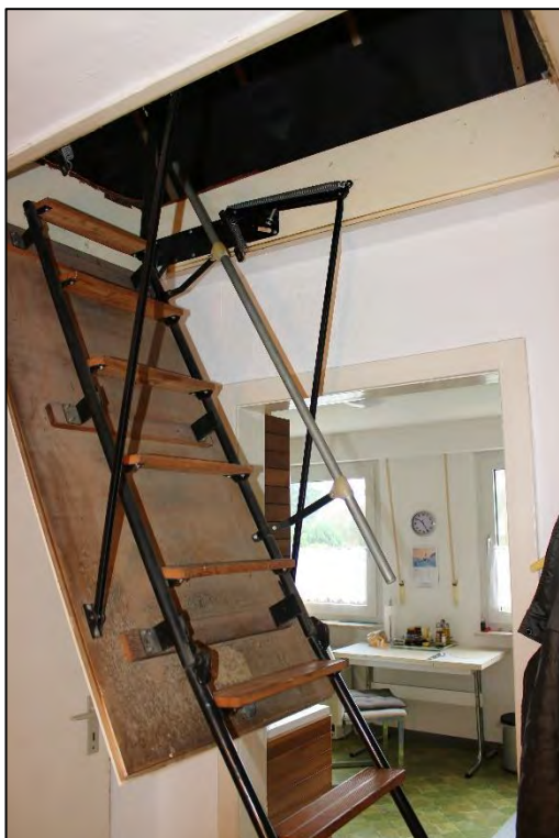
Foto Nr. 50: Dachgeschoss, WE Nr. 2, Bodeneinschubtreppe zum Spitzboden