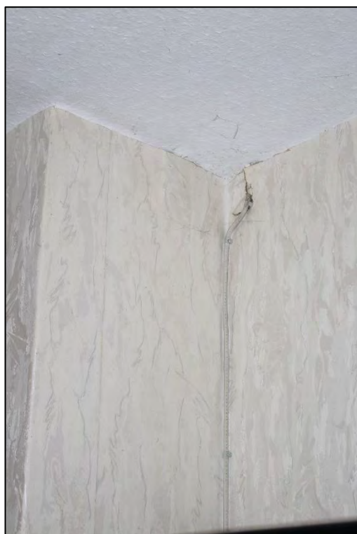
Foto Nr. 44: Dachgeschoss, WE Nr. 2, Schlafzimmer, Leitungsverlegung