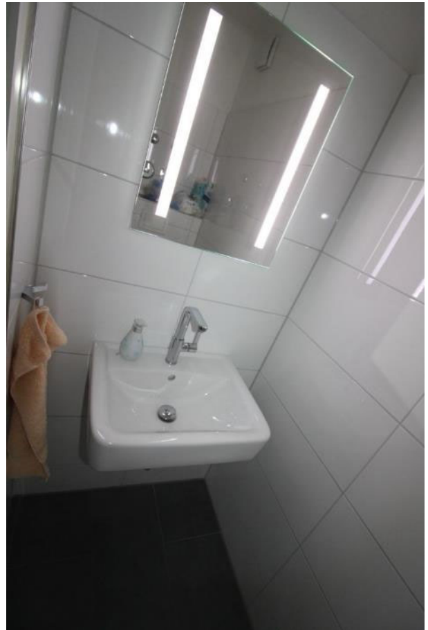
Sicht in das WC.