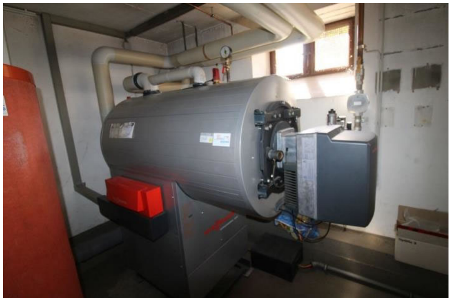
Sicht in den Heizraum / KG.