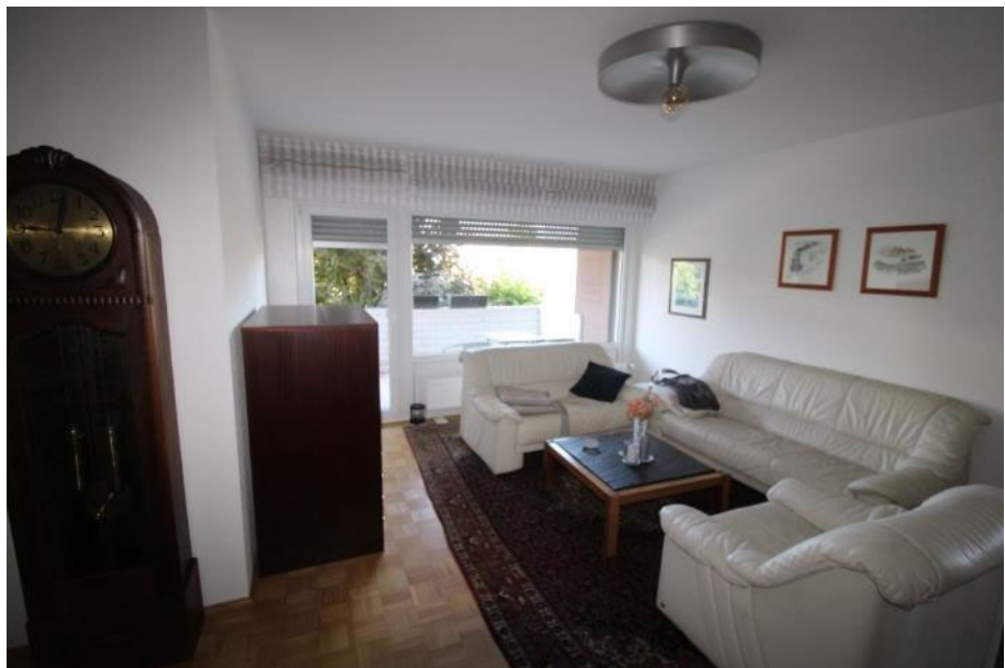
Sicht in das Wohn-/ Esszimmer.