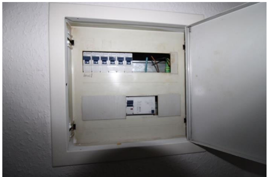
Sicht auf die Elektro- unterverteilung in der Diele.