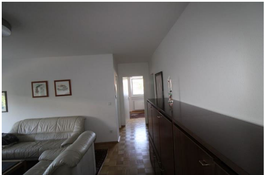
Sicht in das Wohn-/ Esszimmer.