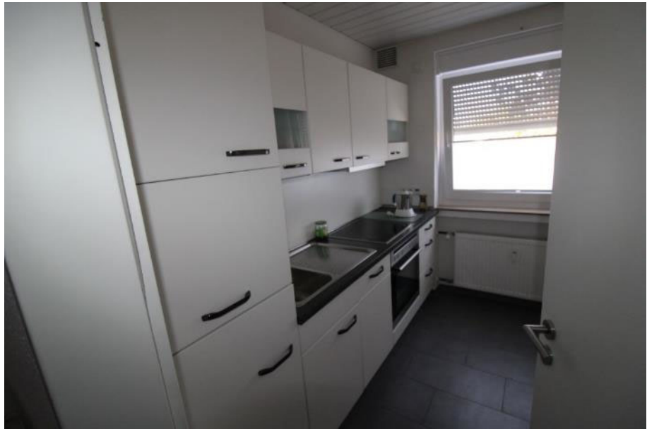
Sicht in die Küche.