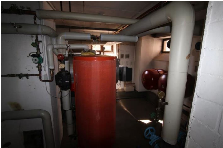
Sicht in den Heizraum / KG.