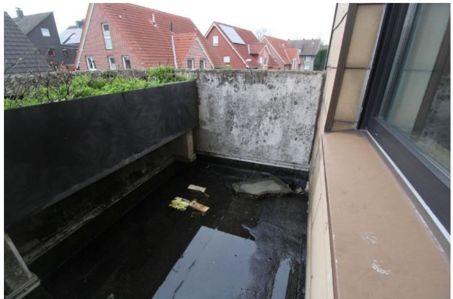
Sicht auf den Balkon 1