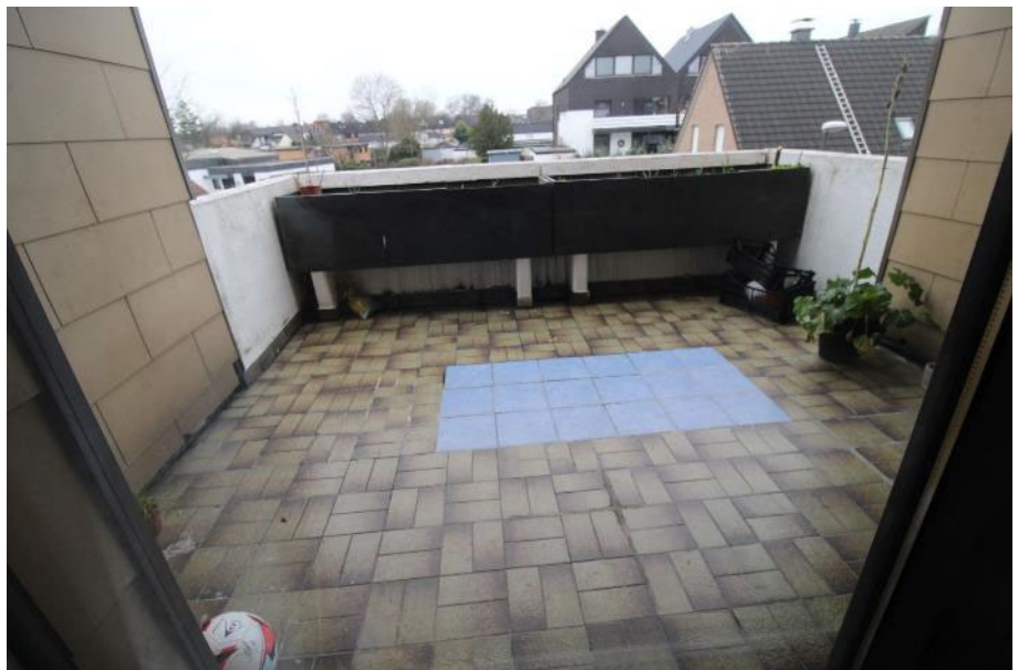
Sicht auf den Balkon 2