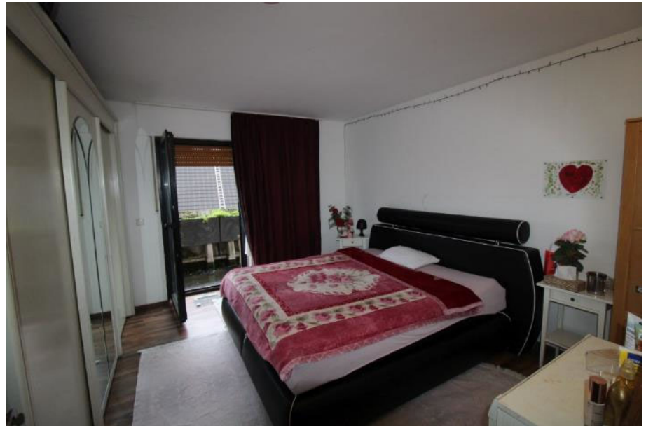
Sicht in das Zimmer 1