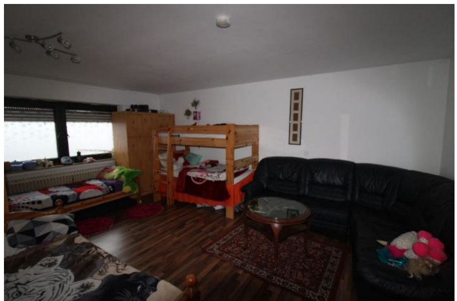
Sicht in das Zimmer 2