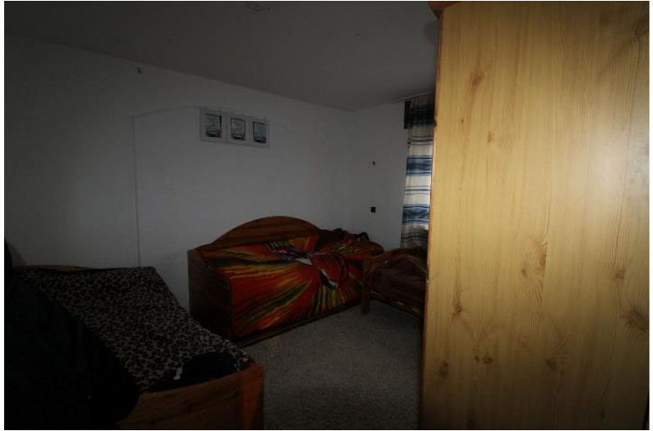
Sicht in das Zimmer 3