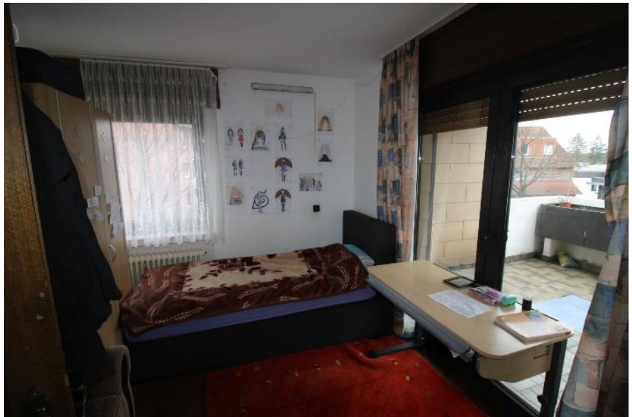
Sicht in das Zimmer 4