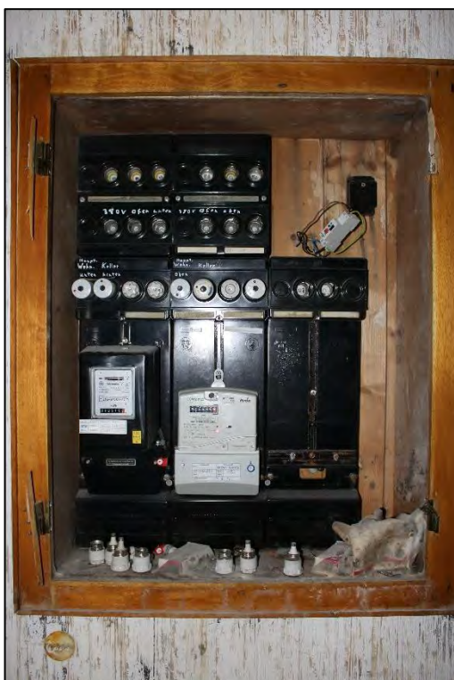
Foto Nr. 36: Erdgeschoss, Gemeinschaftstreppenhaus, Elektrounterverteilung / Feuchteschäden