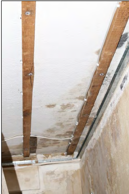
Foto Nr. 45: Erdgeschoss, ETW Nr. 1, Arbeitszimmer / Feuchteschäden