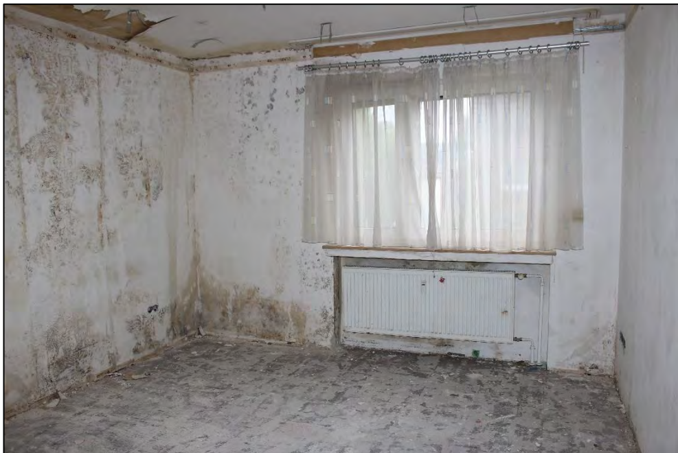
Foto Nr. 38: Erdgeschoss, ETW Nr. 1, Schlafzimmer / Feuchteschäden