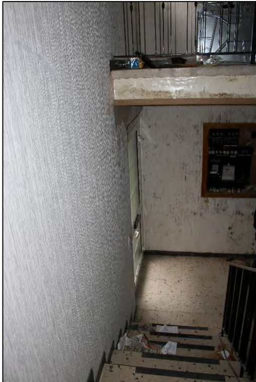
Foto Nr. 49: Erdgeschoss / Dachgeschoss, Gemeinschaftstreppenhaus / Feuchteschäden