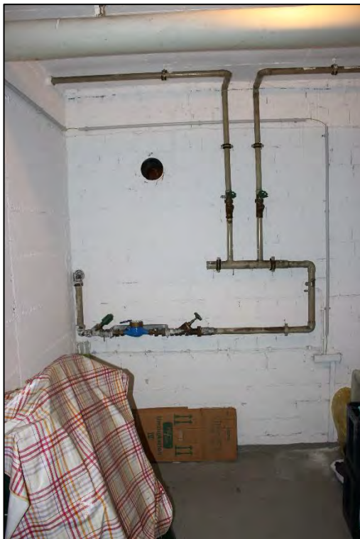
Foto Nr. 34: Langenbochumer Straße 453, Kellergeschoss, Hausanschlussraum