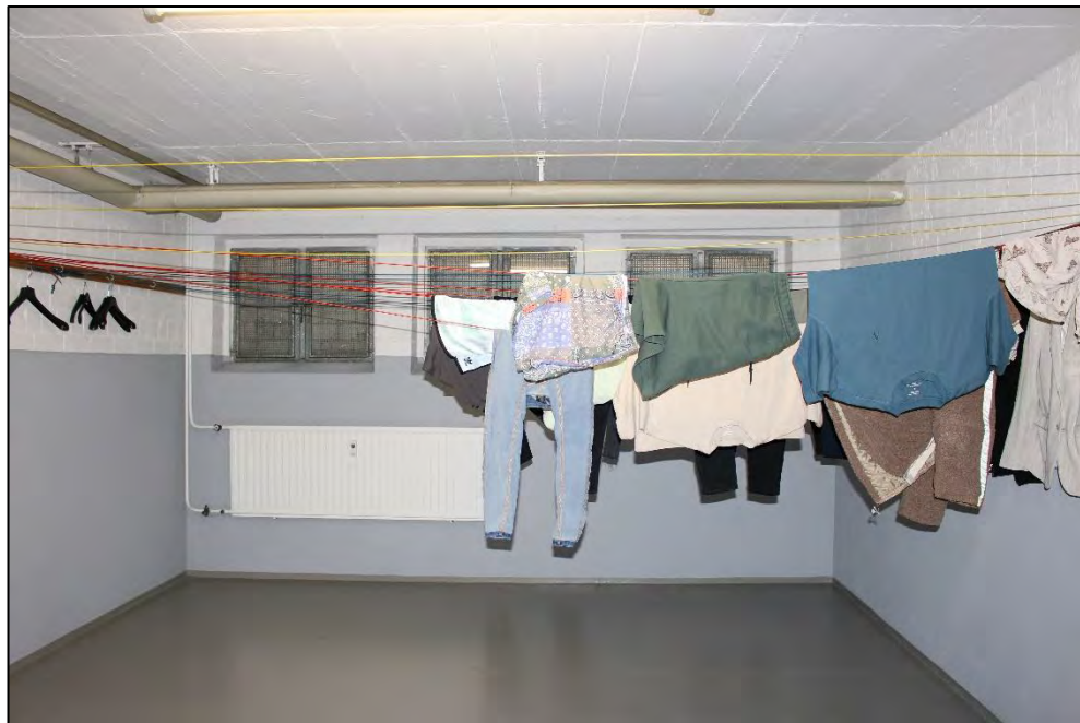
Foto Nr. 27: Langenbochumer Straße 453, Kellergeschoss, Waschküche