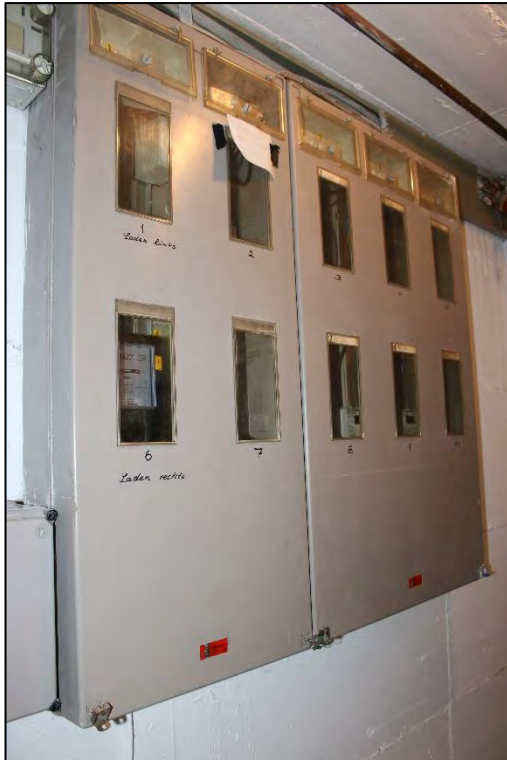
Foto Nr. 33: Langenbochumer Straße 453, Kellergeschoss, Kellerraum / Elektrounterverteilung