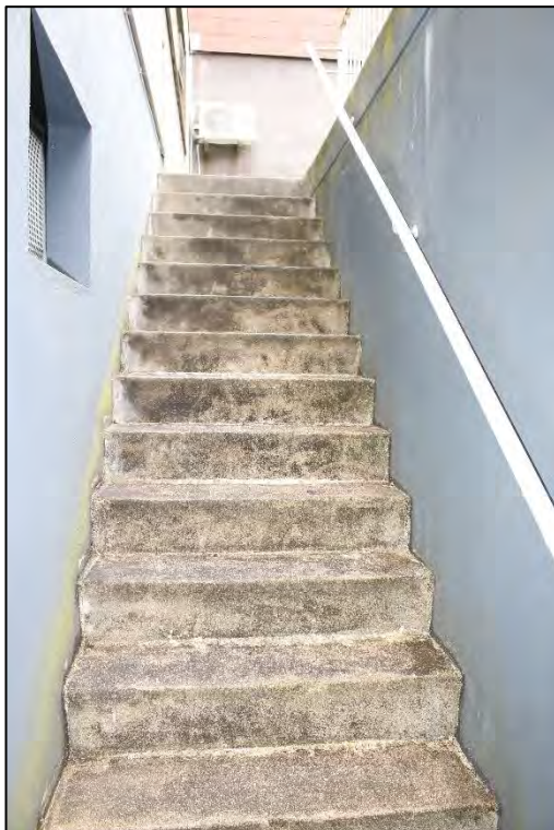
Foto Nr. 30: Langenbochumer Straße 453, Kellergeschoss, Kelleraußeneingang