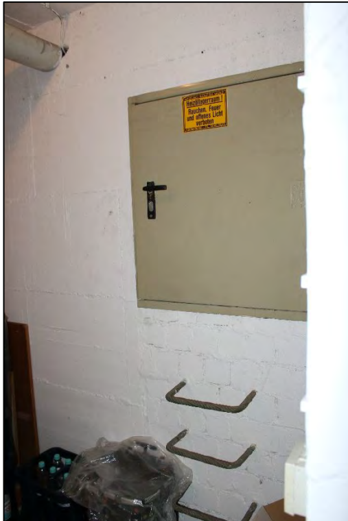
Foto Nr. 35: Langenbochumer Straße 453, Kellergeschoss, Öltanklagerraum