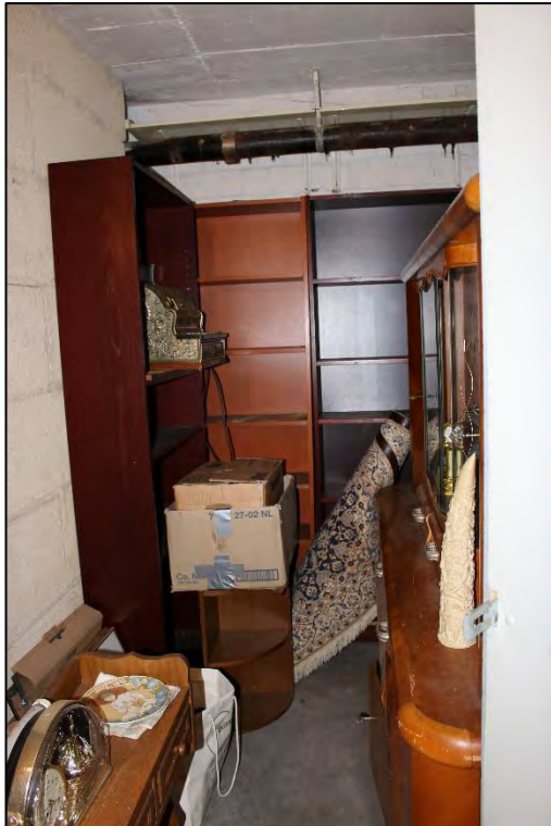
Foto Nr. 29: Langenbochumer Straße 453, Kellergeschoss, Abstellraum ETW Nr. 17