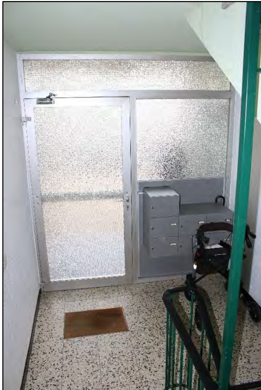
Foto Nr. 9: Langenbochumer Straße 453, Gemeinschaftstreppe, Hauseingang