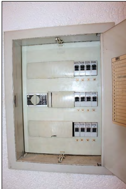
Foto Nr. 15: Langenbochumer Straße 453, 2. OG, ETW Nr. 17, Elektrounterverteilung