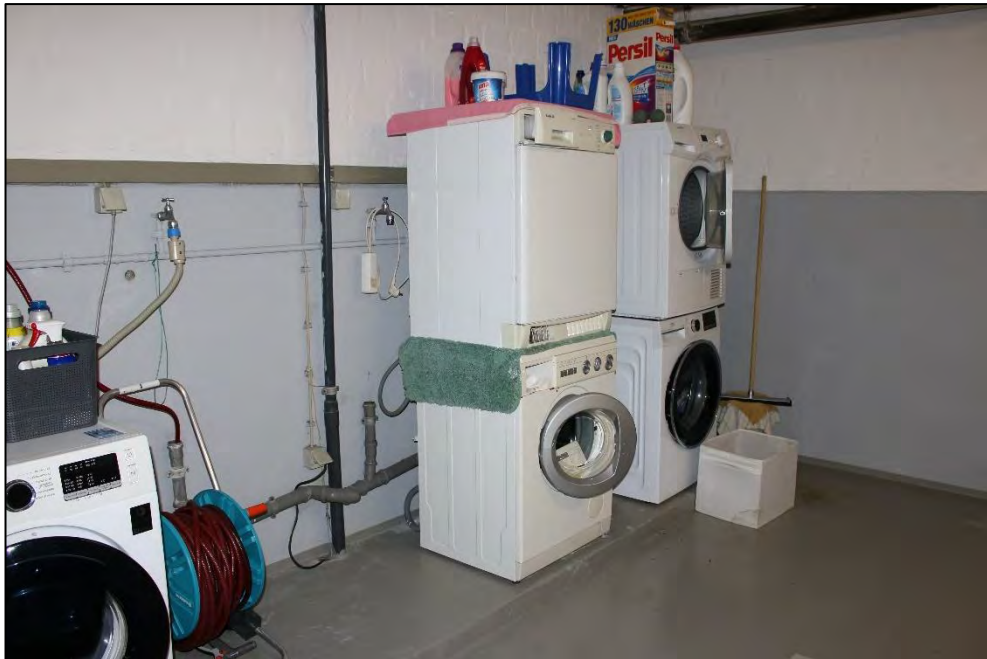
Foto Nr. 26: Langenbochumer Straße 453, Kellergeschoss, Waschküche