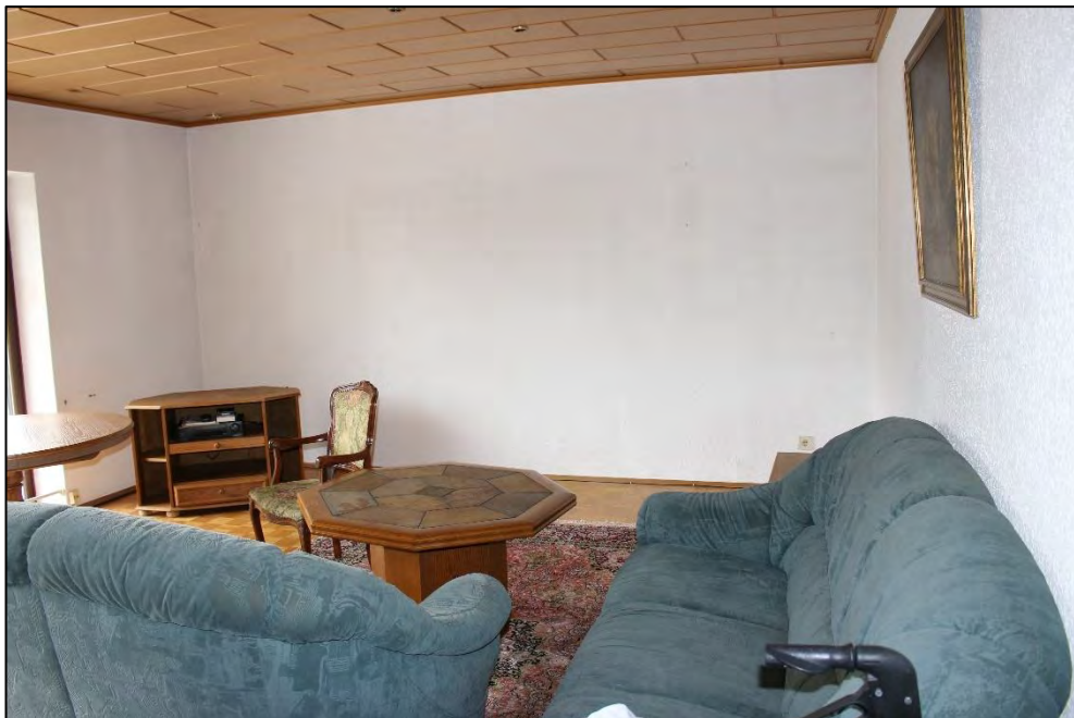
Foto Nr. 22: Langenbochumer Straße 453, 2. OG, ETW Nr. 17, Wohnzimmer