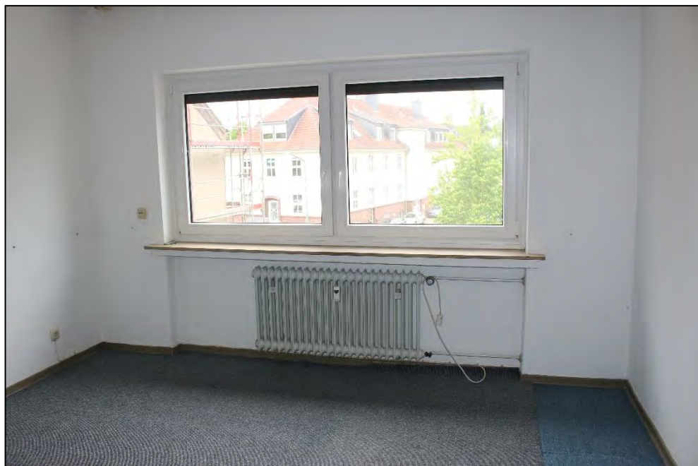
Foto Nr. 16: Langenbochumer Straße 453, 2. OG, ETW Nr. 17, Schlafzimmer