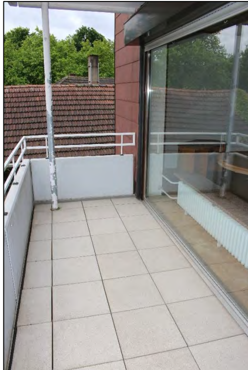
Foto Nr. 23: Langenbochumer Straße 453, 2. OG, ETW Nr. 17, Balkon