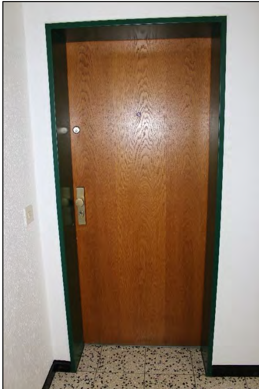
Foto Nr. 11: Langenbochumer Straße 453, 2. OG, ETW Nr. 17, Eingang