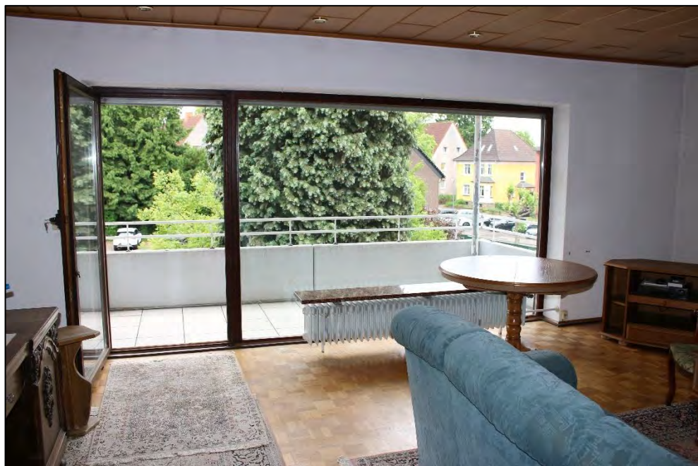
Foto Nr. 24: Langenbochumer Straße 453, 2. OG, ETW Nr. 17, Wohnzimmer / Balkon