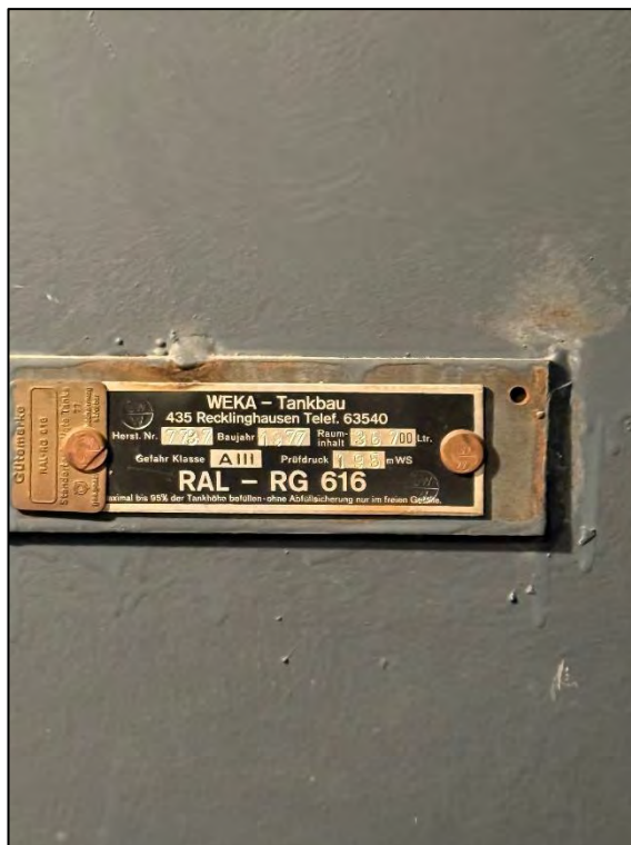
Foto Nr. 36: Langenbochumer Straße 453, Kellergeschoss, Öltankanlage