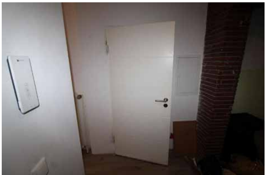
Sicht auf die Woh- nungseingangstür / EG links