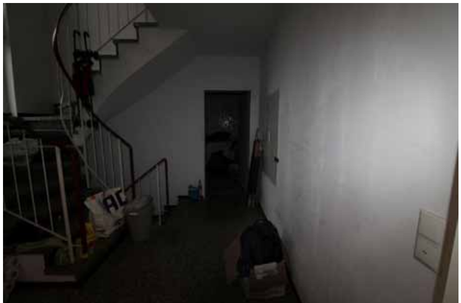
Wohnung Erdge- schoss links: