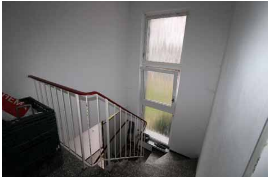
Wohnung Obergeschoss rechts: