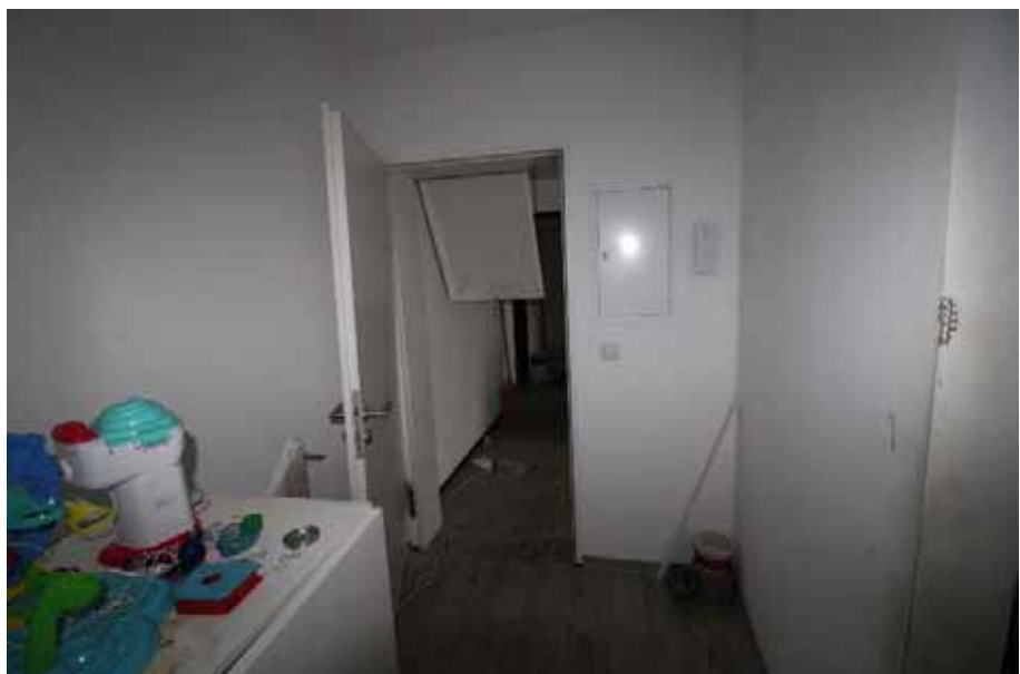
Sicht in den Flur mit Blickrichtung Woh- nungseingangstür und Treppenhaus / OG links