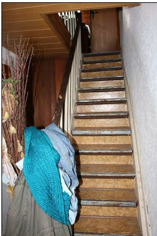
Foto Nr. 14: Erdgeschoss, Eingangsbereich / Treppe zum Dachgeschoss