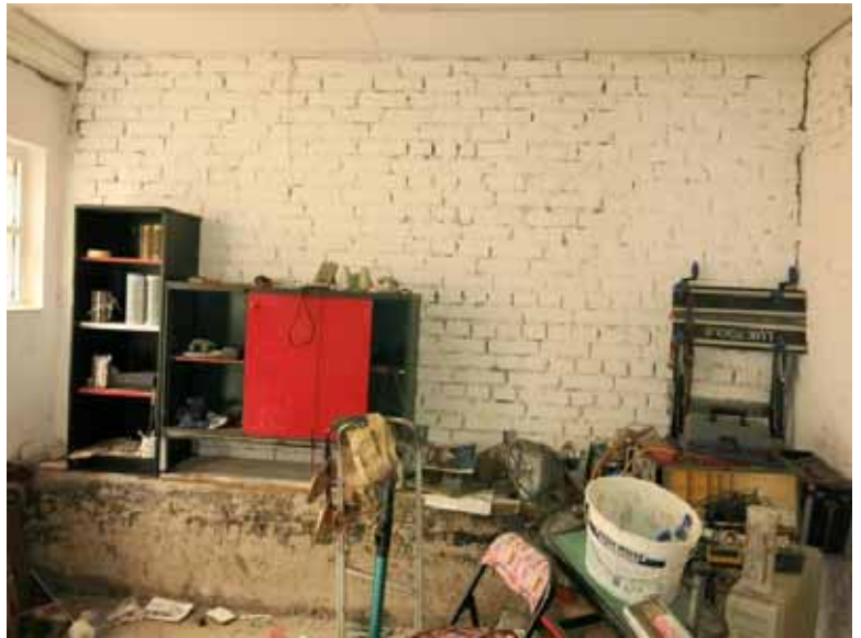
Beispiel Nebengebäude D) „Werkstatt“ (alter Pferdestall)