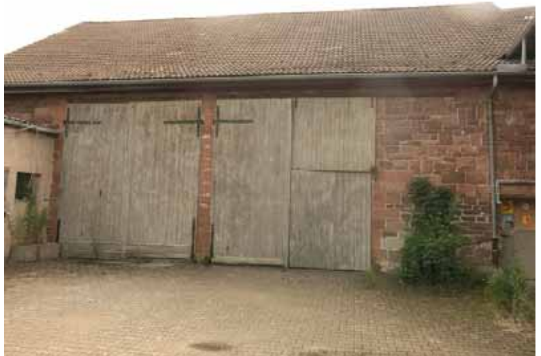
Hofseite; Garage 1 und „Werkstatt“ (alte Ställe D)