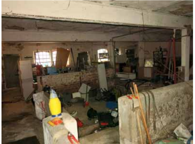
Beispiel Stallung B) EG