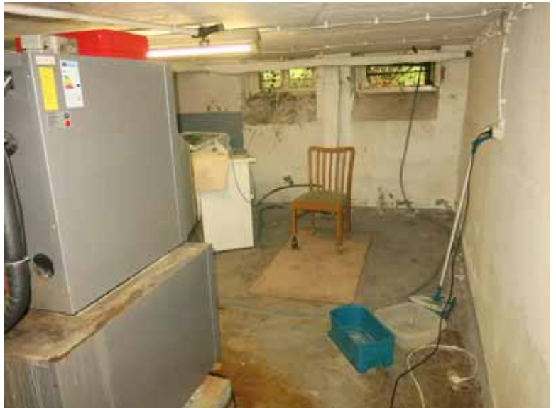
Beispiel A) KG: Heizungsraum (rostige Wasserflecken unter der Heizung)