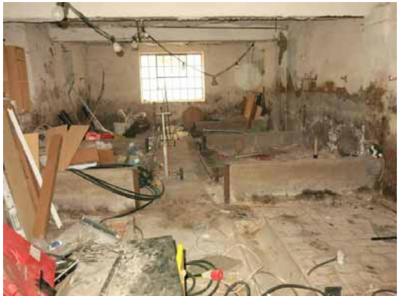
Beispiel Stallung B) EG-Decke