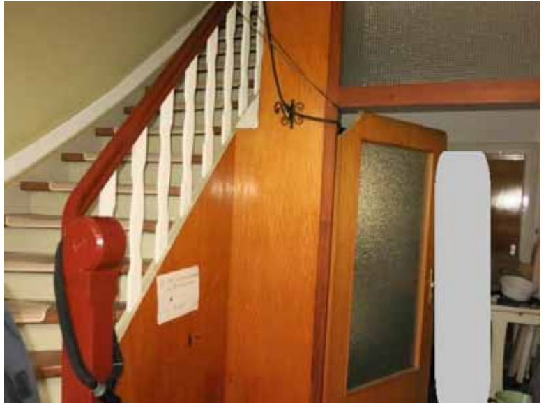
Beispiel Wohnhaus A) im EG; Eingang / WF / Treppenflur