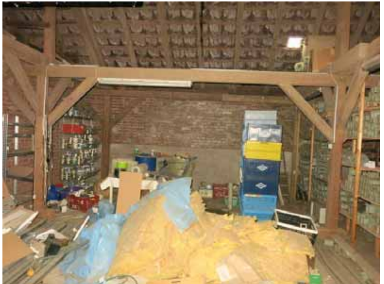
Beispiel Stallung B) OG (in der Gebäudemitte zum Dach hin offen)