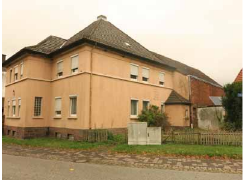
Westfalenstraße 43, Ansicht von Süden: Wohnhaus A), rechts die Stallung B)