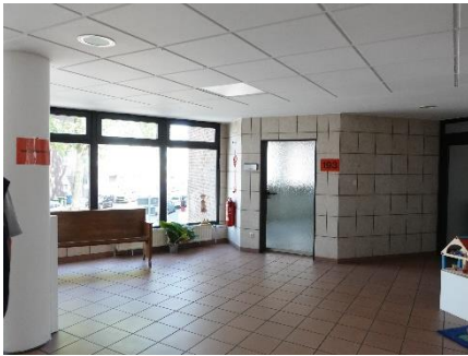
1. Obergeschoss - Wartezone