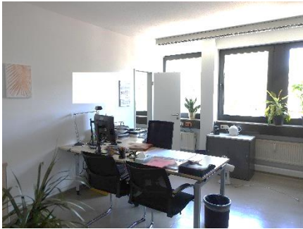
3. Obergeschoss – Büroraum