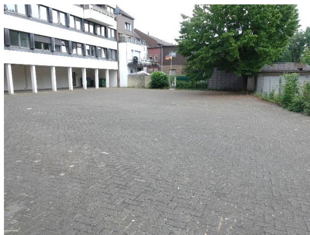
Bild 6 Rückwärtige Hoffläche / PKW-Stellplätze