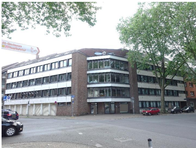
Bild 1 Vorder-/Gesamtansicht

Lichtbilddokumentation - Aufnahmen vom 16.06.2023