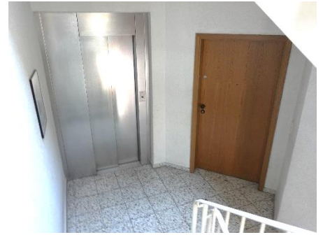
Treppenhaus zu den Wohnungen