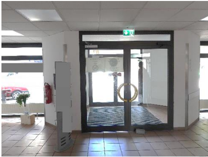
Erdgeschoss - Eingangsbereich