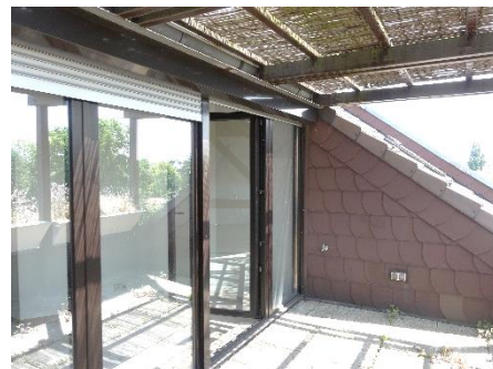
Wohnung im Dachgeschoss