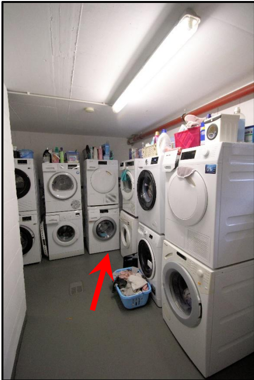
Bild 17: Waschkeller mit separaten Stellplätzen für Waschmaschine und Trockner Stellplatz Nr. 4 (roter Pfeil)