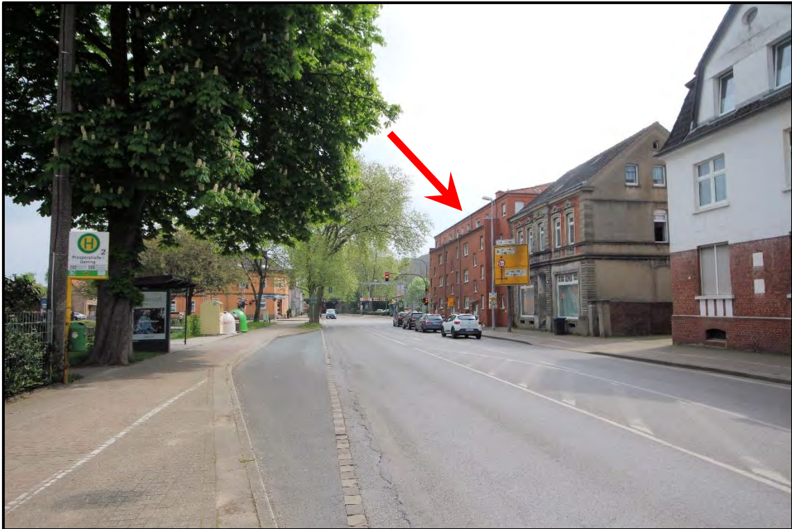
Bild 1: Blick in den Kreuzungsbereich der Prosperstraße und der Devensstraße