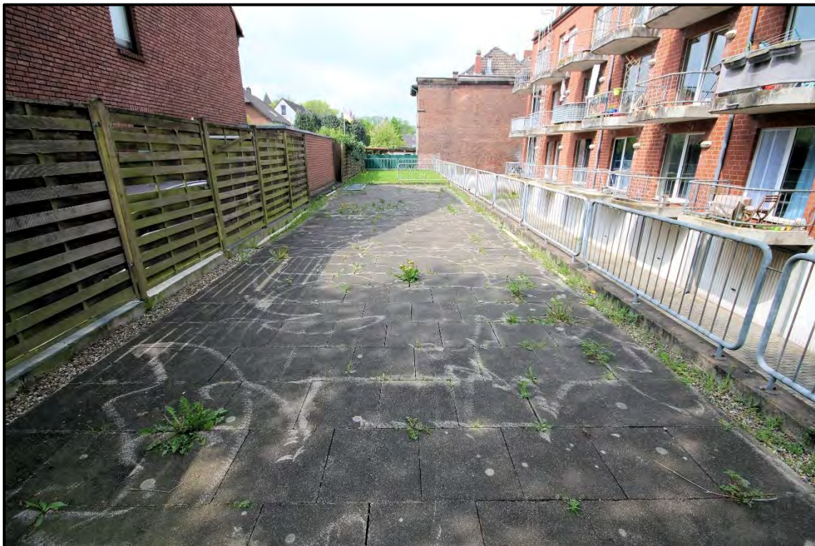
Bild 12: Garagendach, planungsrechtlich tlw. als Spielplatz ausgewiesen