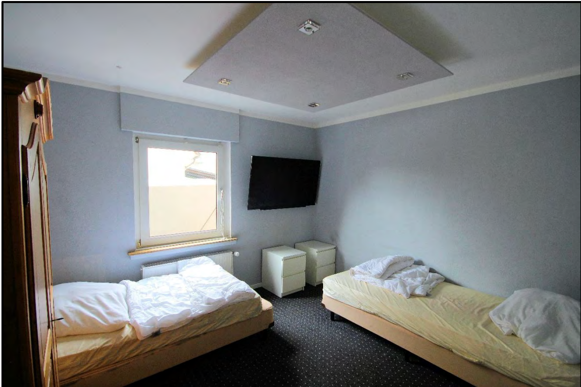
Bild 35: Kinderzimmer (ehemals Küche) der Wohneinheit im Erdgeschoss