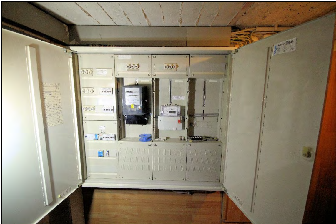
Bild 23: erneuerter Sicherungs- und Zählerschrank im Kellergeschoss